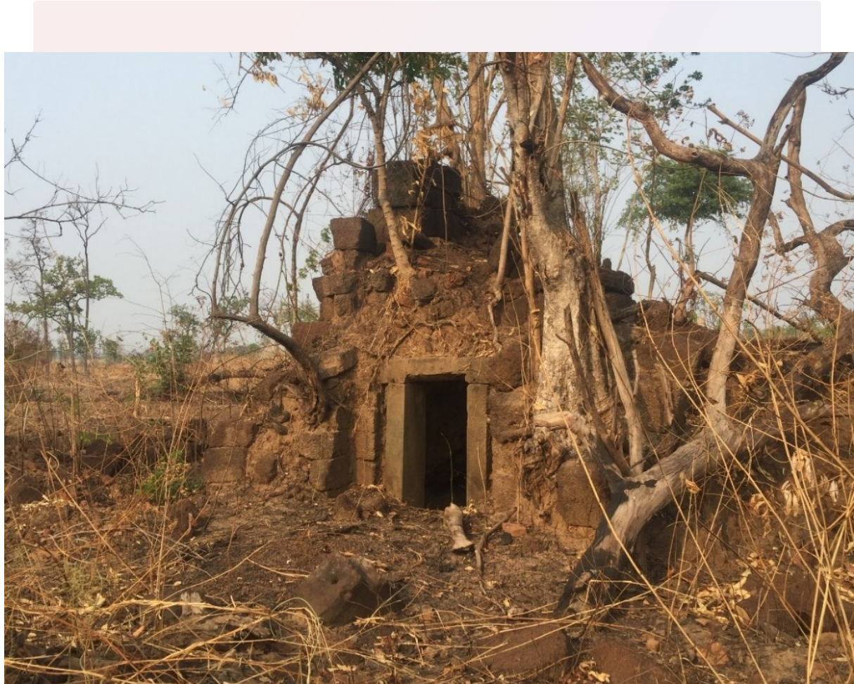
រូបលេខ១៖ ប្រាសាទសំរោង ស្រុកគូលែន ខេត្តព្រះវិហារ

ជារួមមក ថ្វីត្បិតតែសិលាចារឹកប្រាសាទសំរោង ដែលស្ថិតនៅក្នុងខេត្តព្រះវិហារ ធ្លាប់មានការកោសលុបអក្សររួចមកហើយក្តី ក៏ផ្នែកជាច្រើនដែលនៅអាចមើលឃើញបានផ្តល់ព័ត៌មានដល់អ្នកសិក្សាឱ្យដឹងថាគេចង់និយាយរៀបរាប់អំពីអ្វីដែរ។ សិលាចារឹកនេះទំនងជាអក្សរនៅរវាងស.វ.ទី៧ ឬទី៨ ដែលរៀបរាប់អំពីតង្វាយរបស់ឥសូរជនមួយចំនួនថ្វាយចំពោះព្រះសិវក្នុងព្រះនាមថា “ព្រះកម្រតាងអញ ស្រីកម្រេស្វរ។”