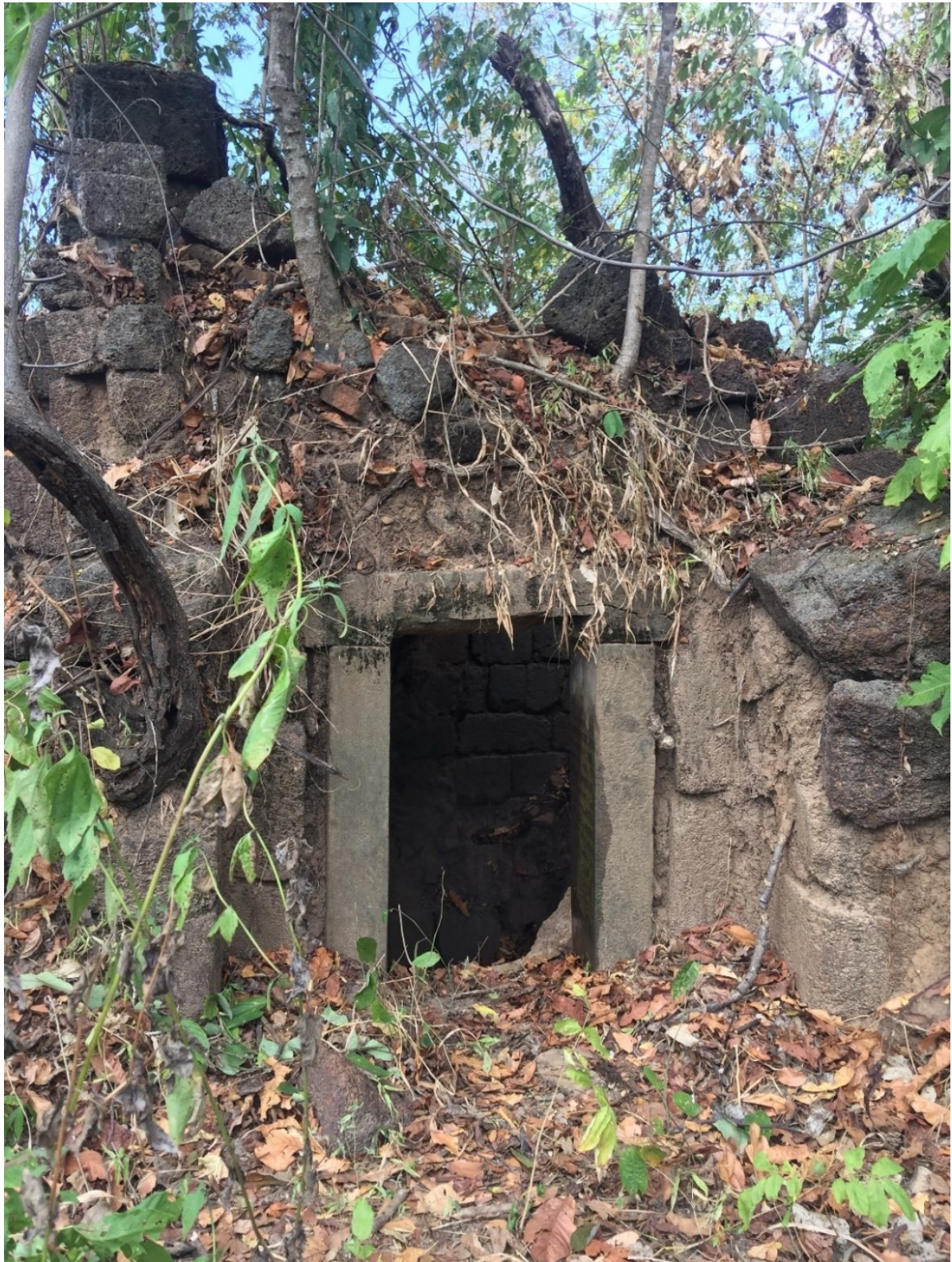
រូបលេខ២៖ ប្រាសាទសំរោង ស្រុកគូលែន ខេត្តព្រះវិហារ