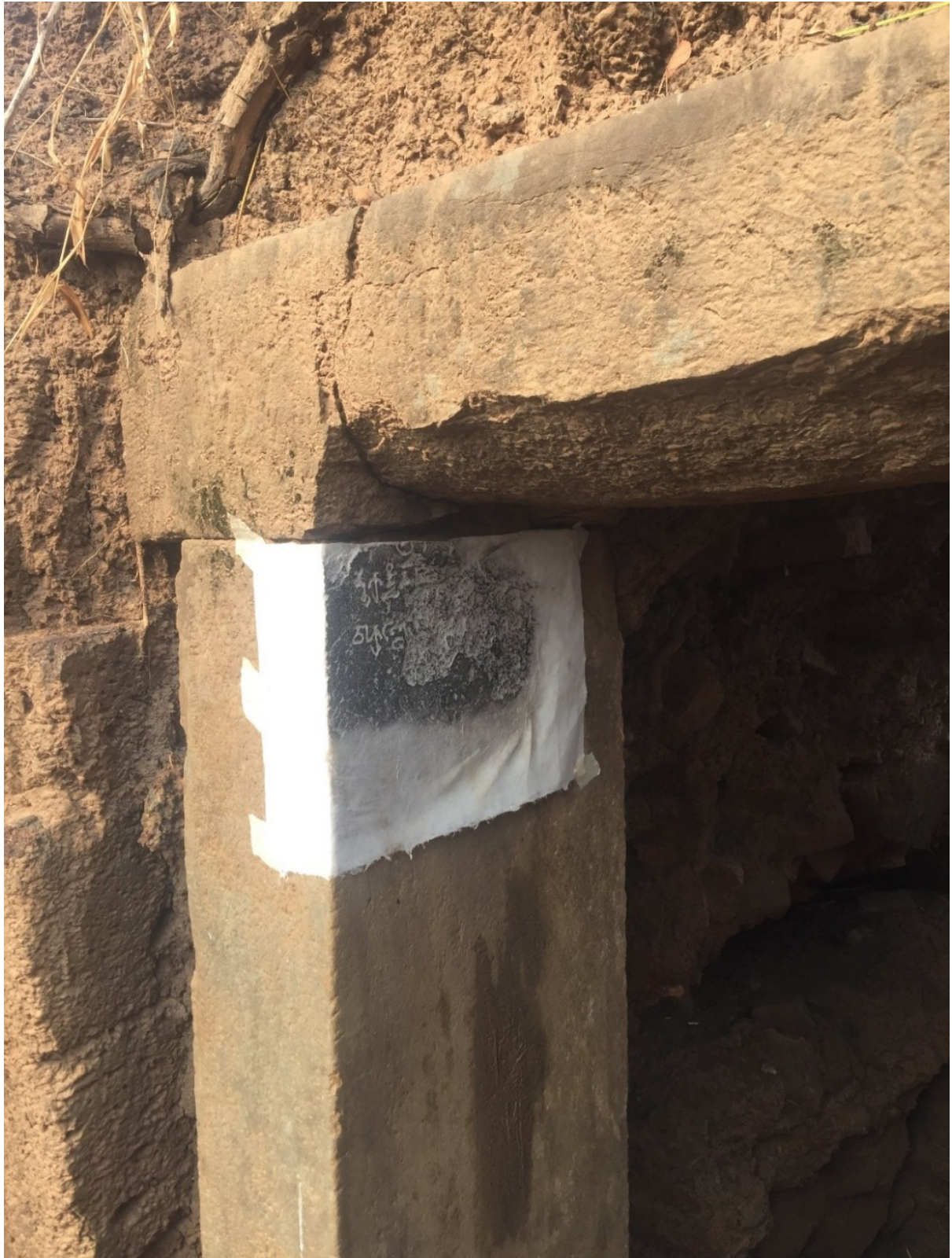
រូបលេខ៥៖ ការផ្ដិតសិលាចារឹកប្រាសាទសំរោង មេទ្វារខាងជើង (ផ្ដិតដោយ៖ កំ វណ្ណារ៉ា)