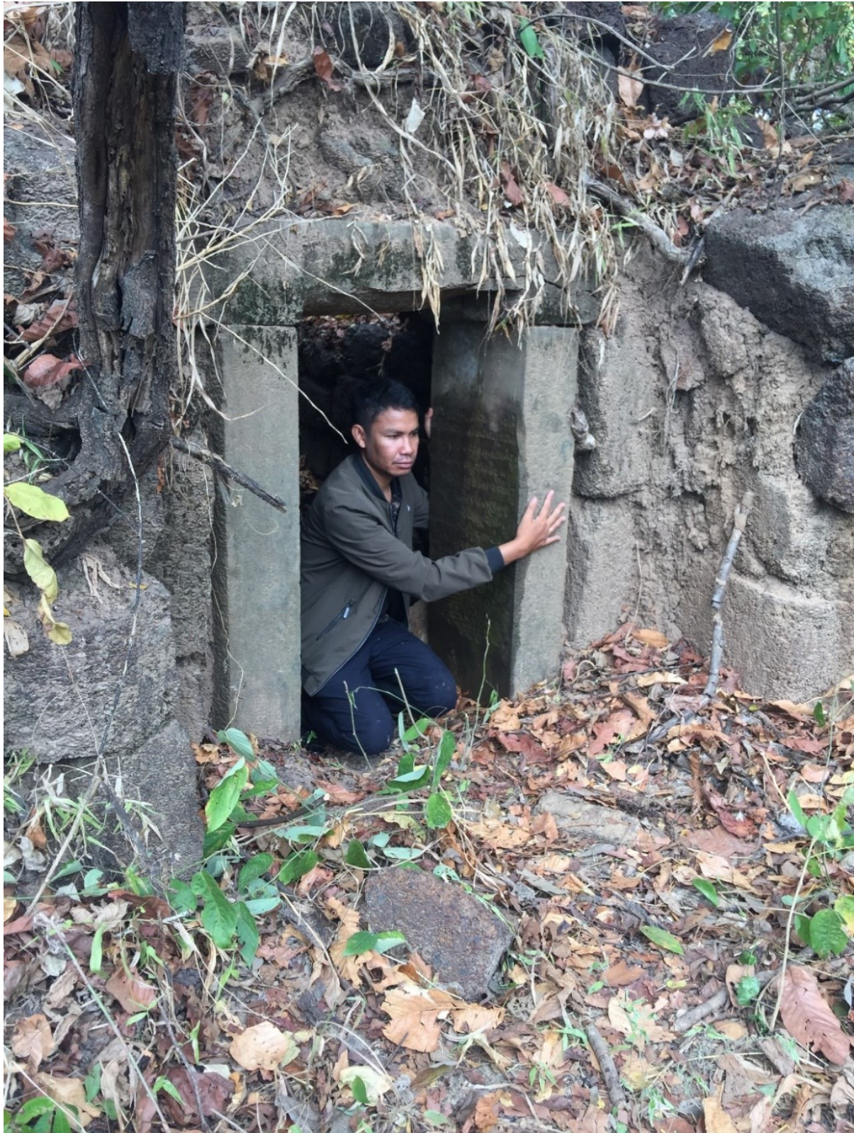
រូបលេខ៣៖ សកម្មភាពផ្តិតសិលាចារឹកប្រាសាទសំរោង ខេត្តព្រះវិហារ