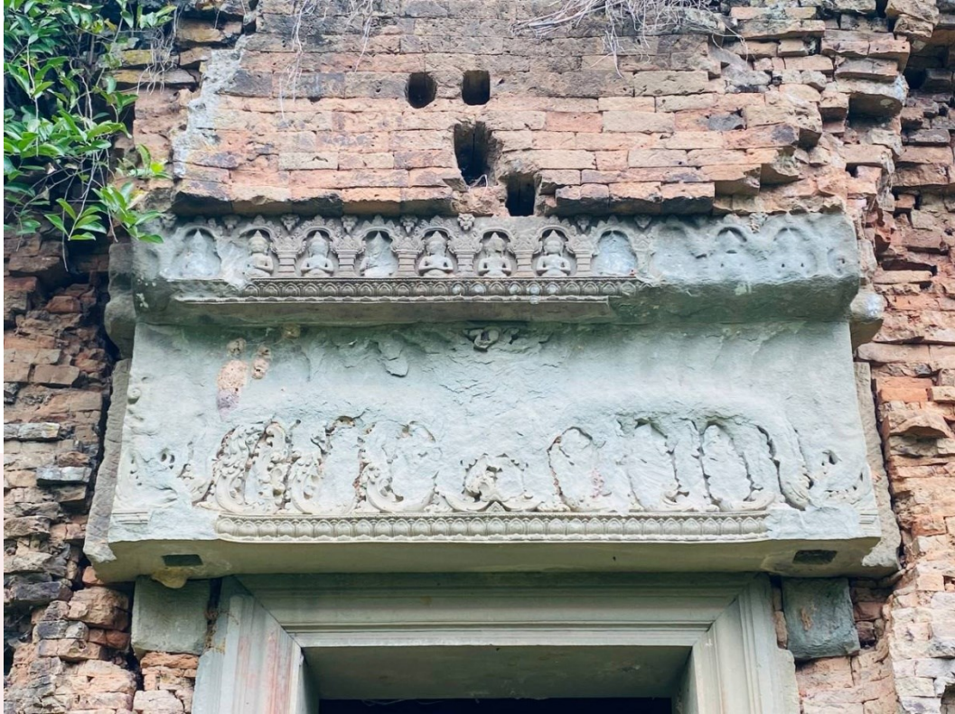
រូបលេខ៨៖ ផ្តែរទ្វារប្រាង្គកណ្តាលជួរខាងមុខ នៃប្រាសាទព្រះភ្នំ មើលពីមុខខាងកើត