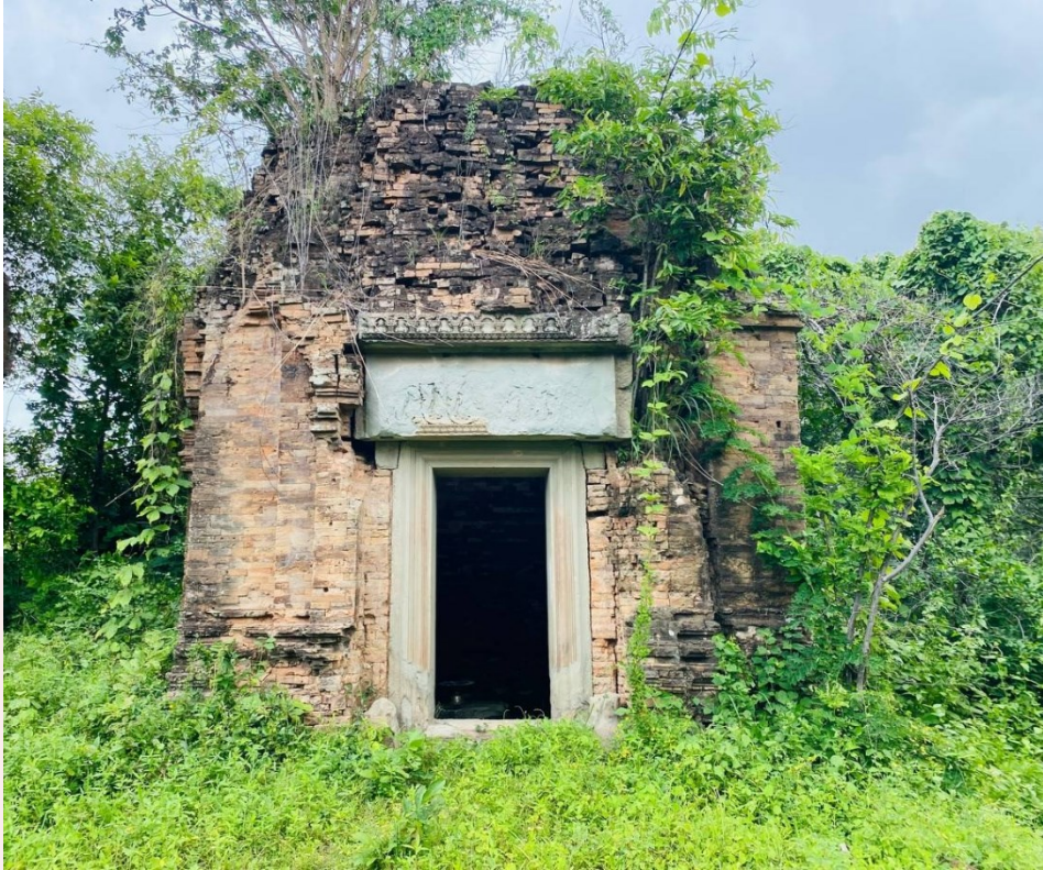
រូបលេខ៤៖ ប្រាង្គខាងជើងជួរខាងមុខ នៃប្រាសាទព្រះភ្នំ មើលពីមុខខាងកើត