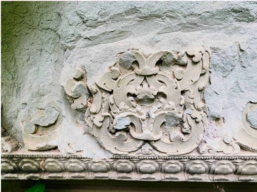
រូបលេខ៩៖ ចំណង់ក្បាច់ខ្យងហៀនពីរនៅលើផ្តែរទ្វារប្រាង្គខាងត្បូងជួរខាងក្រោយ នៃប្រាសាទព្រះភ្នំ