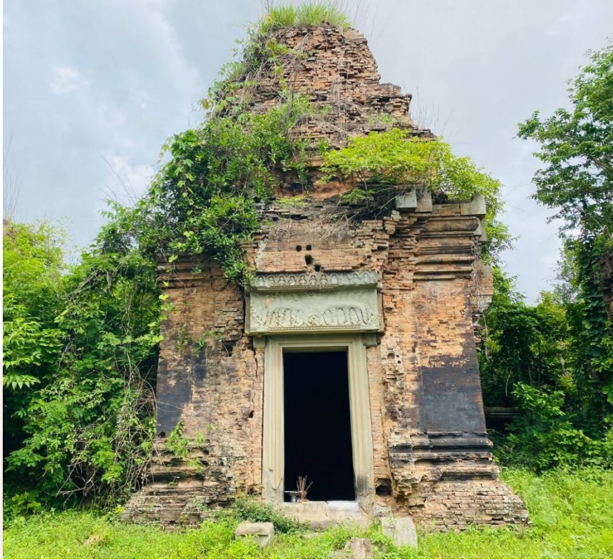
រូបលេខ២៖ ប្រាង្គកណ្តាលជួរខាងមុខ នៃប្រាសាទព្រះភ្នំ មើលពីមុខខាងកើត