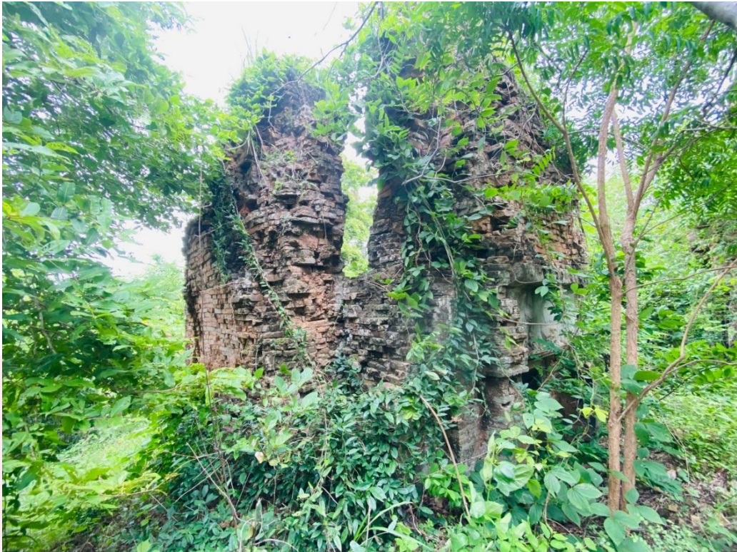
រូបលេខ៦៖ ប្រាង្គខាងត្បូងជួរខាងក្រោយ នៃប្រាសាទព្រះភ្នំ មើលពីមុខខាងអាគ្នេយ៍