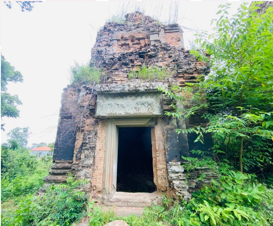
រូបលេខ៥៖ ប្រាង្គខាងត្បូងជួរខាងមុខ នៃប្រាសាទព្រះភ្នំ មើលពីមុខខាងកើត