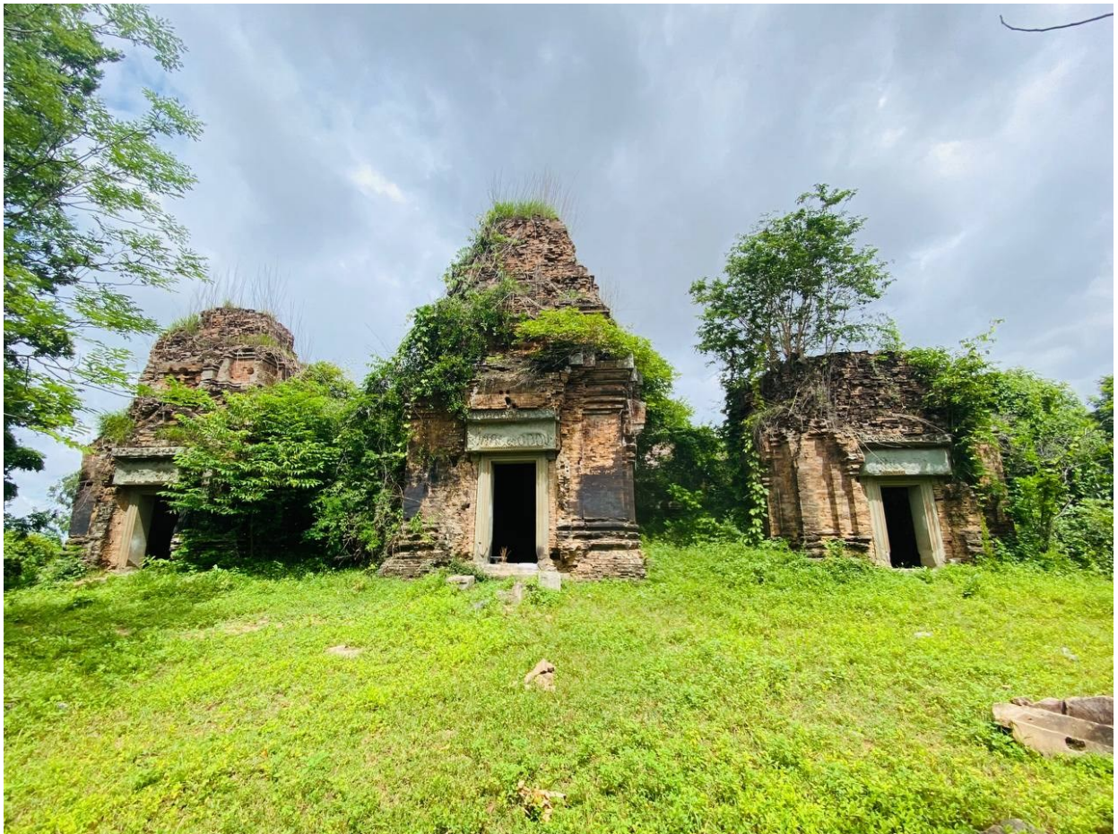
រូបលេខ១៖ ប្រាសាទព្រះភ្នំ មើលពីមុខខាងកើត

probably classified in the Koh Ker style and situated in a large city or town, originally named "Padmapura" or "Amoghapura", located along the ancient road from Angkor to Phimai. But, in the 12 th century (1101 CE), during the reign of Jayavarman VI (1080-1107 CE), it is likely that the highly officials built the statues of Nandin and Shiva. In addition, due to the inscriptions and the art historical evidence, it has argued that Prasat Preah Phnom is a Hindu temple dedicated to the Saiva sect (worship of Lord Shiva) and has an artistic-architectural style similar to some of the temples in the Lingapura city (Koh Ker), Preah Vihear province.