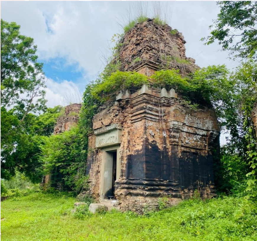
រូបលេខ៣៖ ប្រាង្គកណ្តាលជួរខាងមុខ នៃប្រាសាទព្រះភ្នំ មើលពីមុខខាងឦសាន