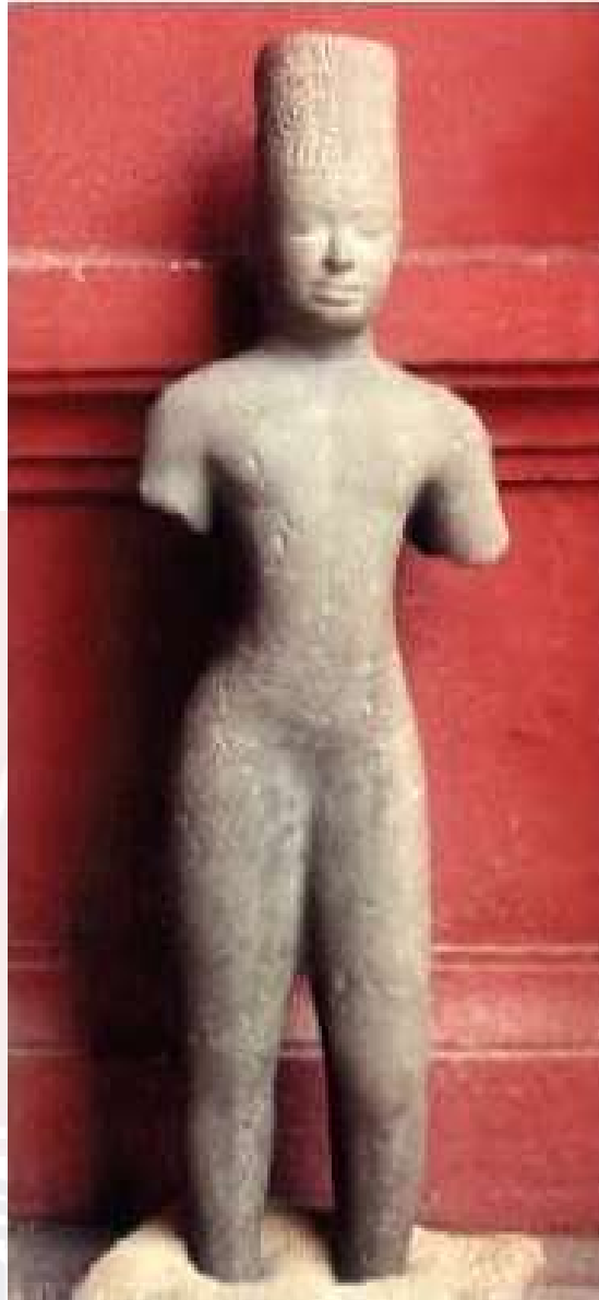
រូបលេខ៥៖ បដិមាព្រះហរិហរកម្រើញនៅប្រាសាទភូមិប្រាសាទ