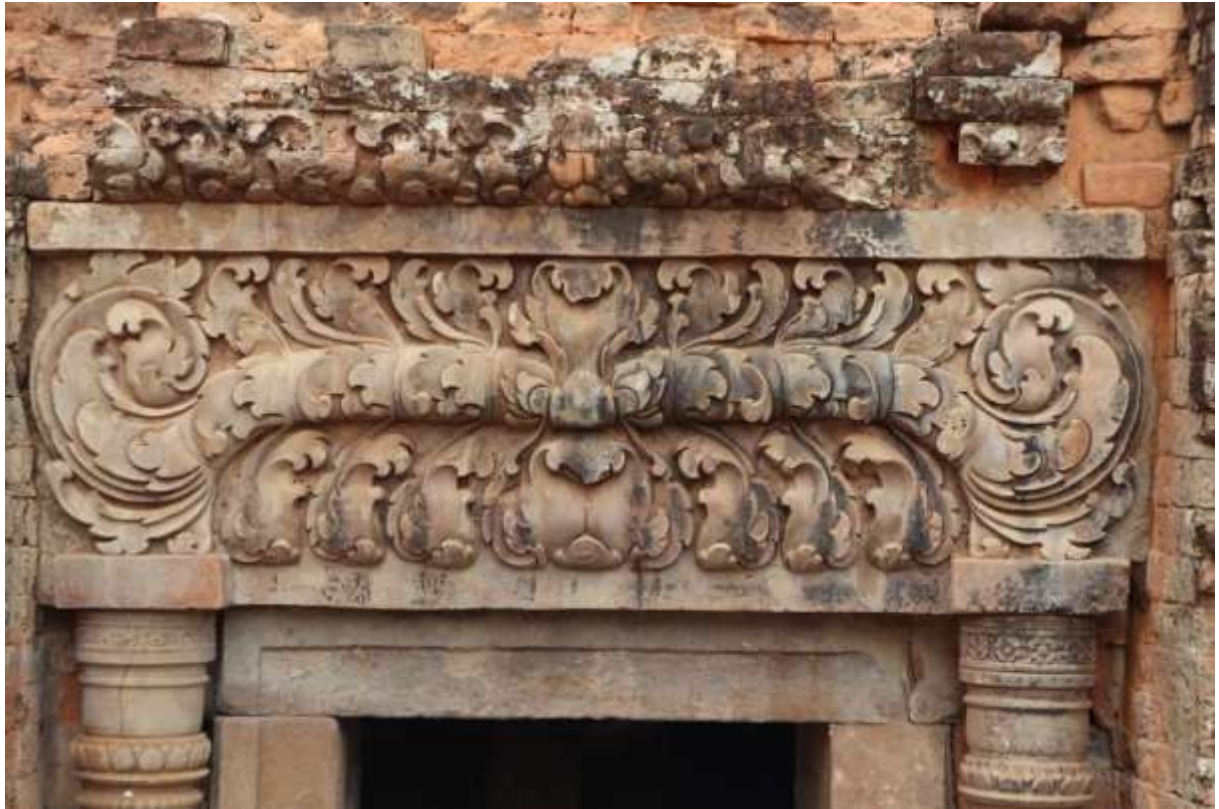
រូបលេខ២៖ ផ្តែរទ្វារប្រាសាទភូមិប្រាសាទ