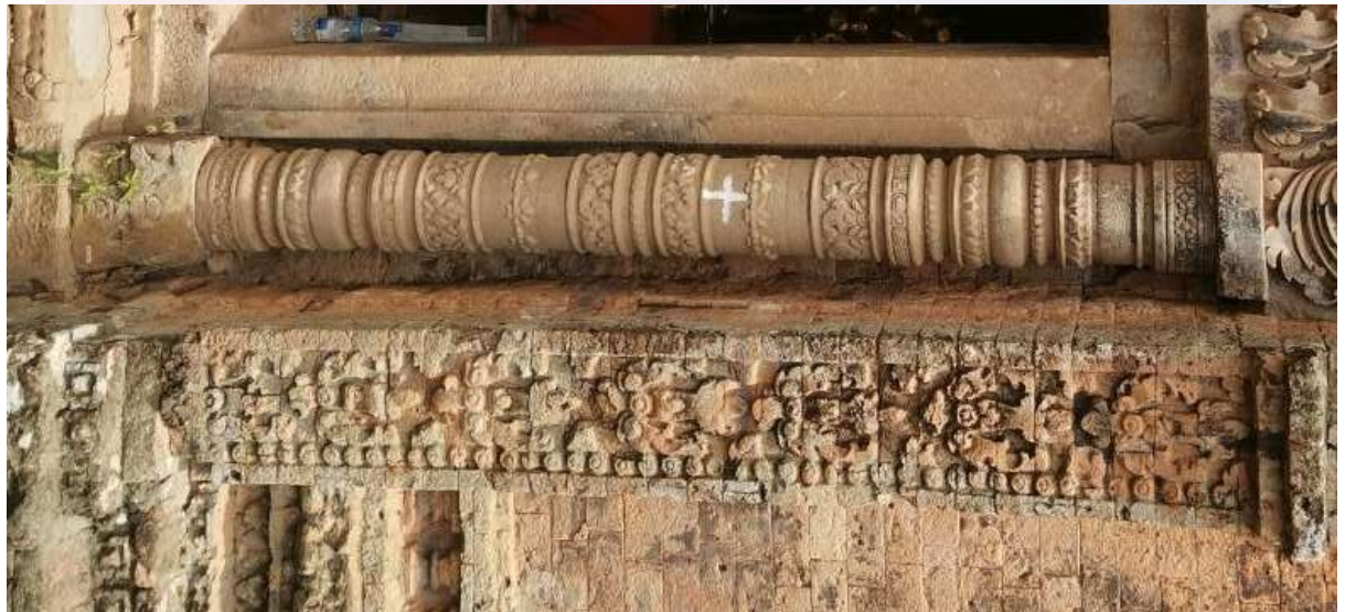
រូបលេខ២៖ សសរពេជ្រនិងសសរផ្តោបប្រាសាទភូមិប្រាសាទ