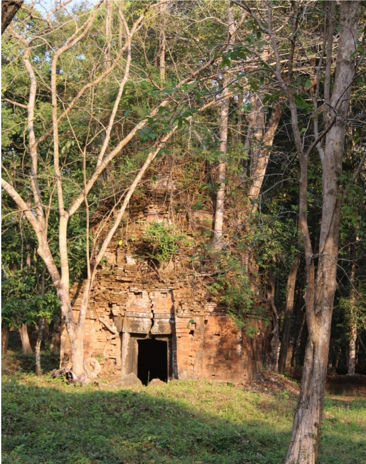
រូបលេខ២៖ ប្រាសាទខ្នារ ខេត្តព្រះវិហារ