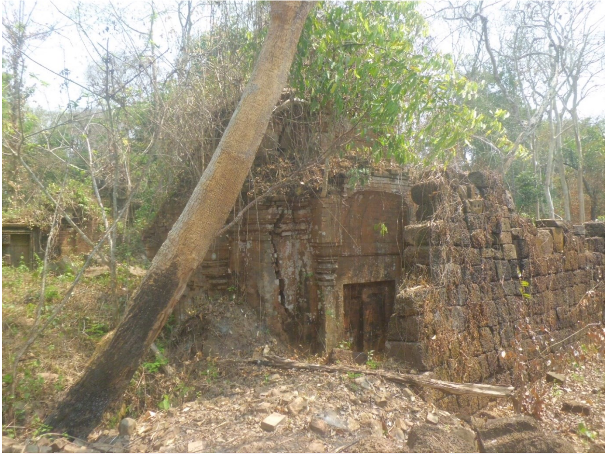
រូបលេខ១៖ ប្រាសាទខ្នារ ខេត្តព្រះវិហារ