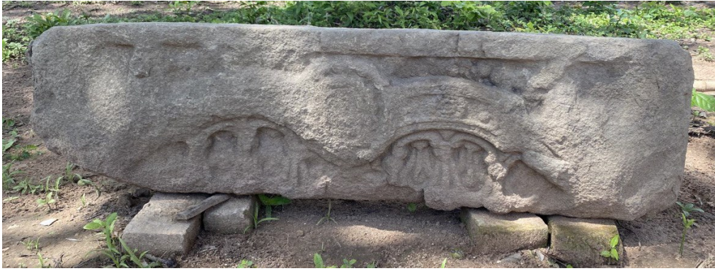
រូបលេខ៥៖ ផ្តែរទ្វាររចនាបថថាឡាបរិវាត់ រកឃើញនៅប្រាង្គ KT2