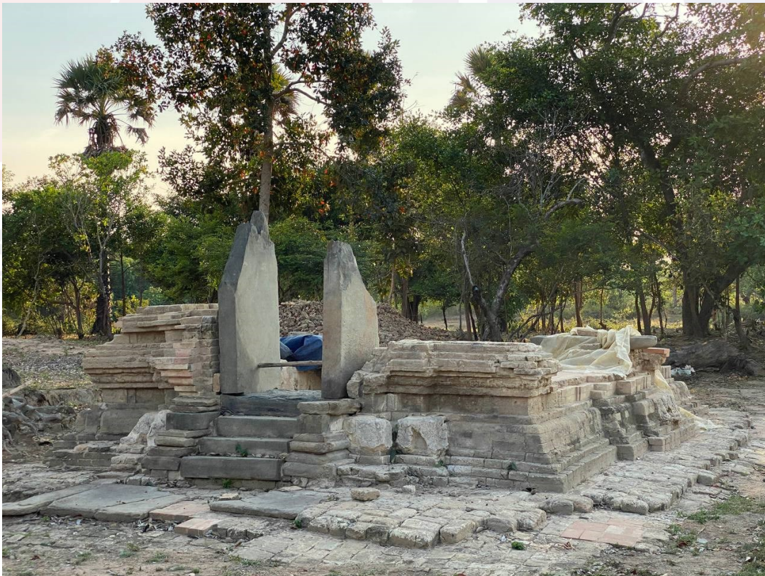
រូបលេខ២ ៖ ប្រាសាទមានរាងបួនជ្រុងទ្រវែង (KT2)