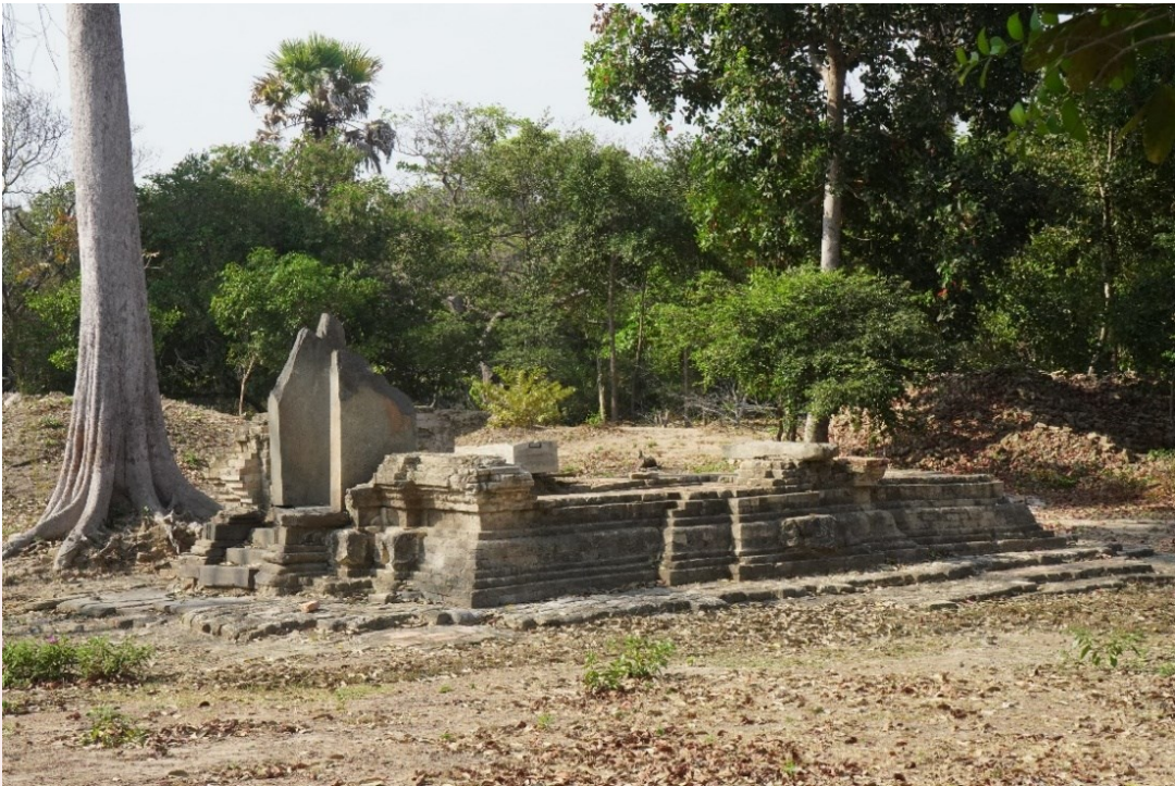
រូបលេខ១ ៖ ប្រាសាទមានរាងបួនជ្រុងទ្រវែង (KT2)