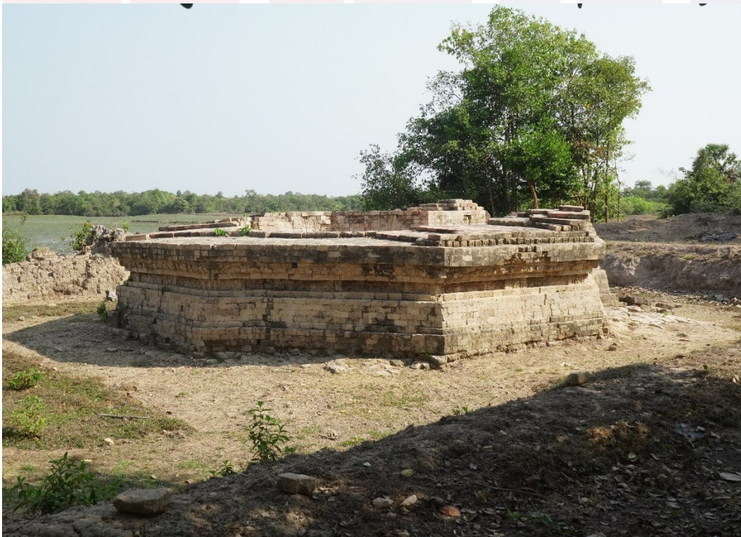
រូបលេខ៤៖ ប្រាសាទរាងប្រាំបីជ្រុង (KT1) ក្នុងក្រុមប្រាសាទខ្នាចទោល