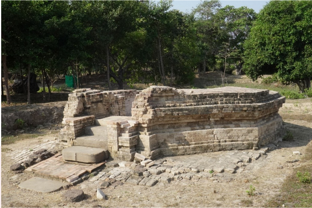
រូបលេខ៣៖ ប្រាសាទរាងប្រាំបីជ្រុង (KT1) ក្នុងក្រុមប្រាសាទខ្នាចទោល