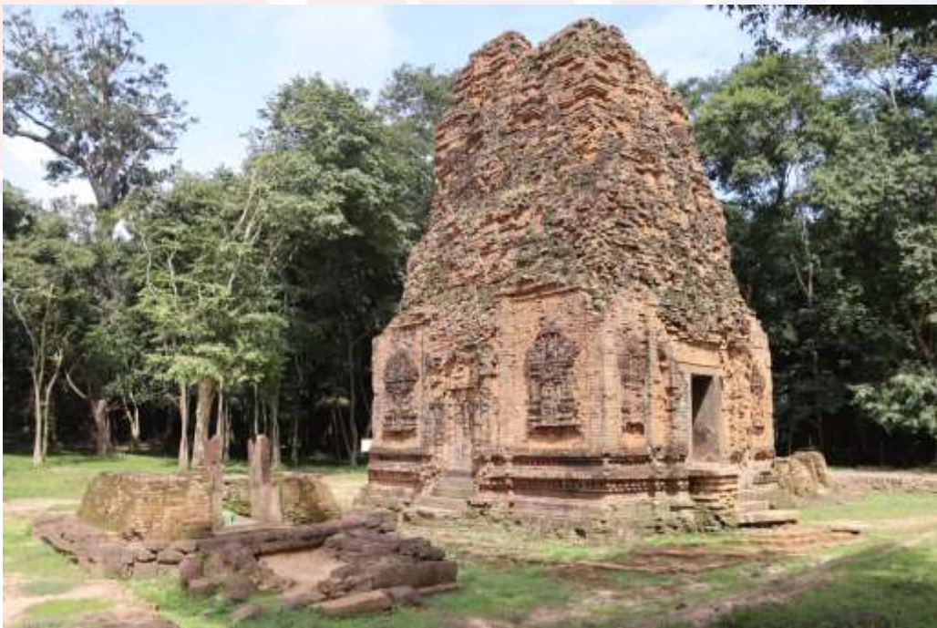
រូបលេខ២៖ ប្រាសាទដើមចន្ទី (មើលពីទិសអាគ្នេយ៍)