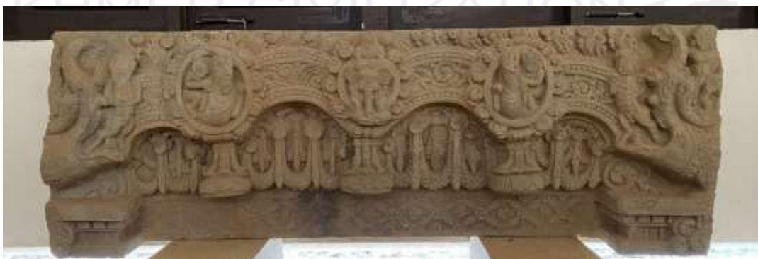
រូបលេខ១០៖ ផ្តែរទ្វារដែលគេកាត់តម្រឹមឱ្យខ្លីនៅស.វ.ទី១០ នៅតួប៉ម N4 (សាលពិពណ៌ សំបូរព្រៃគុក)