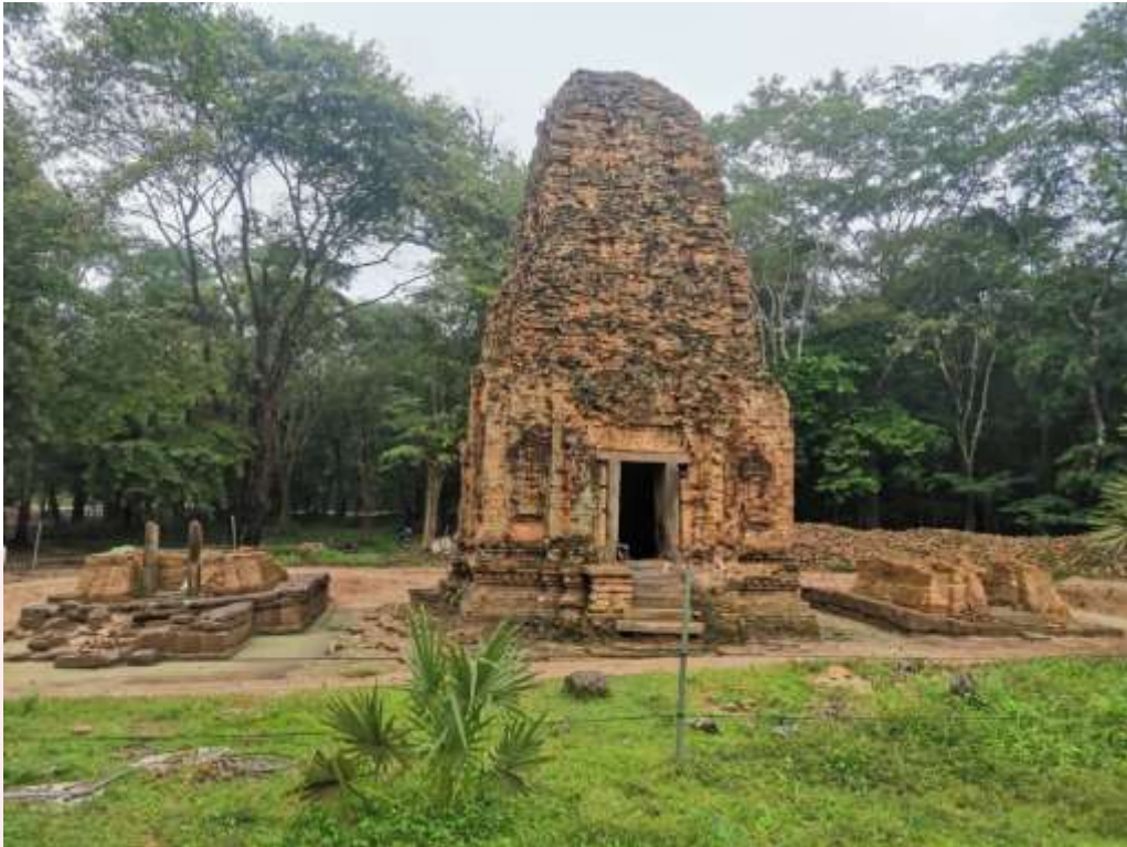
រូបលេខ១៖ ប្រាសាទដើមចន្ទី (មើលពីទិសខាងកើត)