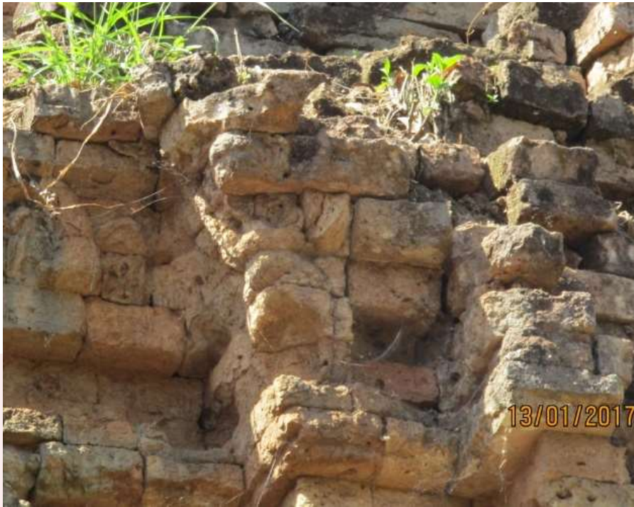
រូបលេខ៨៖ ចម្លាក់រូបគ្រុឌនៅជ្រុងអាគ្នេយ៍នៃប្រាសាទដើមចន្ទន៍