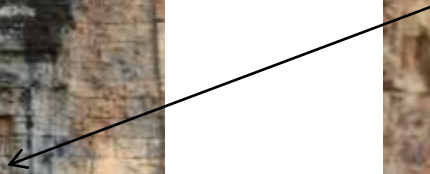
រូបលេខ៦៖ ចម្លាក់រូបជនបរទេសនៅលើប្រាសាទអណ្តែតនៃប្រាសាទដើមចន្ទន៍(មុខខាងត្បូងផ្នែកខាងកើត)