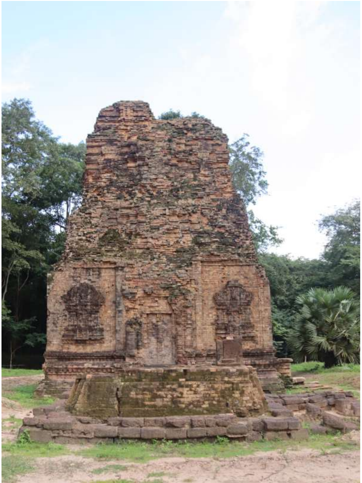
រូបលេខ៣៖ ប្រាសាទដើមចន្ទី (មើលពីទិសខាងត្បូង)