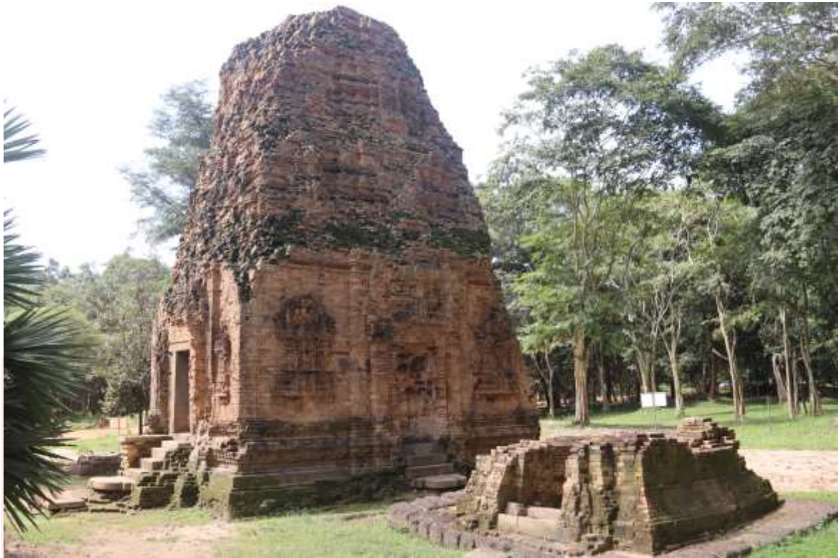
រូបលេខ២៖ ប្រាសាទដើមចន្ទន៍ (មើលពីទិសឦសាន)