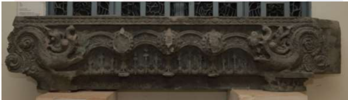
រូបលេខ៩៖ ផ្តែរទ្វារប្រាសាទដើមចន្ទន៍ (សារមន្ទីរខេត្តកំពង់ធំ)