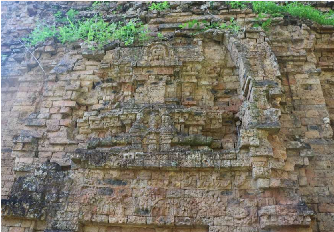
រូបលេខ៤៖ ហោជាងនិងផ្តែរទ្វារធ្វើអំពីឥដ្ឋនៃប្រាសាទដើមចន្ទន៍