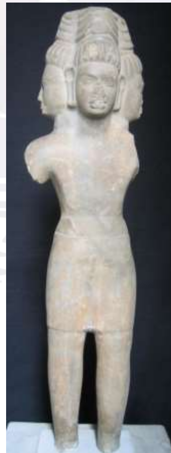
រូបលេខ៥៖ បដិមាព្រះព្រហ្មនៅប្រាសាទស្រង់ព្រះ