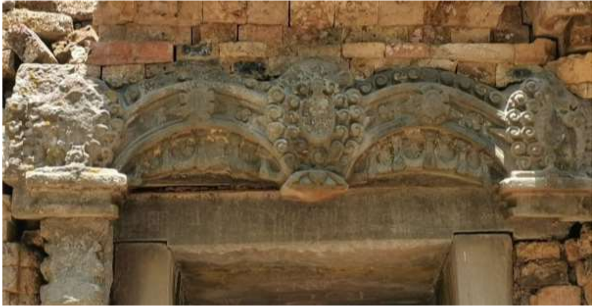
រូបលេខ៣៖ ផ្តែរទ្វារប្រាសាទស្រង់ព្រះ