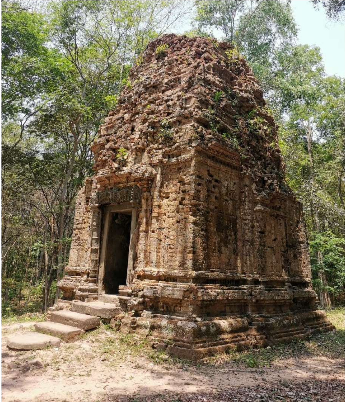
រូបលេខ២៖ ប្រាសាទស្រង់ព្រះ (ឧទ្ទិសដល់ព្រះព្រហ្ម) នៅតំបន់សំបូរព្រៃគុក មុខខាងឦសាន