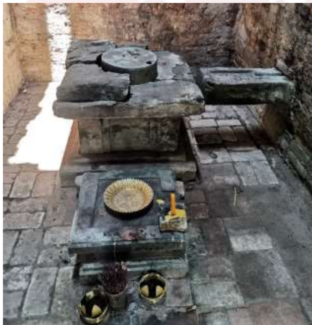
រូបលេខ៤៖ ជើងទម្រប្រាសាទស្រង់ព្រះ