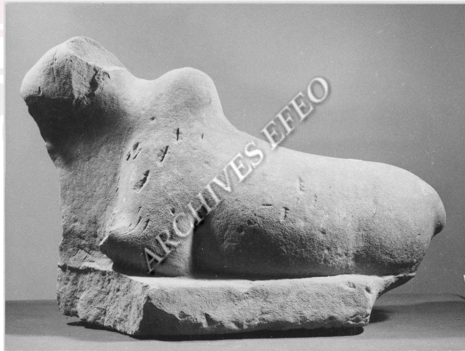
រូបលេខ៦៖ បដិមាគោនន្ទិរកឃើញនៅប្រាសាទបាក់រូង