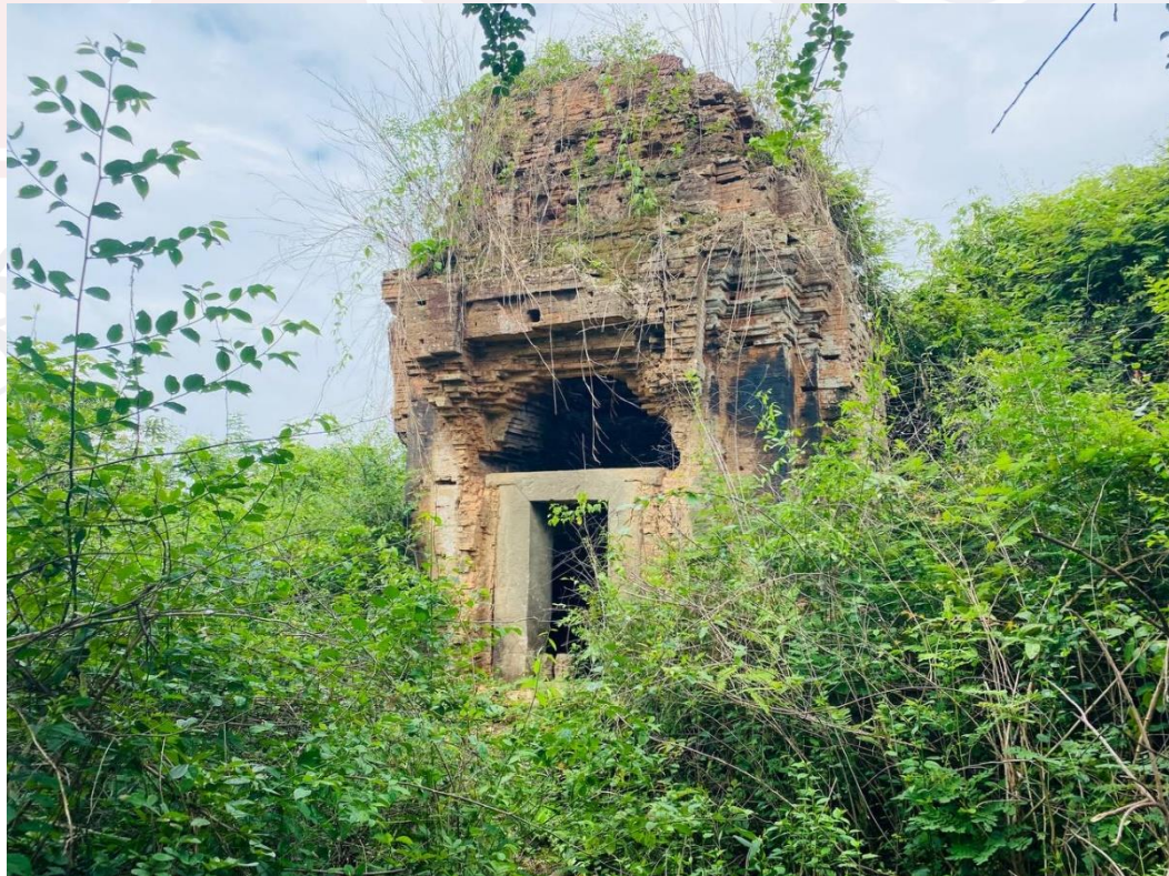
រូបលេខ២៖ ប្រាសាទបាក់រូង ស្រុកជីក្រែង ខេត្តសៀមរាប (មើលចំពីមុខខាងកើត)