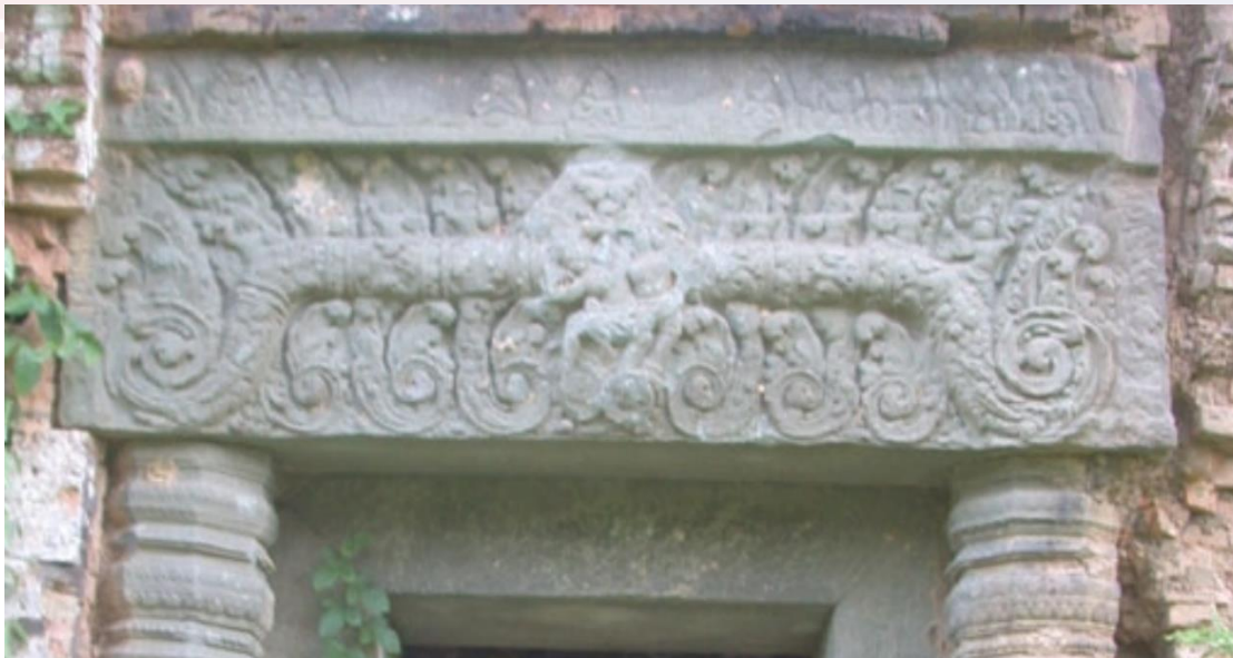
រូបលេខ៤៖ ផ្តែរទ្វារប្រាសាទបាក់រូង ខេត្តសៀមរាប