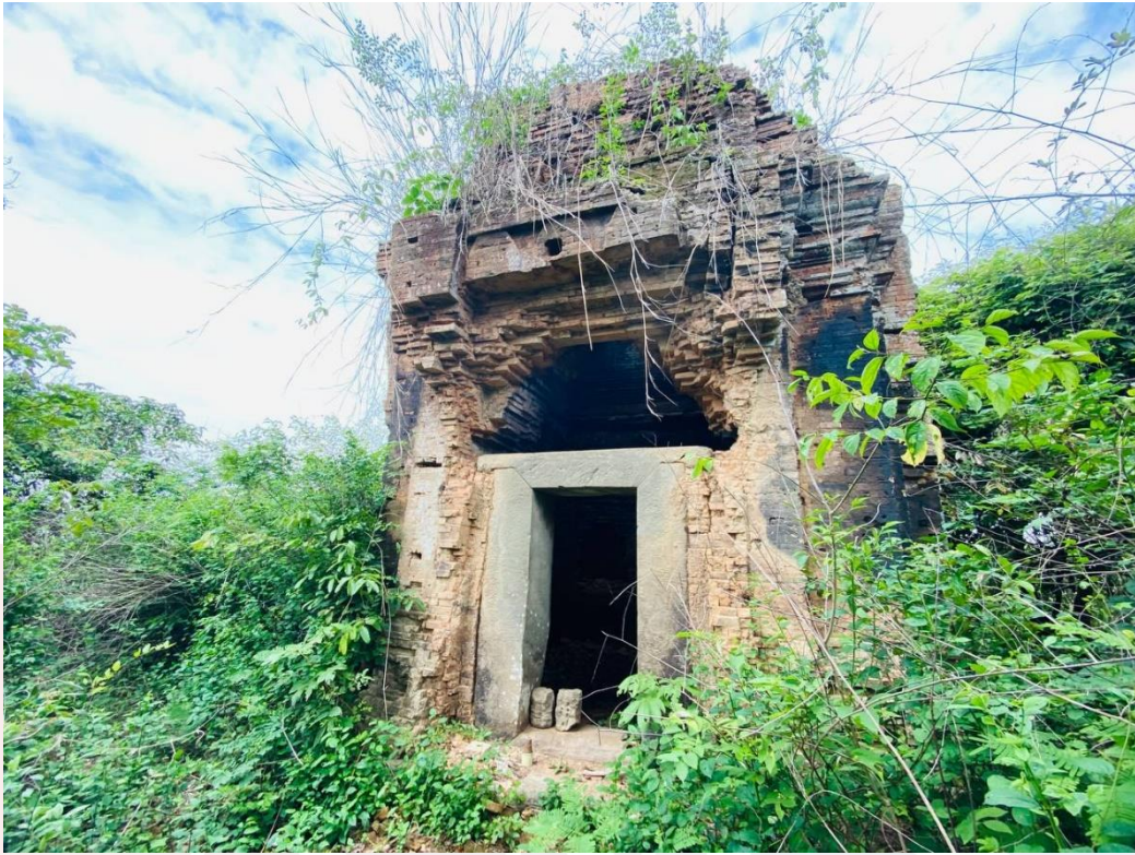
រូបលេខ១៖ ប្រាសាទបាក់រូង ស្រុកជីក្រែង ខេត្តសៀមរាប (មើលចំពីមុខខាងកើត)