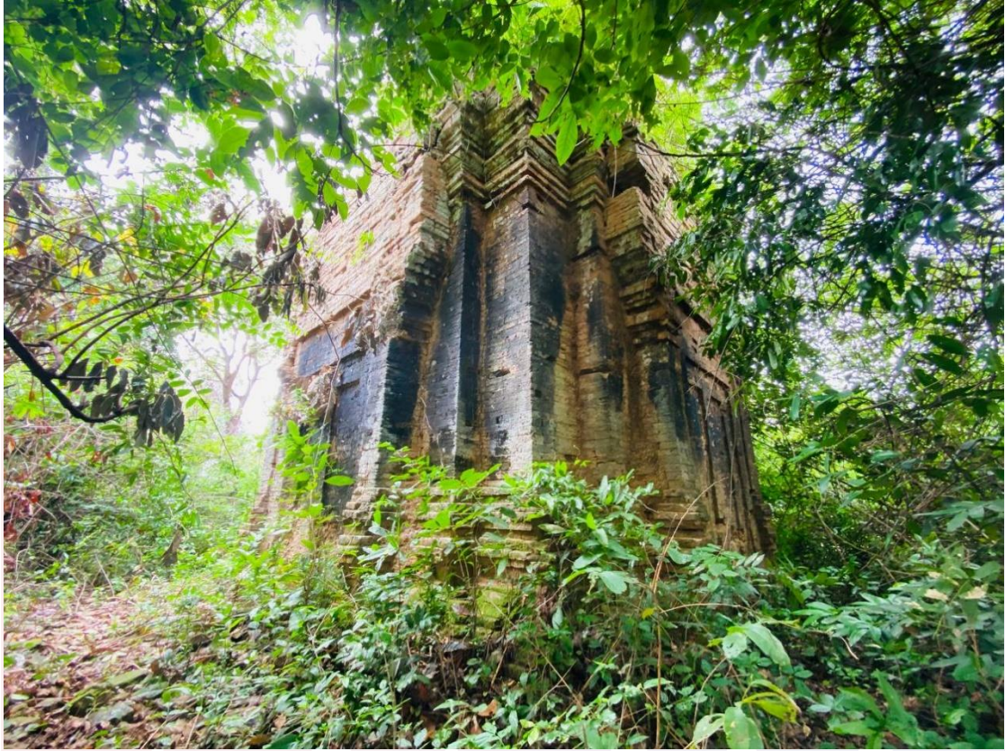
រូបលេខ៣៖ ប្រាសាទបាក់រូង ស្រុកជីក្រែង ខេត្តសៀមរាប (មើលចំពីមុខពាយព្យ)