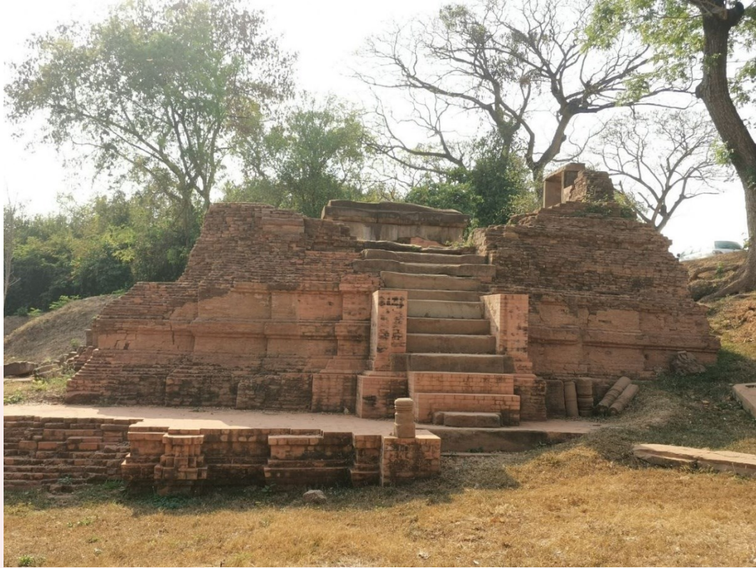
រូបលេខ២៖ ប្រាសាទអកយំ