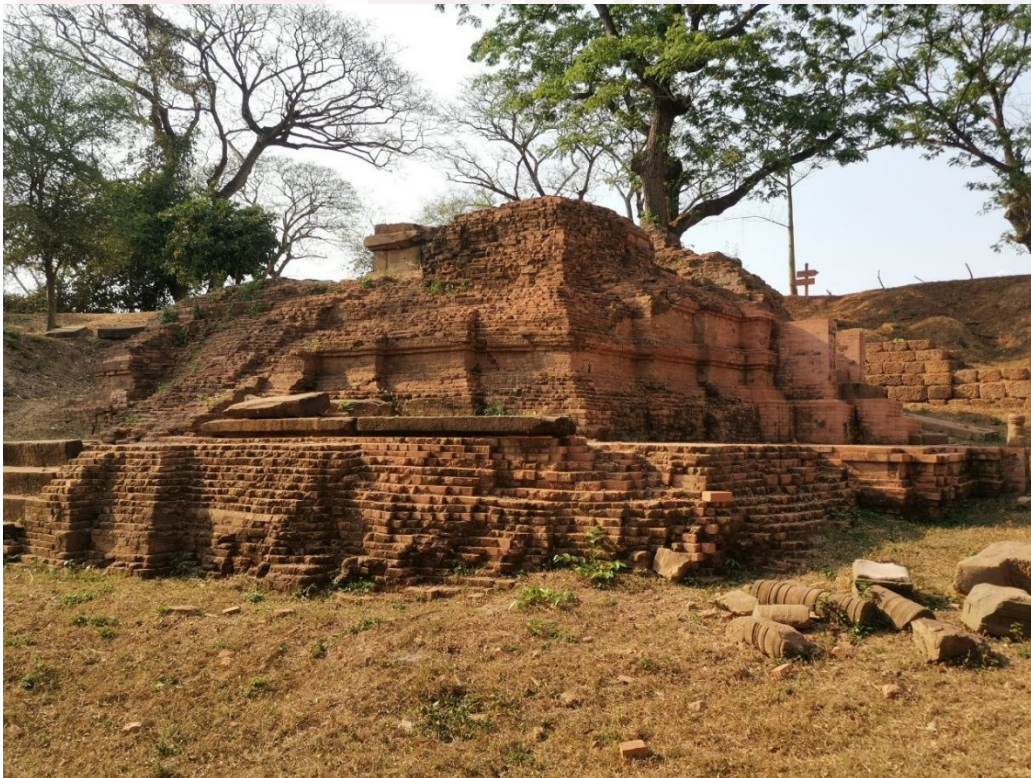
រូបលេខ១៖ ប្រាសាទអកយំ

Coedès, G. 1937-1966. Inscription du Camdodge , 8 Volumes, Hanoi.