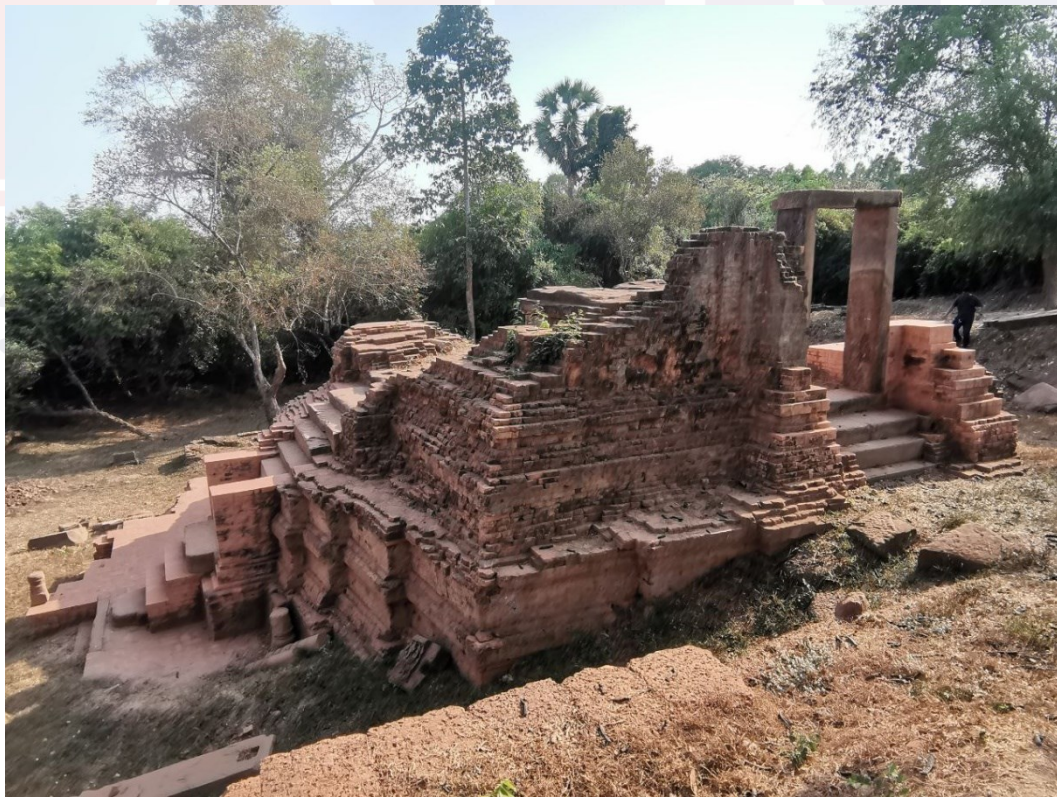
រូបលេខ៣៖ ប្រាសាទអកយំ