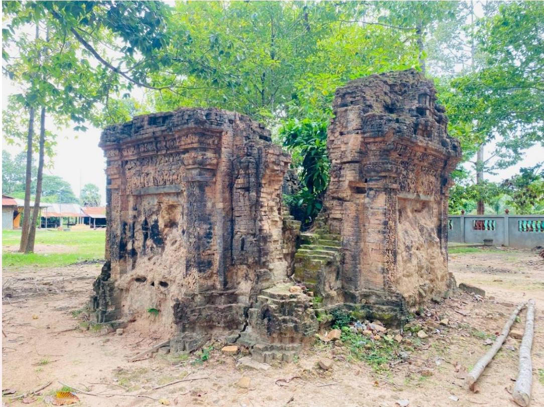
រូបលេខ២៖ ប្រាសាទត្រពាំងរុន (មើលពីមុខនិរតី)