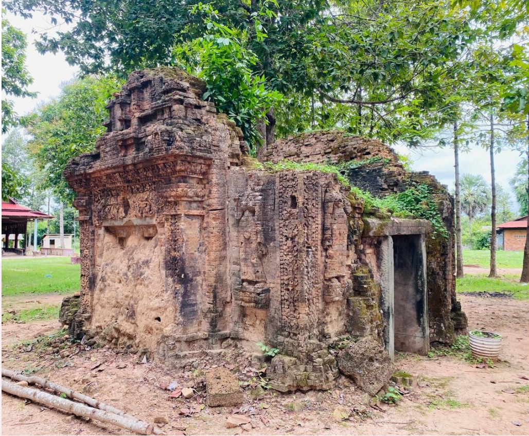
រូបលេខ២៖ ប្រាសាទត្រពាំងរុន (មើលពីមុខអាគ្នេយ៍)