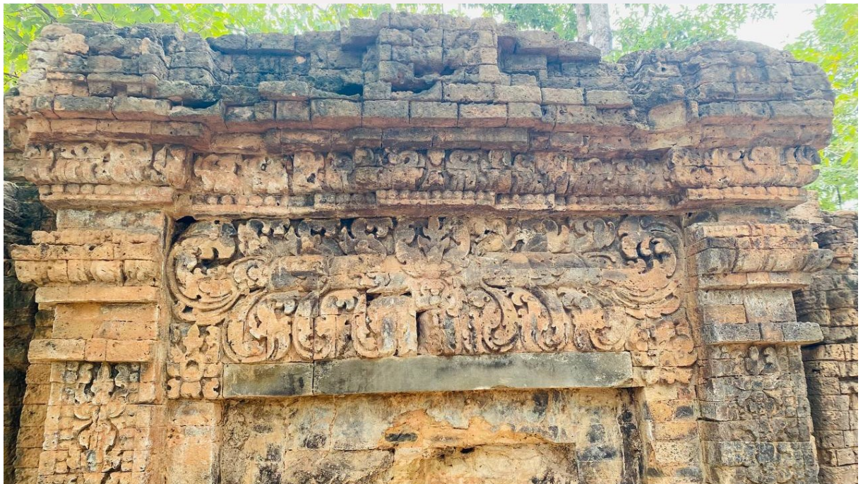
រូបលេខ៧៖ ផ្តែរលម្អទ្វារបញ្ឆោតខាងជើងប្រាសាទត្រពាំងរុន