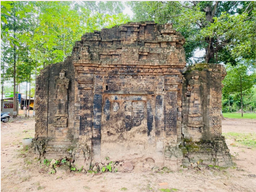
រូបលេខ៣៖ ប្រាសាទត្រពាំងរុន (មើលពីមុខខាងលិច)