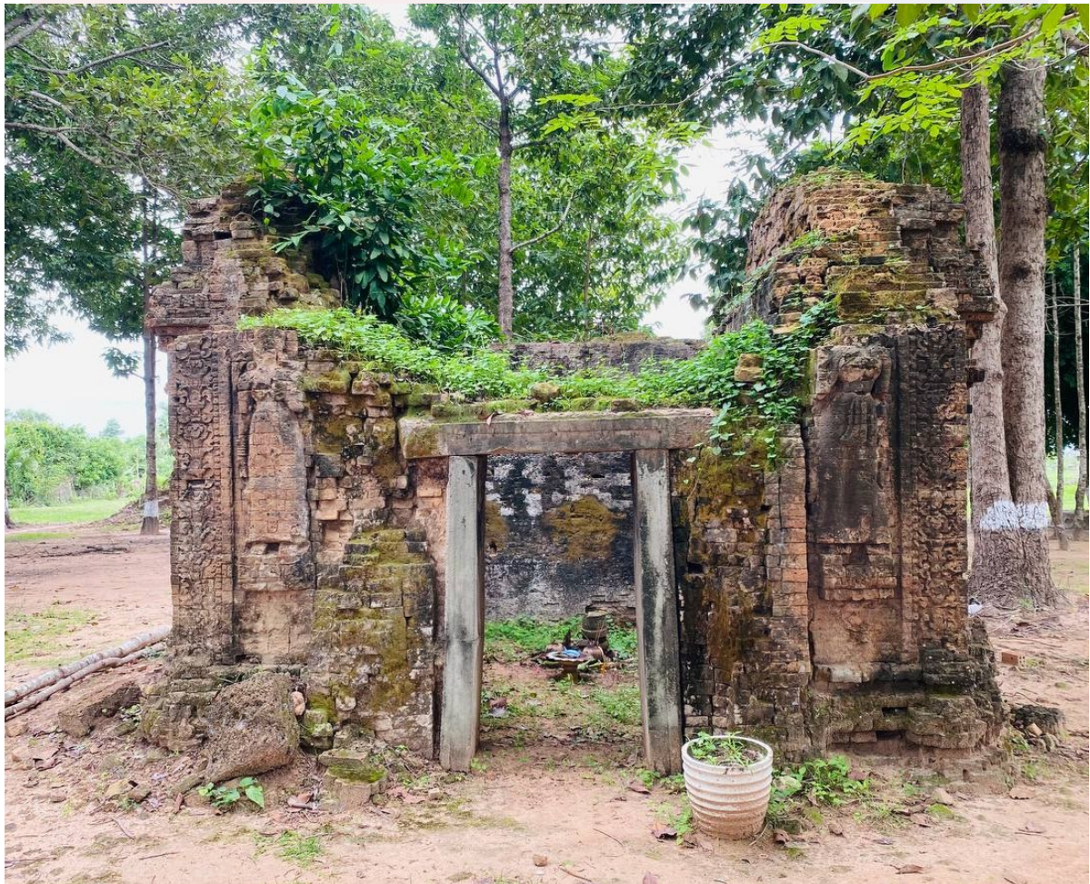
រូបលេខ១៖ ប្រាសាទត្រពាំងរុន (មើលពីមុខខាងកើត)

Prasat Trapeang Run is situated along the ancient road from Angkor to Kampong Kdei, in Chi Krenng District, Siem Reap province. The temple group consists of two sanctuaries, one of them is a brick monument, rectangular, facing to the east. This temple was possibly built in the early of the eighth century CE in the reign of King Jayadevi and it is probably classified in the Pre Kampong Preah style. Due to this temple not having information from the inscriptions, it has faced difficulties to recognize the art historical and the role of the temple in religion. However, according to the reliefs on the decoration and the layout of the temple, it has been concluded that Prasat Trapeang Run is possibly dedicated to the Hinduism of the Saiva sect (the Shiva worshipping) and it probably has been housed the Harihara statue in the ancient time.