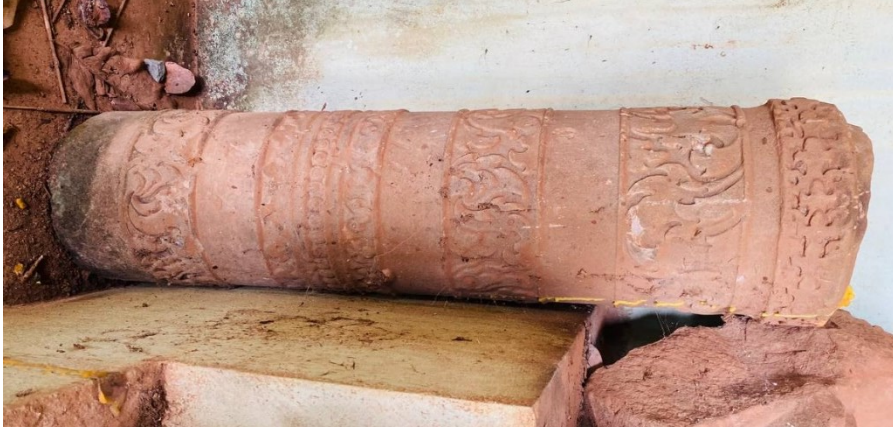
រូបលេខ៨៖ បំណែកសសរពេជ្រប្រាសាទត្រពាំងរុន (សព្វថ្ងៃដាក់នៅក្នុងខ្នងអ្នកតា)