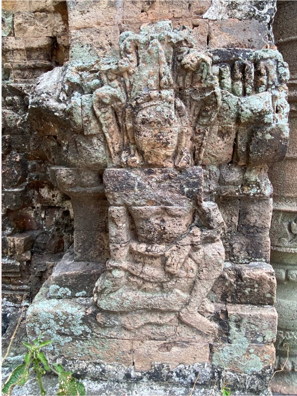
រូបលេខ១១១៖ ចម្លាក់នាគរាជភេទប្រុសលម្អនៅលើគល់សសរដ្ឋាបប្រាសាទកំពង់ព្រះ