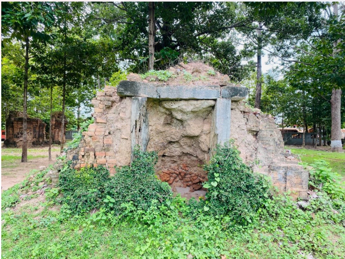
រូបលេខ៣៖ ប្រាង្គបាក់បែកមួយនៅប្រាសាទត្រពាំងរុន (ស្ថិតនៅទិសនិរតីប្រាង្គសំខាន់)