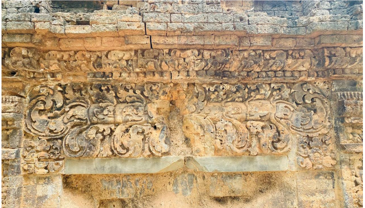
រូបលេខ៦៖ ផ្តែរលម្អទ្វារបញ្ឆោតខាងត្បូងប្រាសាទត្រពាំងរុន