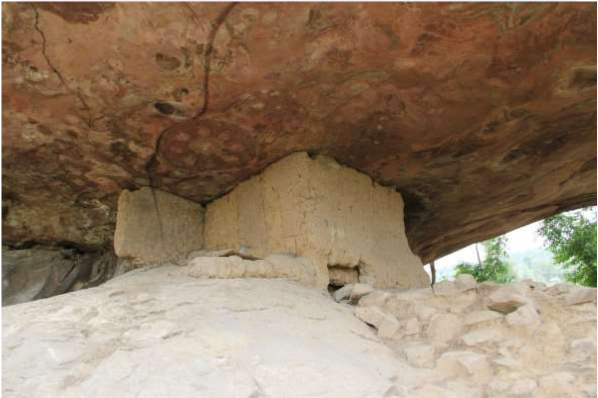
អត្ថបទដោយ៖ លីម វណ្ណច័ន្ទ