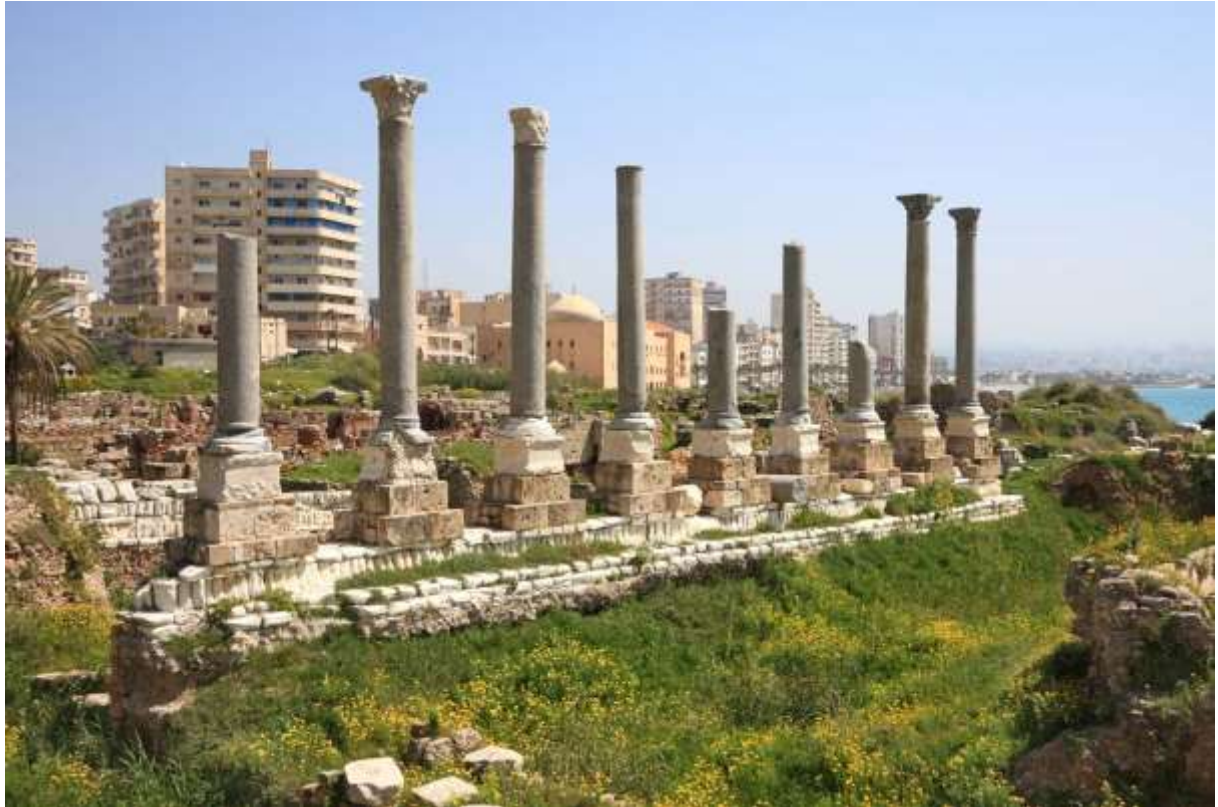
រូបលេខ២ ៣ ៖ ទីក្រុង Tyre និងទីក្រុង Sidon