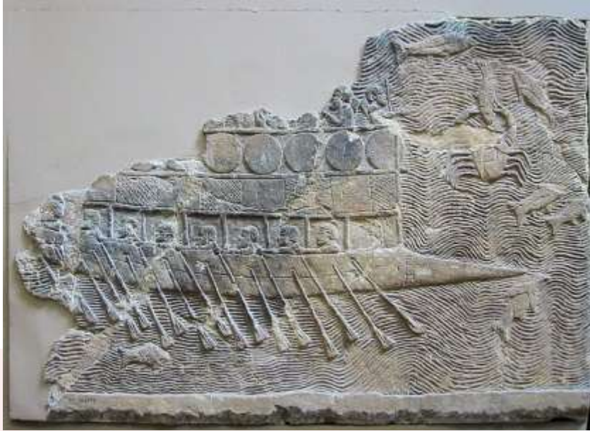
រូបលេខ៦ ៧ ៖ ចម្លាក់បង្ហាញពីផ្លូវទឹក និងការប្រើប្រាស់ទូកក្នុងអរិយធម៌ផ្លូវស្យា , រូបចម្លាក់សិល្បៈ ក្នុងអរិយធម៌នេះ