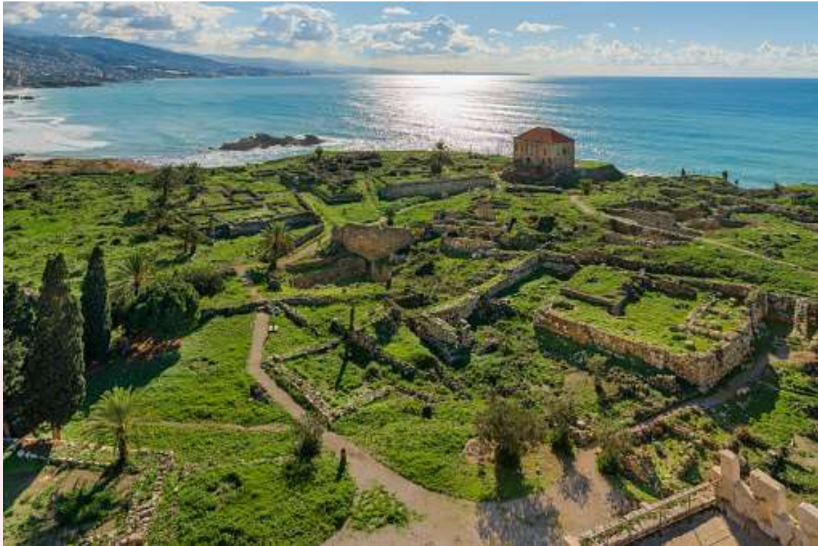
រូបលេខ៤ ៥ ៖ ទីក្រុងបុរាណ Byblos និង Baalbek