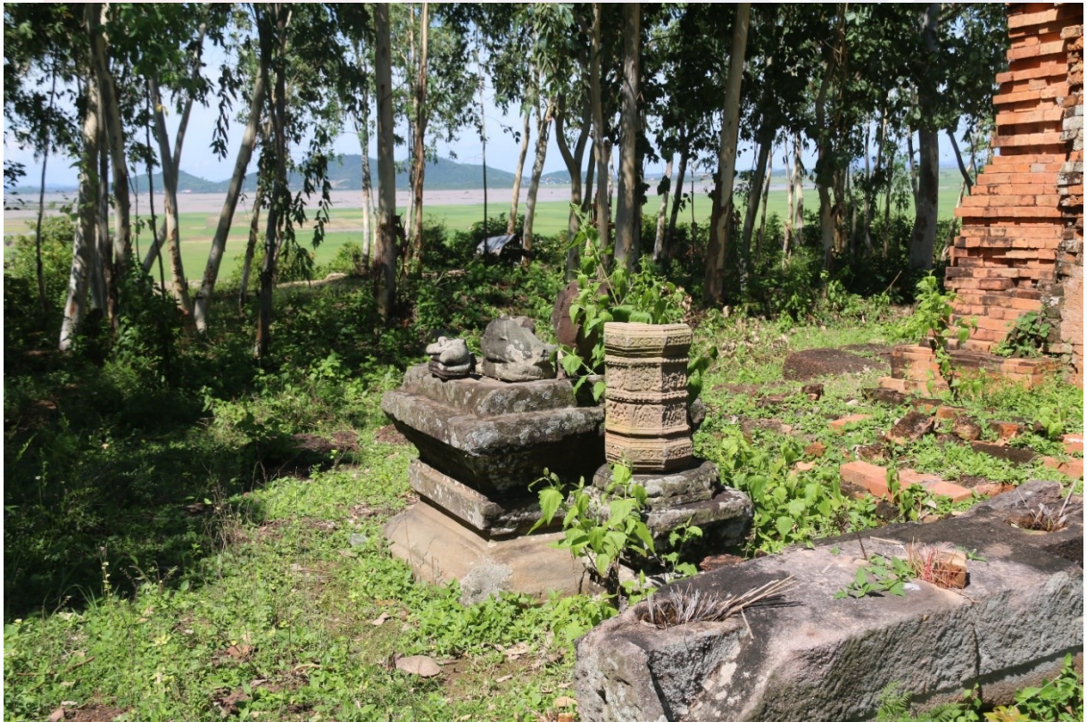
រូបលេខ២៖ វត្តសិល្បៈមួយចំនួននៅប្រាសាទភ្នំត្រប់