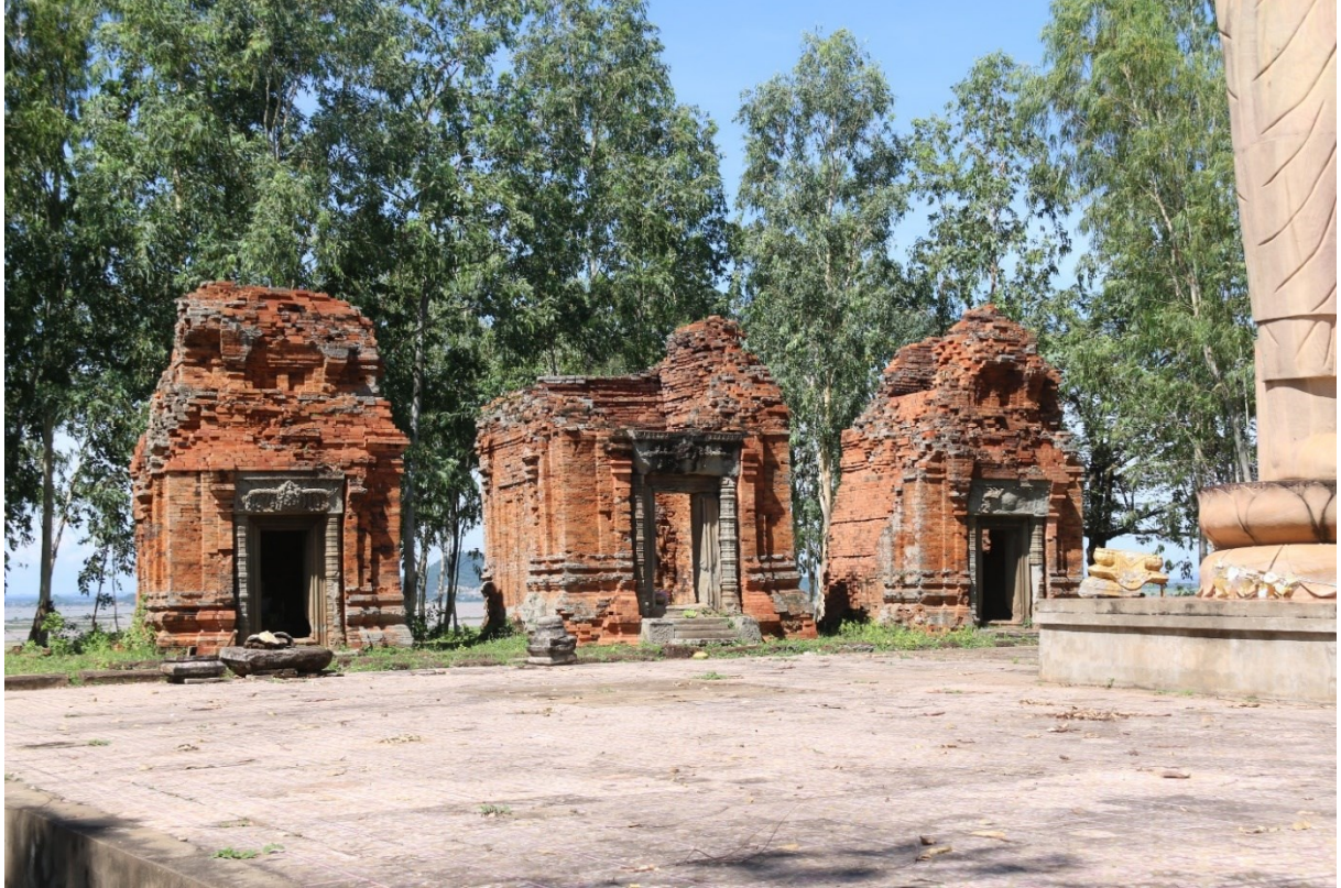
រូបលេខ១៖ ប្រាសាទភ្នំត្រប់ ស្រុកបាធាយ ខេត្តកំពង់ចាម (មើលពីមុខខាងកើត)