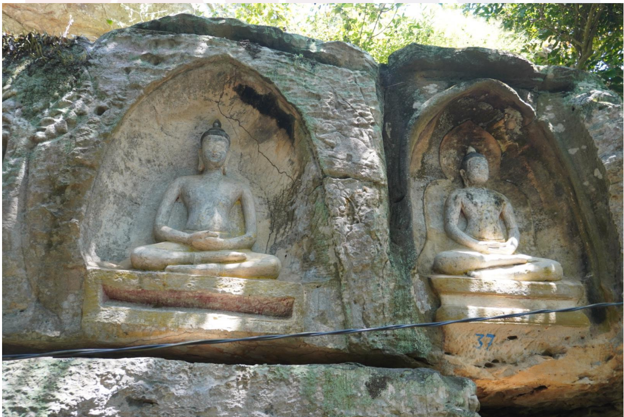
រូបលេខ៦៖ ព្រះពុទ្ធរូបតូចៗធ្លាក់នៅជញ្ជាំងភ្នំ