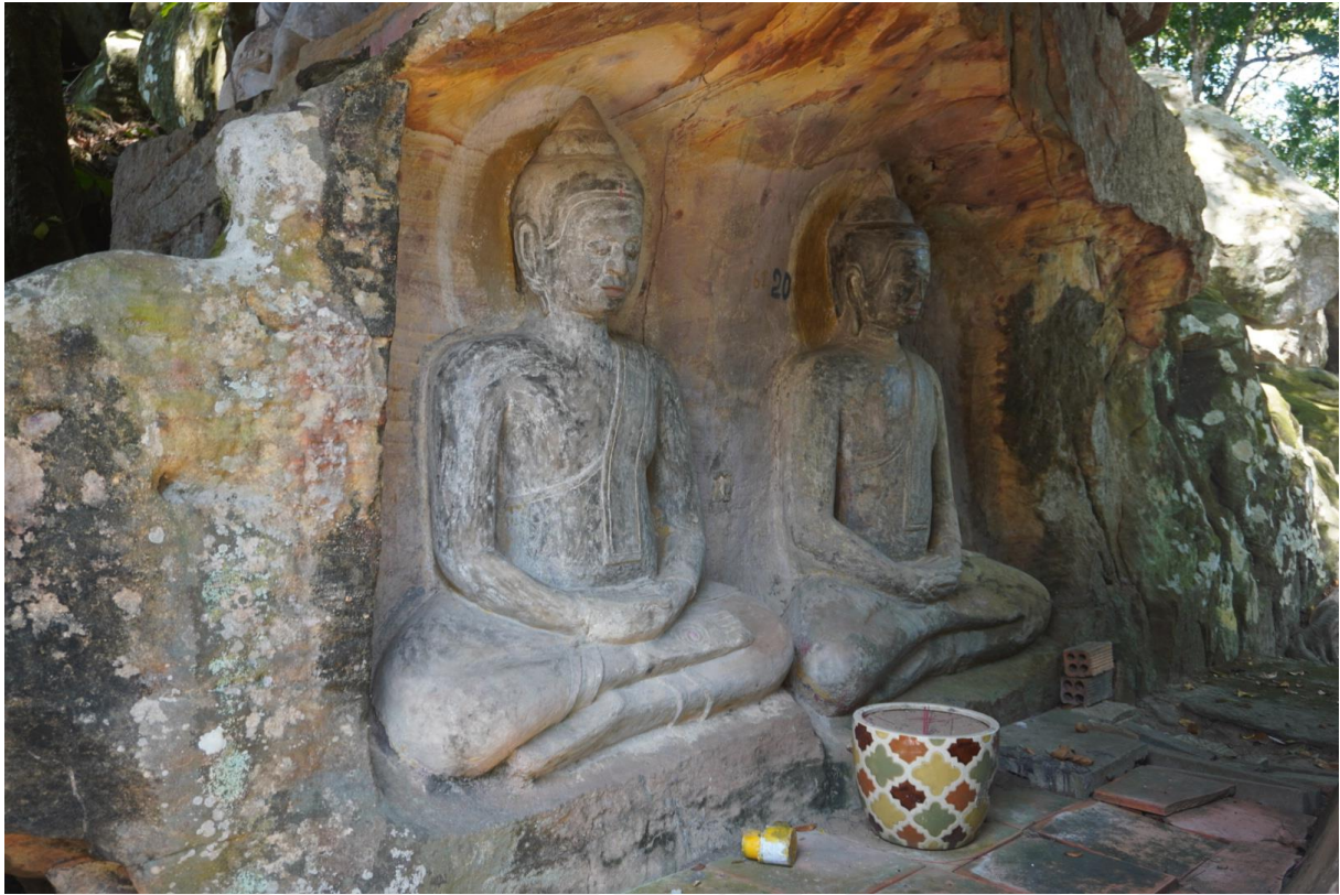
រូបលេខ៧៖ ព្រះពុទ្ធរូបតូចៗធ្លាក់នៅជញ្ជាំងភ្នំ