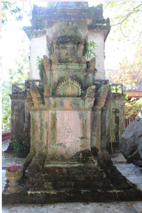
រូបលេខ៨៖ ចេតិយស.វ.ទី២០ សង់យកលំនាំចាស់នៅស.វ.ទី១៦