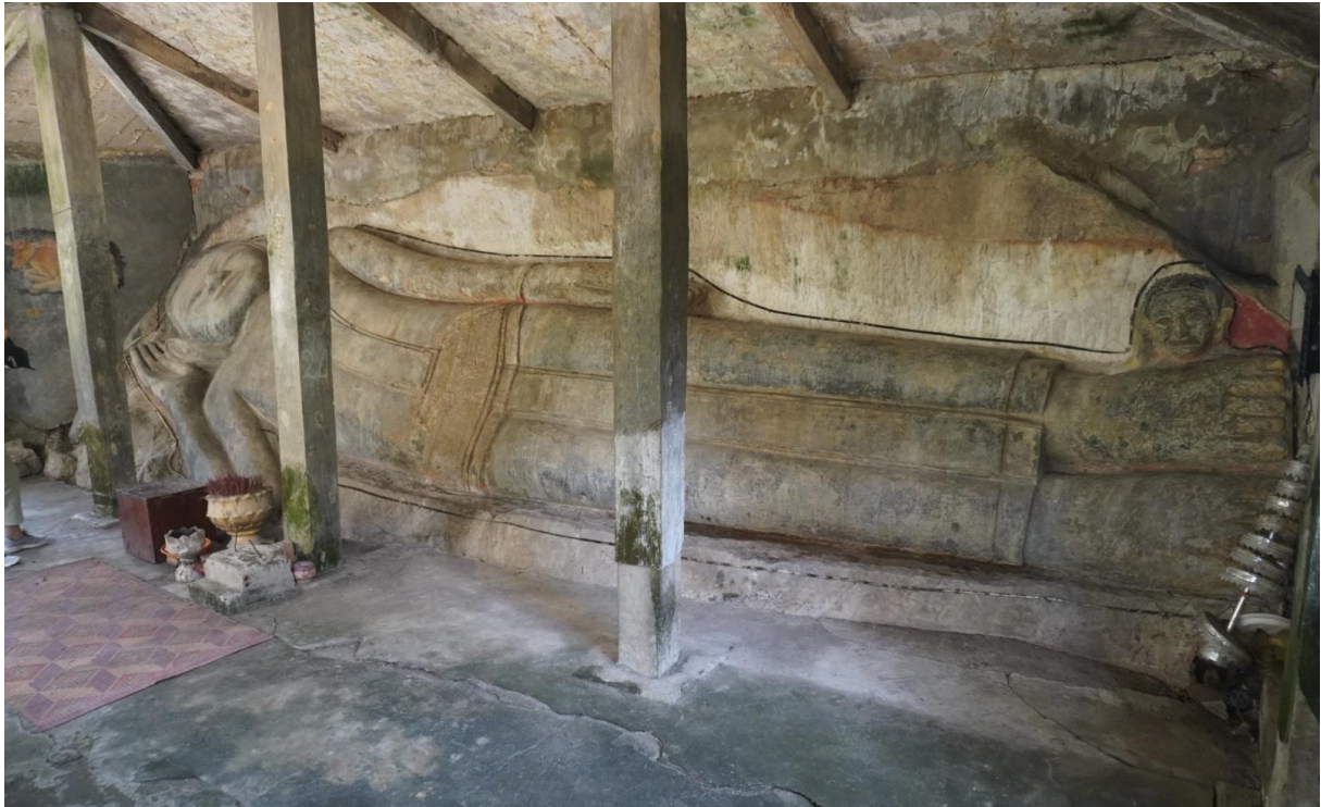
រូបលេខ១៖ ព្រះពុទ្ធចូលបរិនិព្វាន