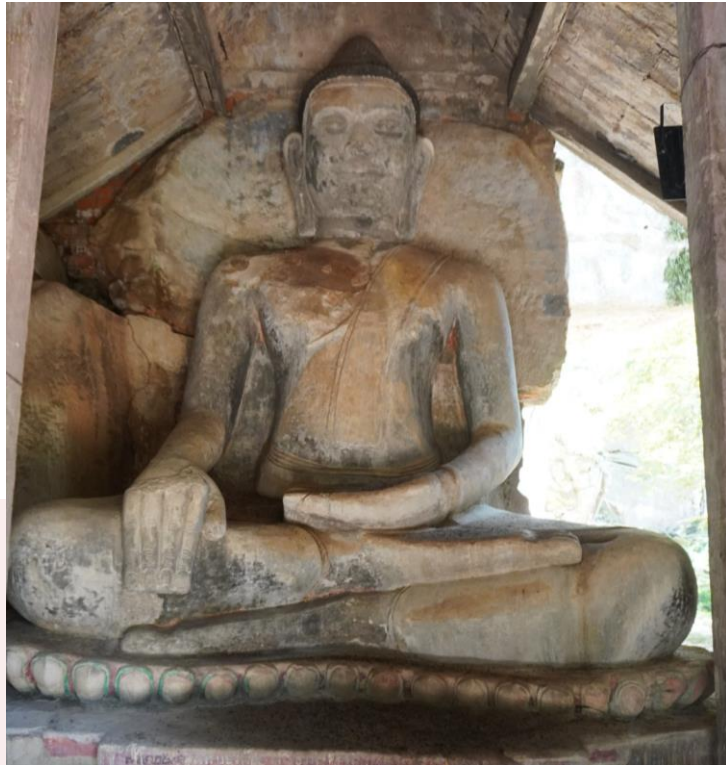
រូបលេខ៥៖ ព្រះពុទ្ធកង់ក្លែន ទំនងជា សិអាហ្សមេត្រិយ កាយវិការ ភូមិស្បស័មុទ្រ