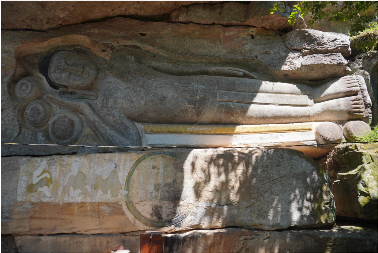
រូបលេខ៣៖ ព្រះពុទ្ធចូលបរិនិព្វាន