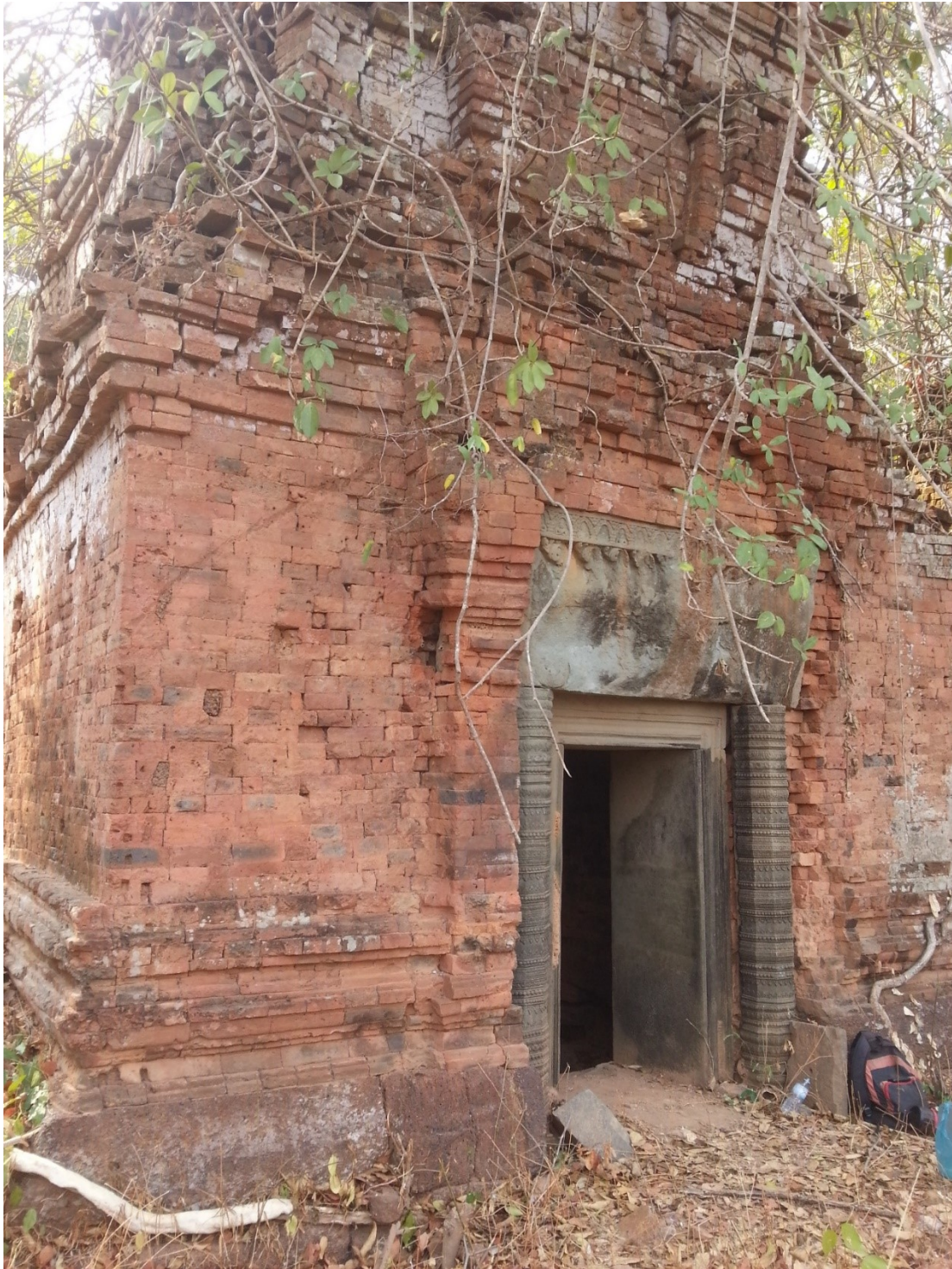
រូបលេខ៣៖ ប្រាសាទភ្នំម្រេចភ្នំប៉មខាងត្បូង