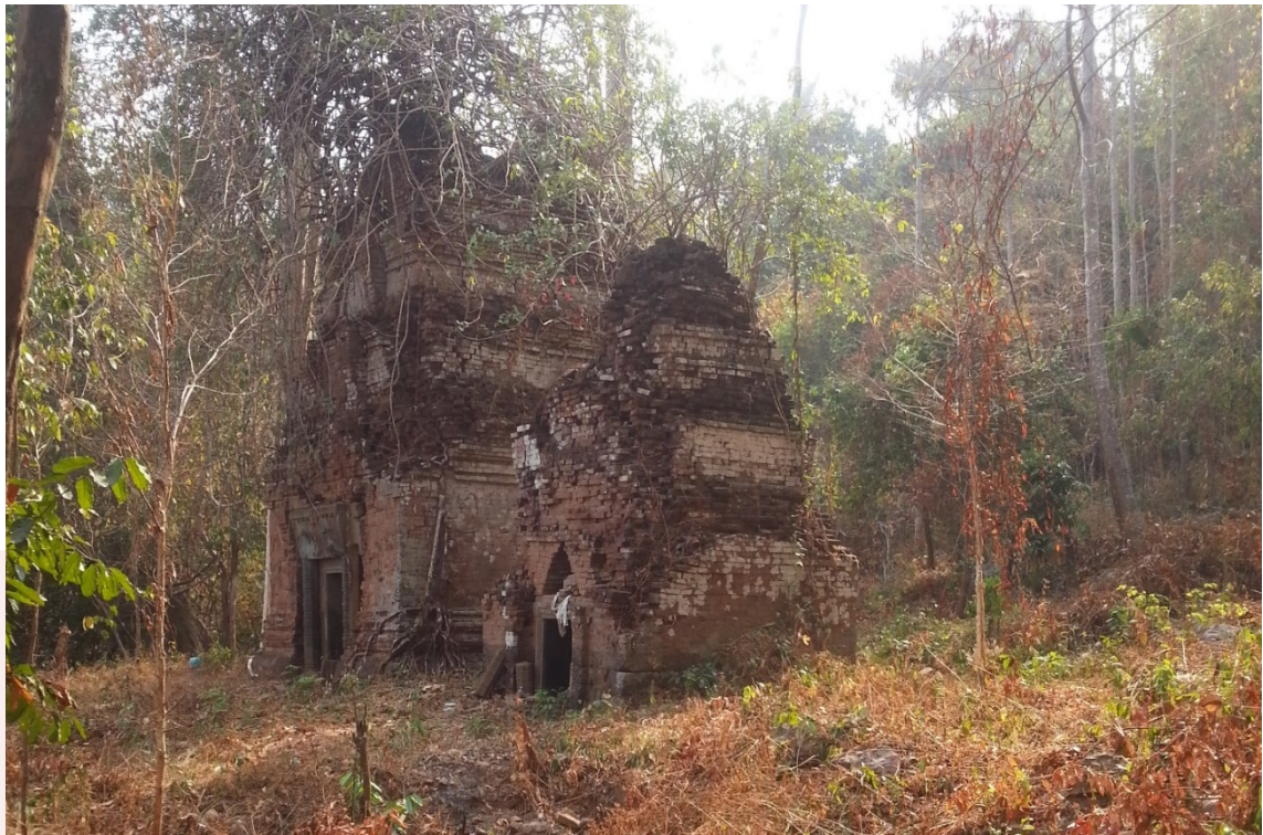
រូបលេខ១៖ ប្រាសាទភ្នំម្រេច មើលពីទិសឦសាន