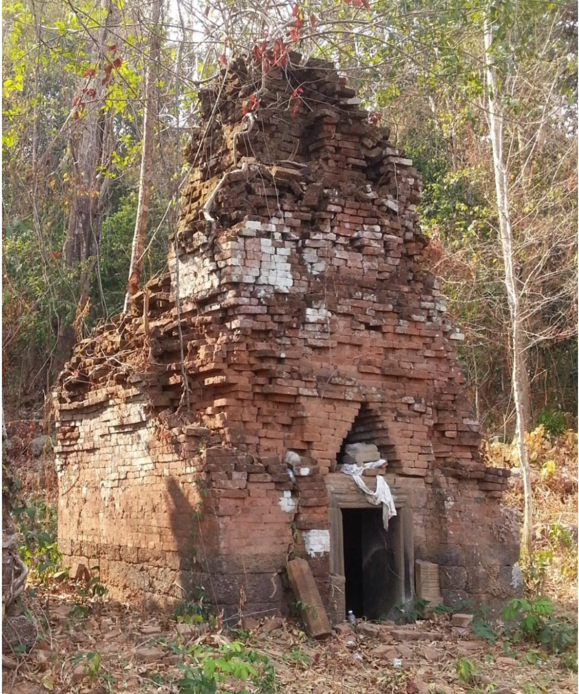
រូបលេខ២៖ ប្រាសាទភ្នំម្រេចតូចម្ខាងជើង