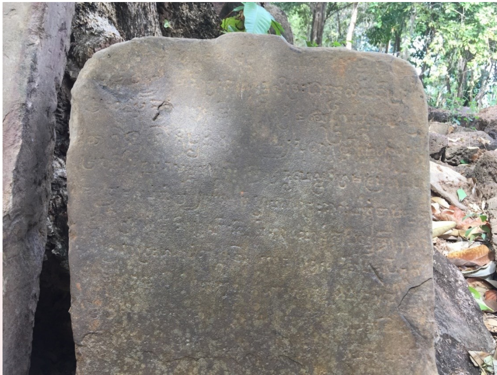
រូបលេខ៣៖ សិលាចារឹកផ្ទាំងទី១ រកឃើញនៅប្រាសាទភ្នំដាច់