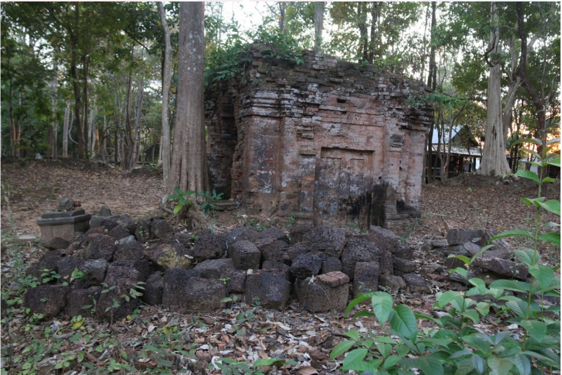
រូបលេខ២៖ ប្រាសាទភ្នំដាច់ មើលពីទិសឦសាន