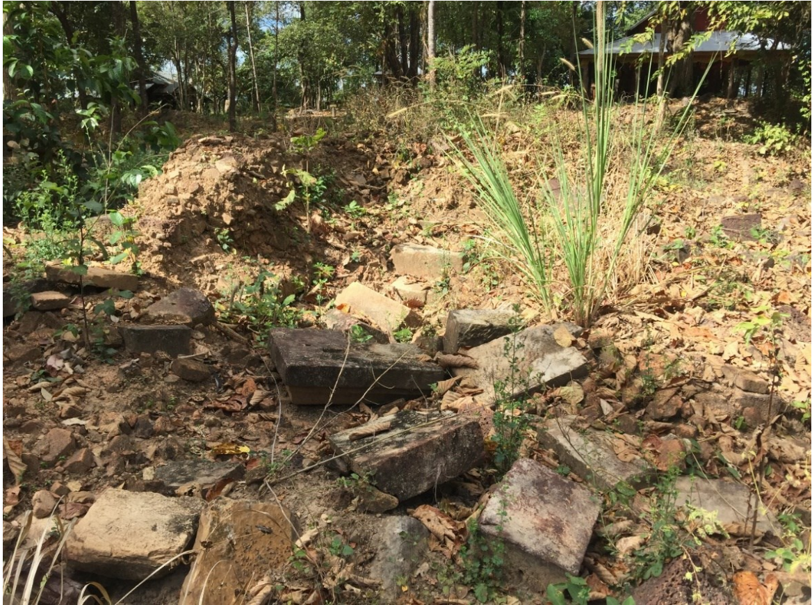
រូបលេខ៣៖ គ្រឹះប្រាសាទតួប៉មទី២ នៃប្រាសាទភ្នំដាច់