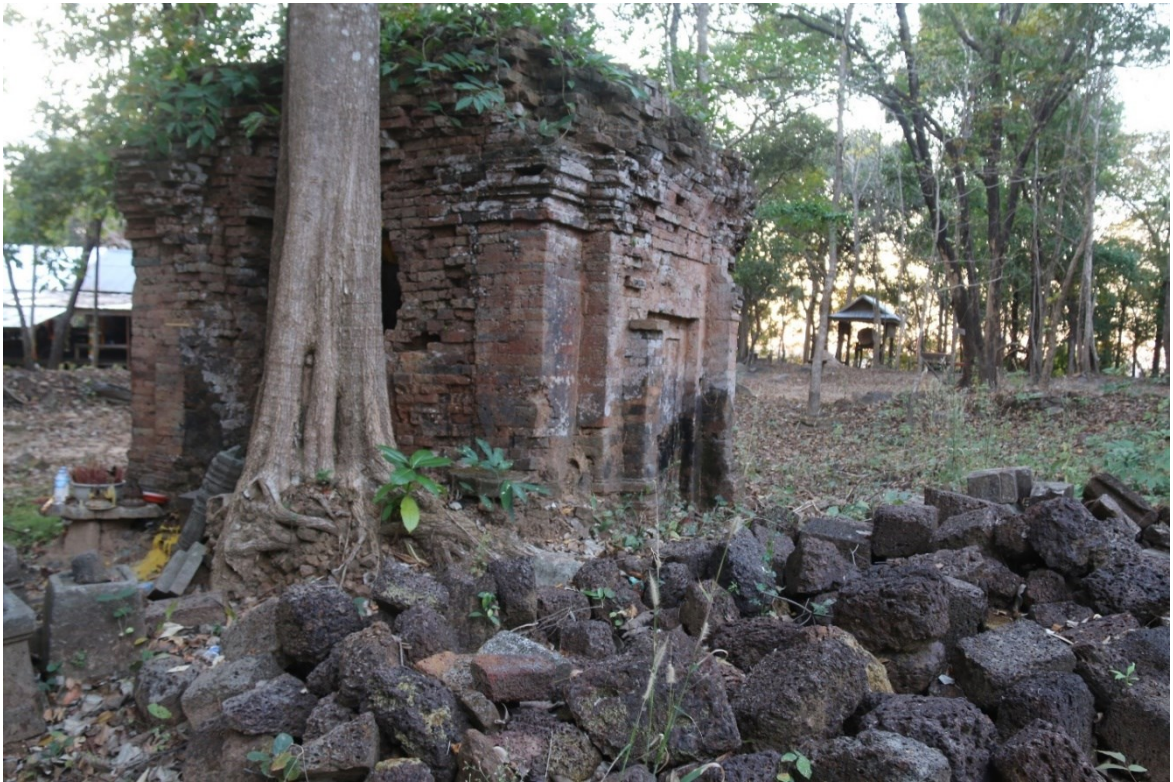
រូបលេខ១៖ ប្រាសាទភ្នំដាច់ ភ្នំប៉ែនទី១ មើលពីទិសខាងកើត