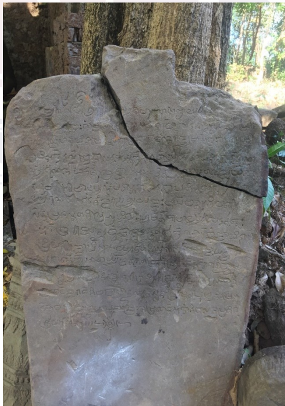
រូបលេខ៤៖ គោលសិលាចារឹកផ្ទាំងទី២ រកឃើញនៅប្រាសាទភ្នំដាច់