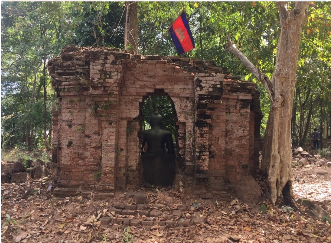
រូបលេខ២៖ ប្រាសាទភ្នំដាច់ ភ្នំប៉ែនទី១ មើលពីទិសខាងលិច