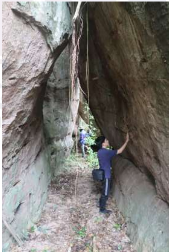
រូបលេខ១១