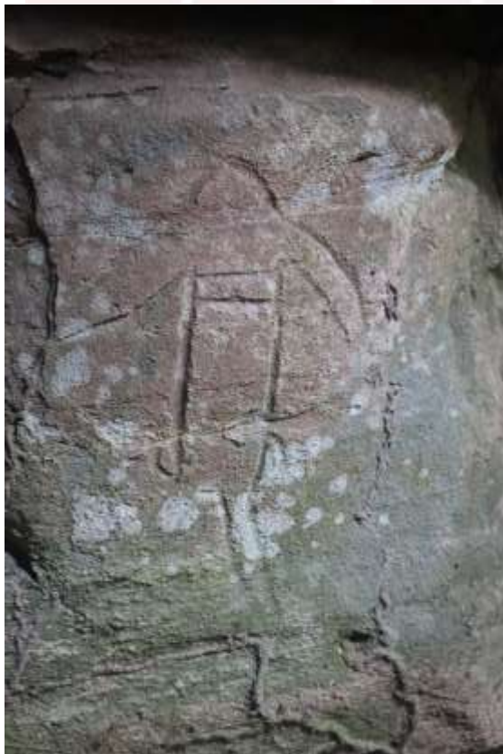
រូបលេខ១០