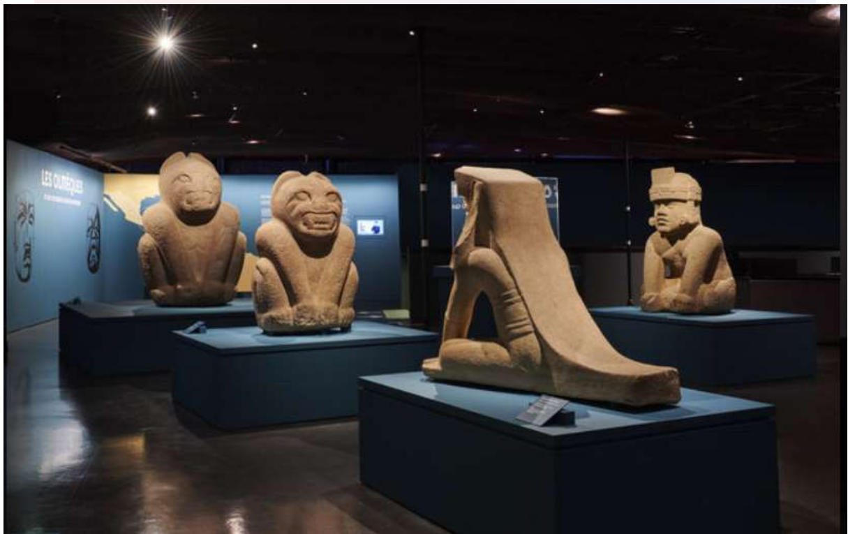
រូបលេខ៨៖ រូបចម្លាក់ដាក់តាំងបង្ហាញនៅក្នុងសារមន្ទីរ Quai branly ប្រទេសបារាំង អត្ថបទដោយ៖ អេង តុលា