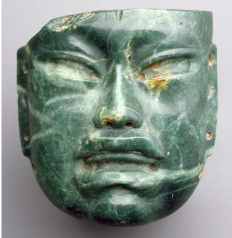
រូបលេខ២៖ របាំងមុខ