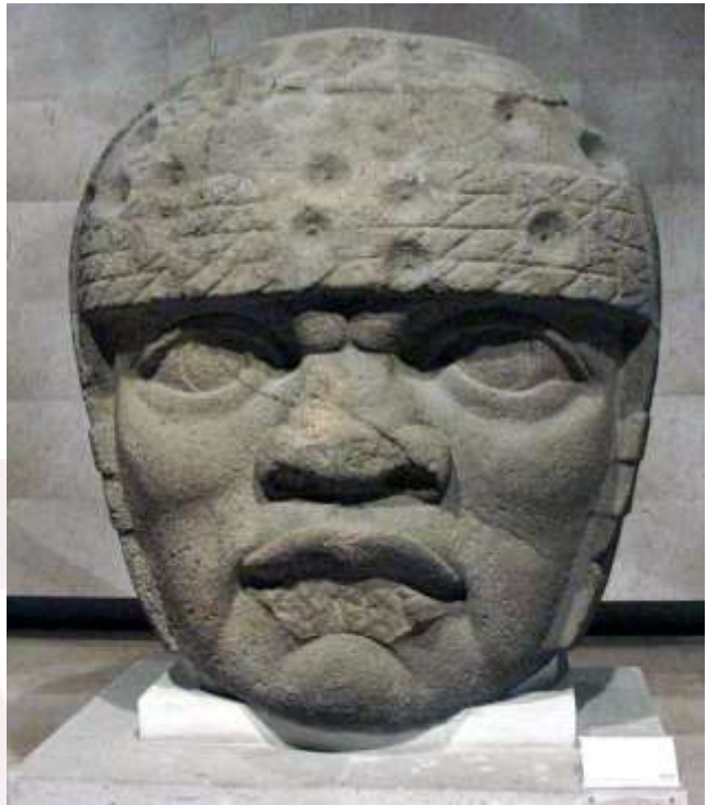
រូបលេខ៥៖ រូបចម្លាក់ក្បាលមនុស្ស ( Colossal stone heads )