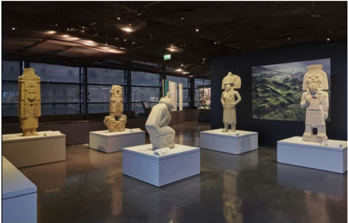
រូបលេខ៧៖ រូបចម្លាក់ដាក់តាំងបង្ហាញនៅក្នុងសារមន្ទីរ Quai branly ប្រទេសបារាំង