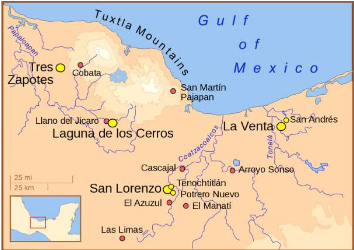
រូបលេខ១៖ ផែនទីបង្ហាញទីក្រុងសំខាន់ៗទាំងពីរនៃអរិយធម៌អូលមេក

មុនគ.ស រហូតដល់២០០មុនគ.ស. ១១ និងជាដើមកំណើត (Mother culture) នៃបណ្តាអរិយធម៌ ក្នុងតំបន់មេសូអាមេរិក (Mesoamerica) ១២ យើងក៏ឃើញមានដាក់តាំងបង្ហាញរូបចម្លាក់ នៃអរិយធម៌អូលមេកនៅក្នុងសារមន្ទីរ Quai Branly នៅប្រទេសបារាំង(រូបលេខ៧-៩)។