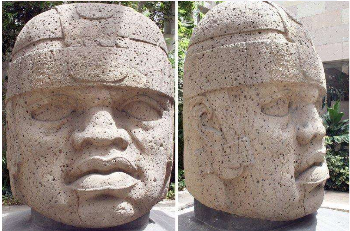
រូបលេខ៣៖ រូបចម្លាក់ក្បាលមនុស្ស ( Colossal stone heads )