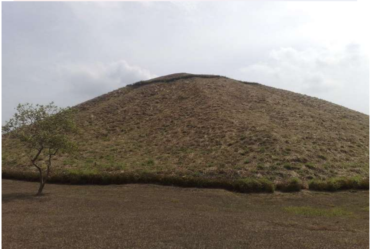
រូបលេខ៦៖ សំណង់ពីរ៉ាមីត ( Pyramid of San Lorenzo (Veracruz) ) ដោយ៖ អេង តុលា