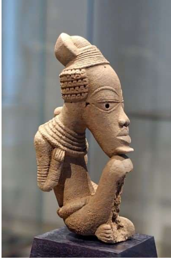
រូបលេខ២៖ រូបចម្លាក់ក្នុងសិល្បៈណុក