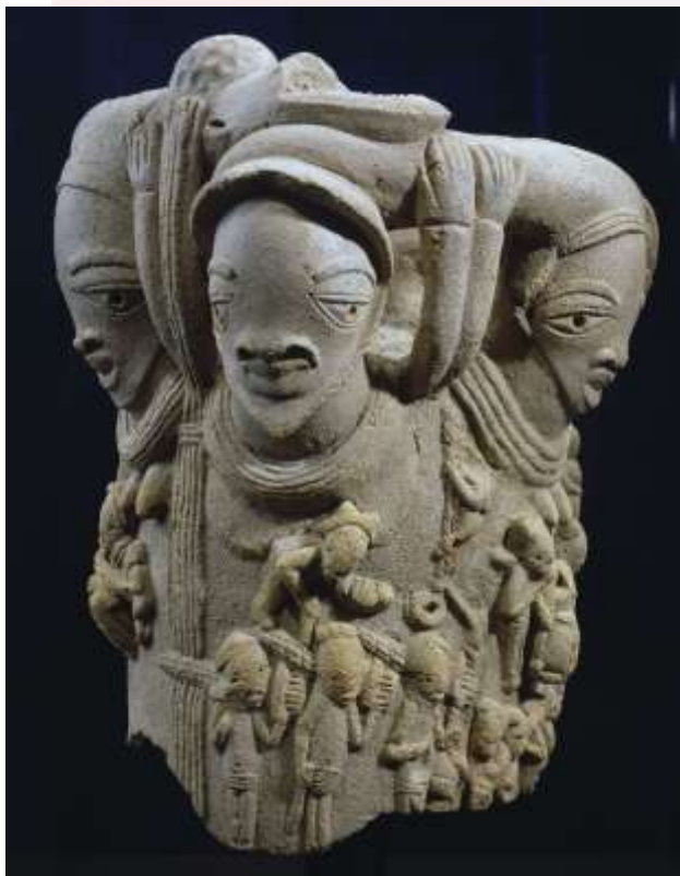
រូបលេខ៣៖ រូបចម្លាក់ក្នុងសិល្បៈណុក

https://www.researchgate.net/publication/319638198_Early_West_African_Iron_Smelting_The_Legacy_of_Taruga_in_Light_of_Recent_Nok_Research )