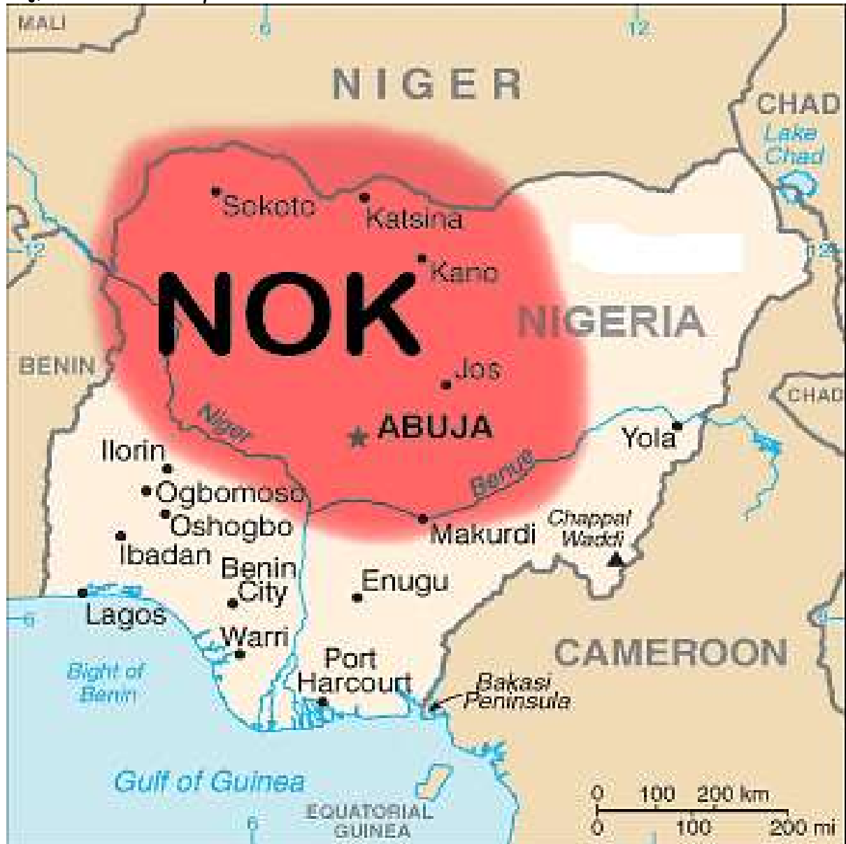
រូបលេខ១៖ ផែនទីនៃអរិយធម៌ណុក