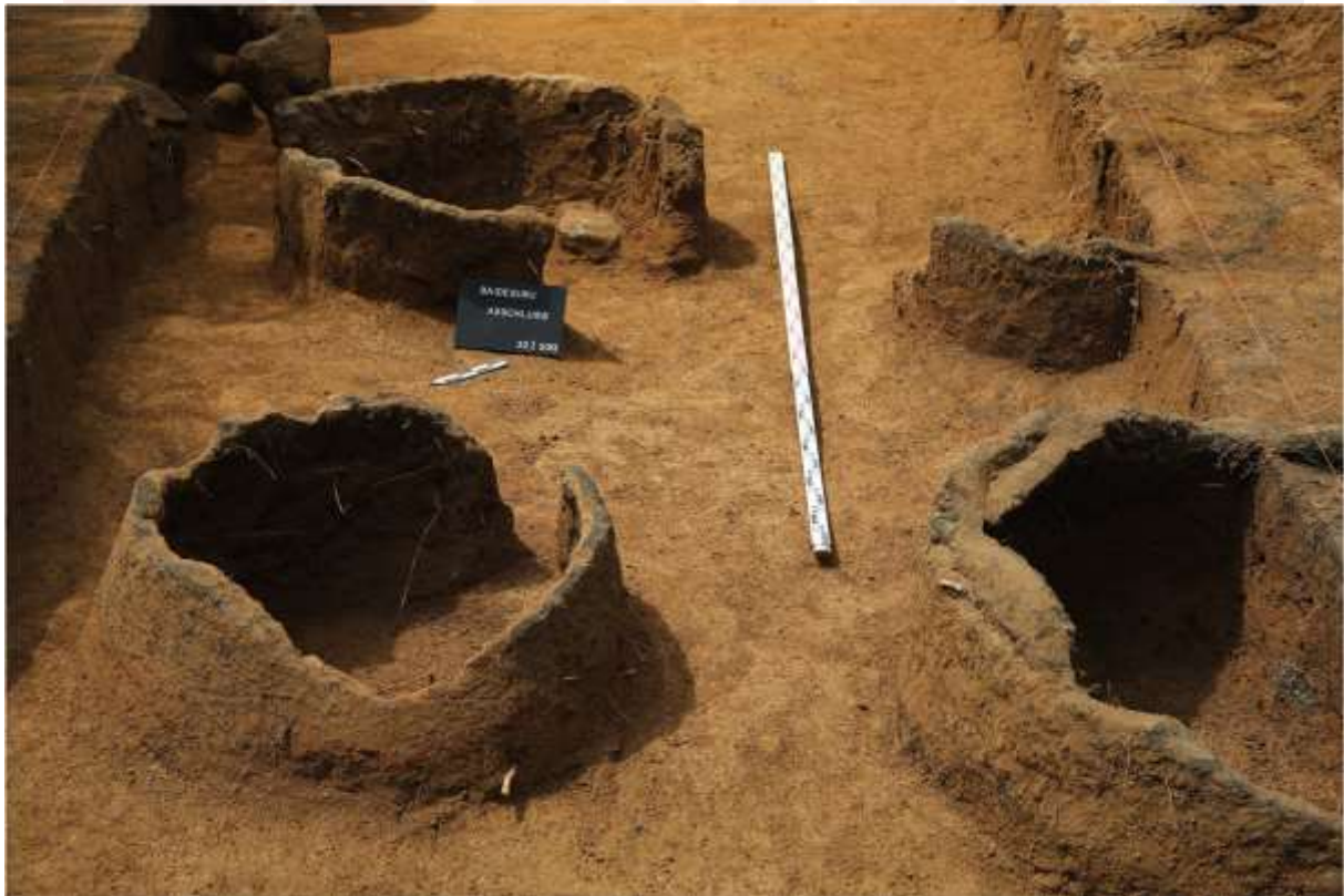
រូបលេខ៣៖ ចង្រ្កាន់ស្នូដៃក