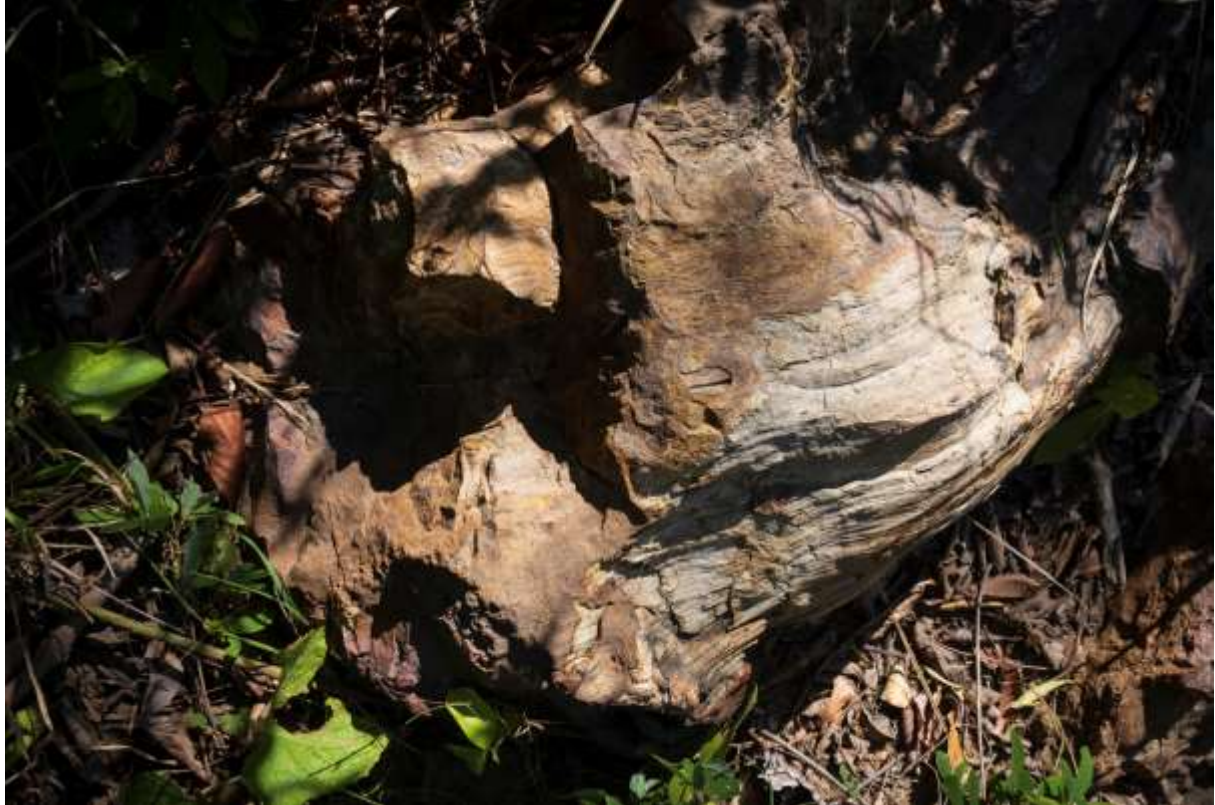
រូបលេខ៧ រូបលេខ៩ រូបថតក្រឡេកនៃផ្លូវស៊ីលឈើ