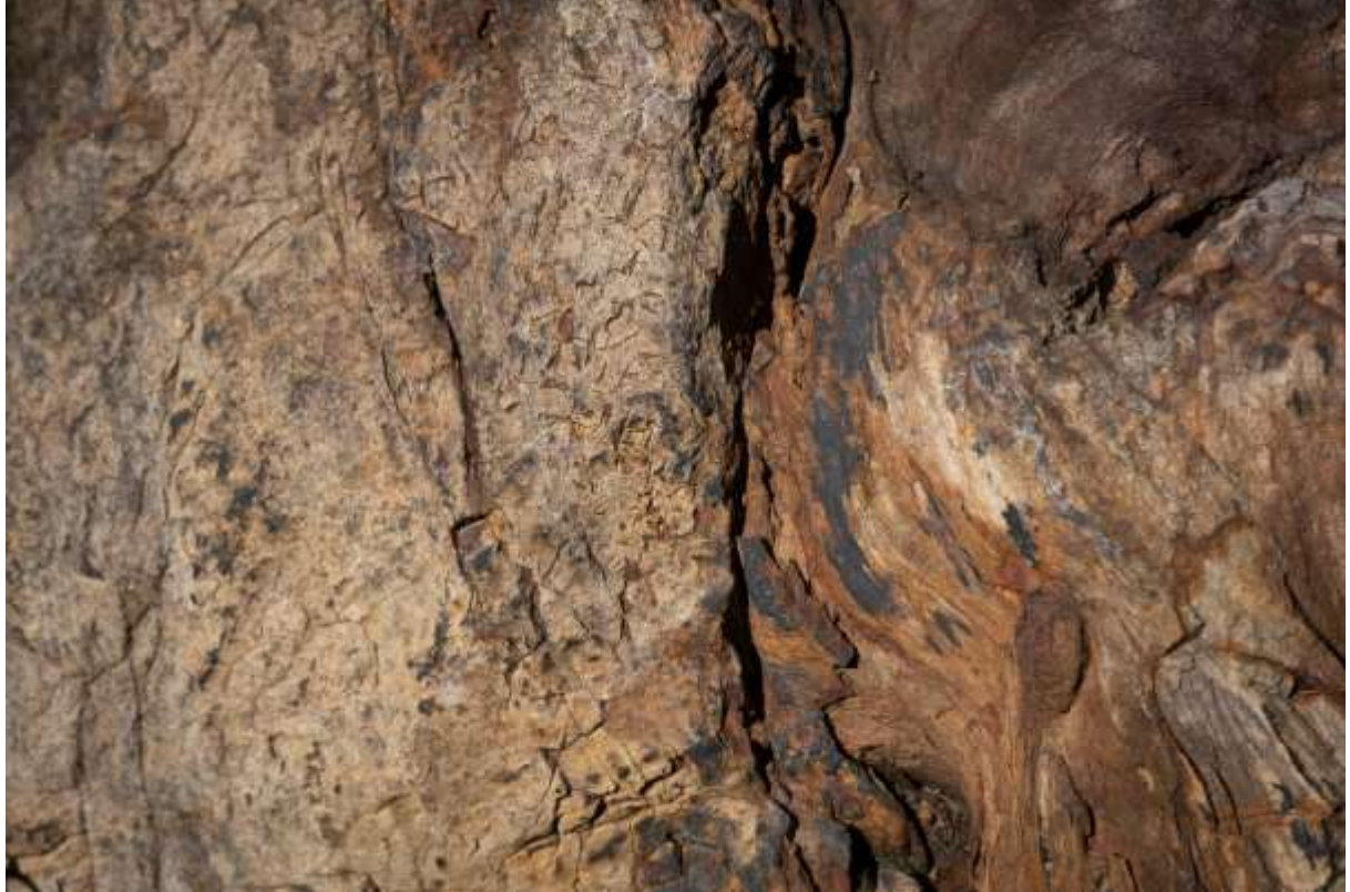
រូបលេខ៥ រូបថតភ្នំគូលែននៃផូស៊ីលឈើ