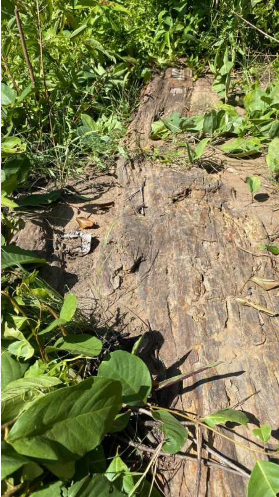
រូបលេខ៩ រូបផ្នែកមួយនៃដើមឈើដែលមានប្រវែង២០ម៉ែត្រ