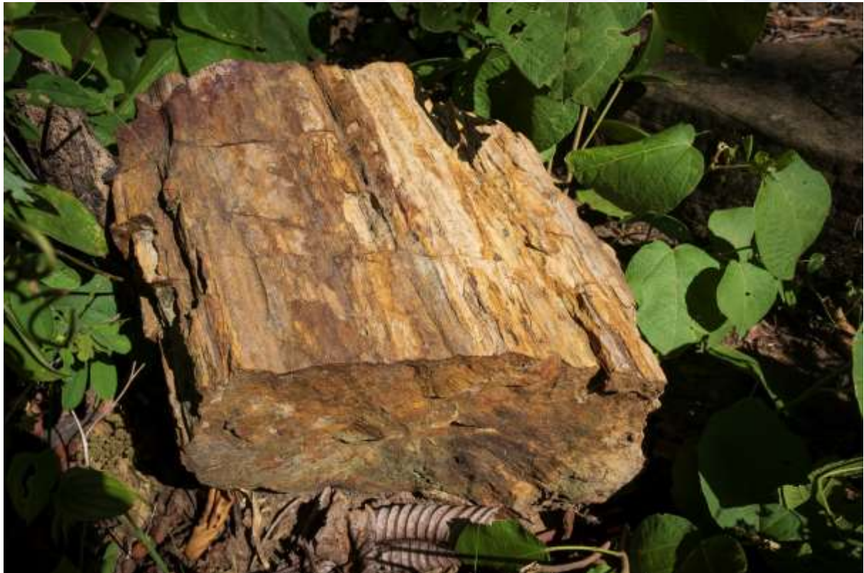
រូបលេខ៨ រូបថតក្រឡេកនៃផ្លូវស៊ីលឈើ