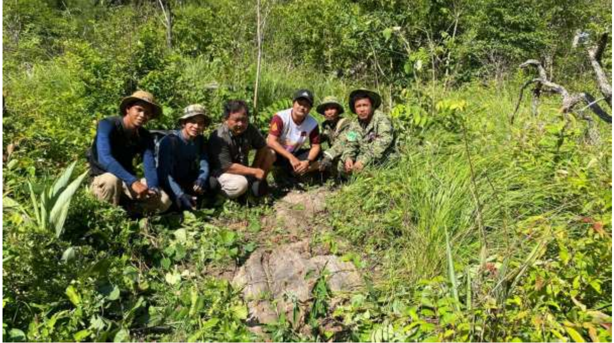
រូបលេខ៣ សកម្មភាពក្នុងពេលរកឃើញដោយចៃដន្យ