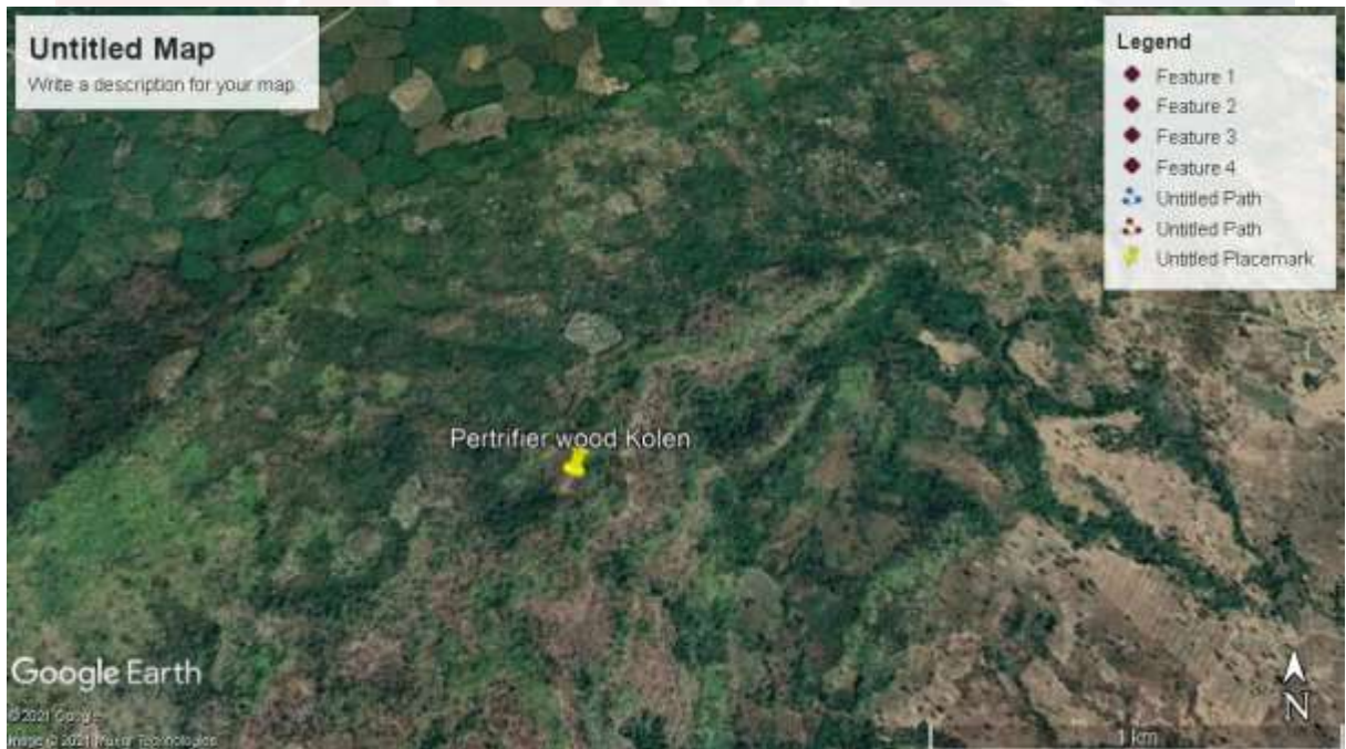
រូបលេខ២ ទីតាំងផ្លូវដើមឈើថ្ម ធៀបនិងចម្រាក់ នៃភ្នំគូលែន