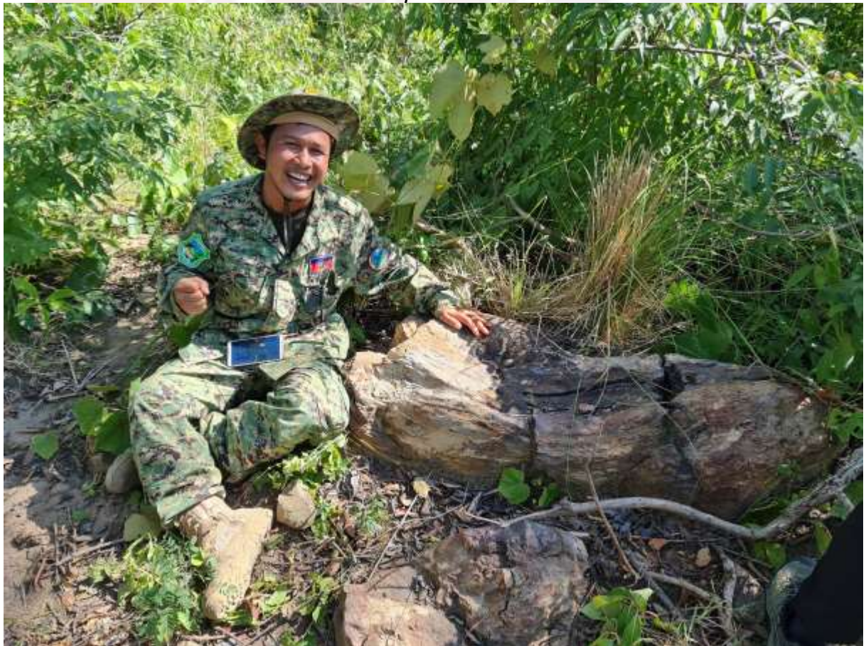
រូបលេខ៤ ភាពរីករាយក្នុងការរកឃើញ