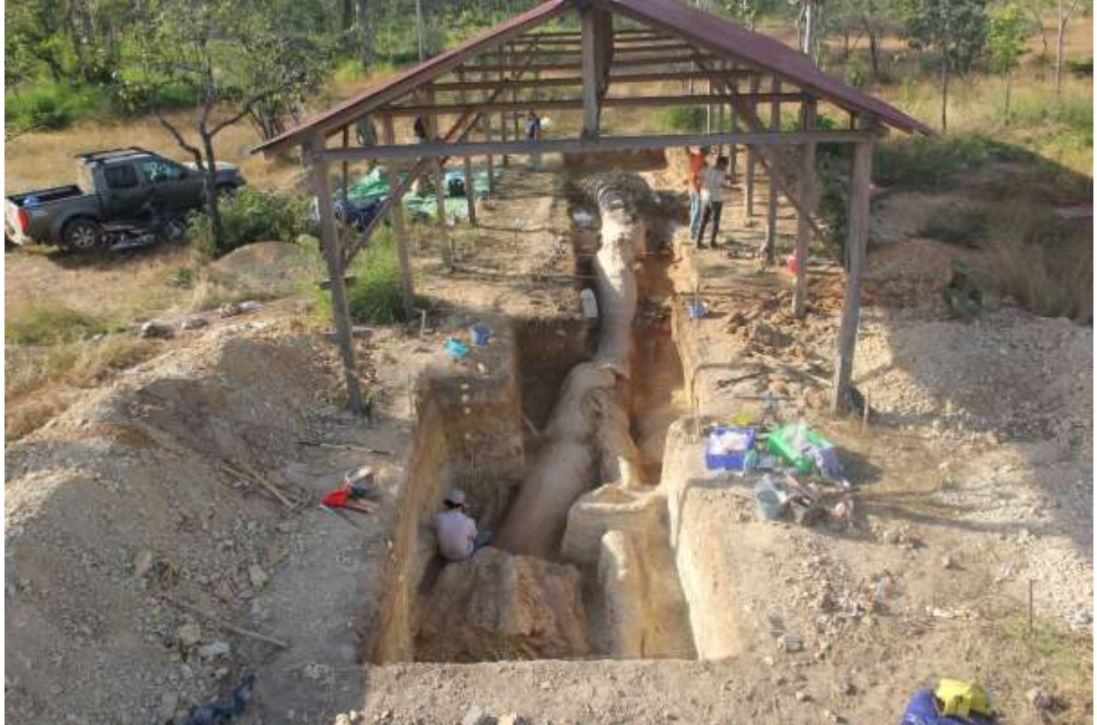
រូបលេខ១១ ផ្លូវស៊ីលដើមឈើថ្ម ដែលកំណាយឆ្នាំ២០២០ នៅស្រុកលំផាត់ ខេត្តរតនគិរី