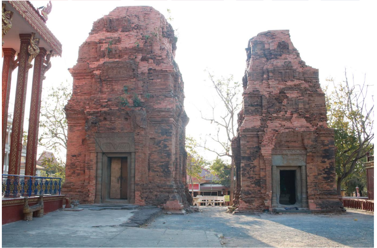
រូបលេខ១៖ ប្រាសាទនាងខ្មៅ ខេត្តតាកែវ មើលពីមុខខាងកើត

Coedès, G. 1950, Inscription du Cambodge . Tome II, Paris.