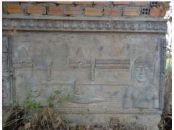
រូបលេខ៤៖ ក្រពើអាជនបញ្ជិះព្រះនាងកែវប្រាំពីរពណ៌