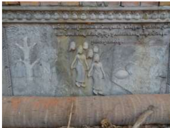
រូបលេខ៣៖ ព្រះនាងកែវប្រាំពីរពណ៌ប្រទះពងក្រពើ