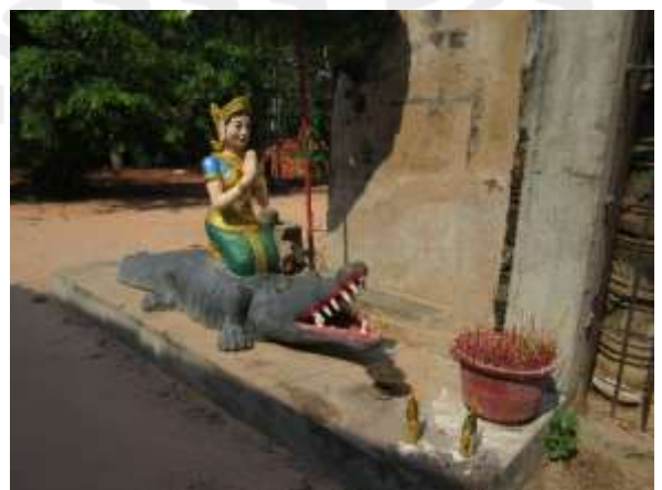
រូបលេខ៦៖ ចម្លាក់នាងកែវប្រាំពីរពណ៌គង់លើក្រពើ