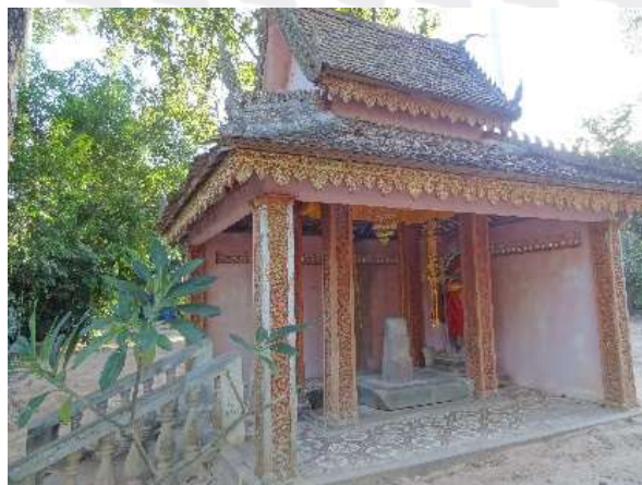
រូបលេខ៥៖ រោងតាដាក់