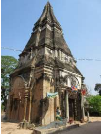
រូបលេខ១៖ ប្រាសាទវត្តចេតិយ