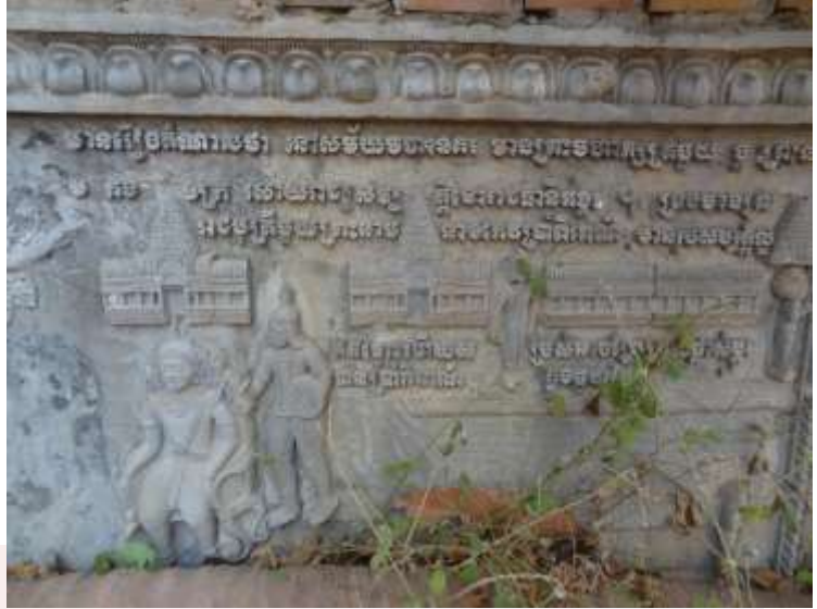
រូបលេខ២៖ រៀបរាប់ផ្ដើមរឿង