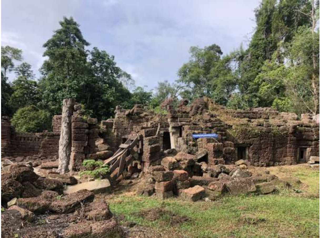
រូបលេខ៥៖ ប្រាសាទក្រោលរមាស នៅលើភ្នំគូលែនធ្វើអំពីថ្មបាយក្រៀម