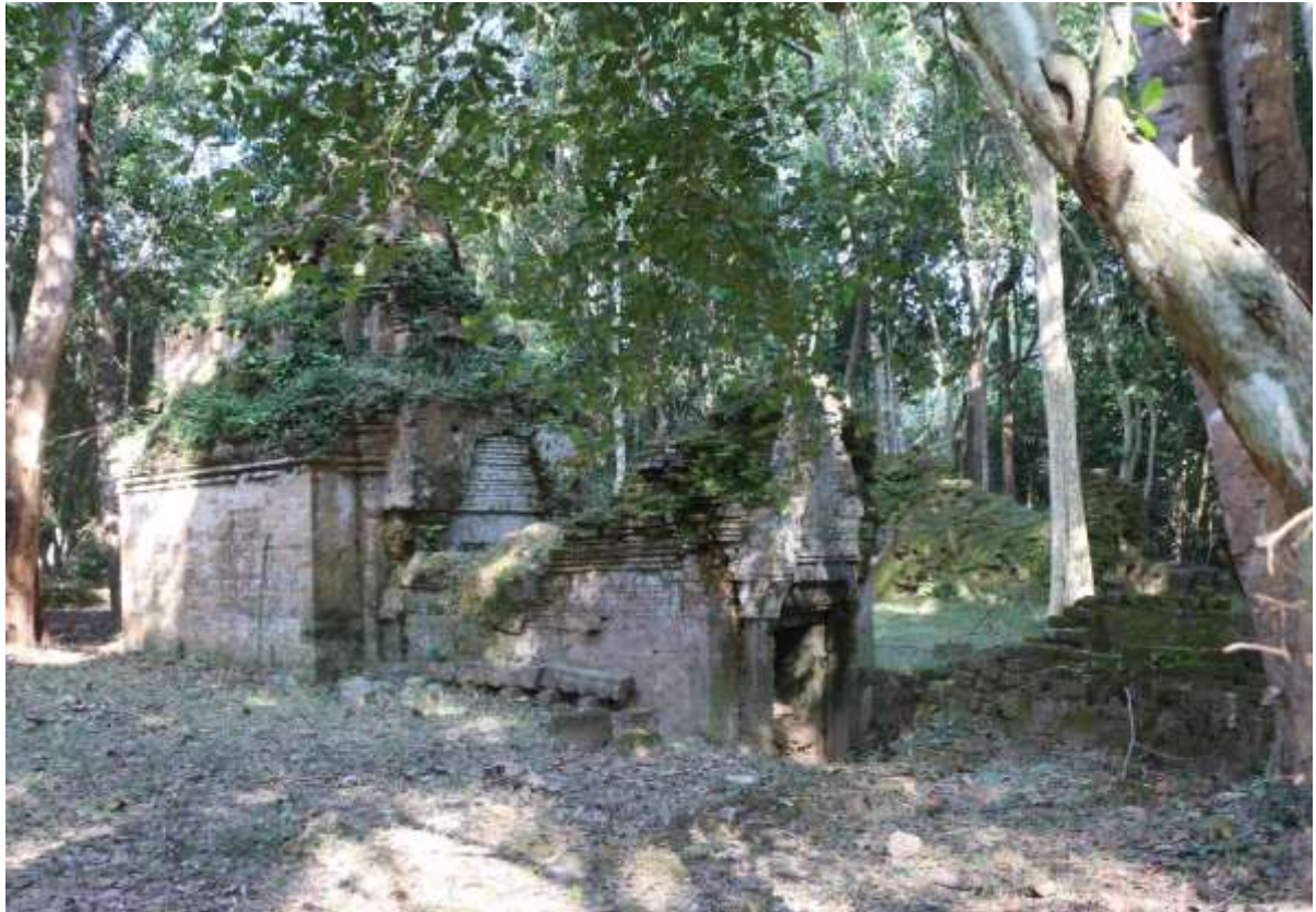
រូបលេខ១៖ ប្រាសាទរបងរមាស ភ្នំប៉ែន K6 (មើលពីមុខអាគ្នេយ៍)