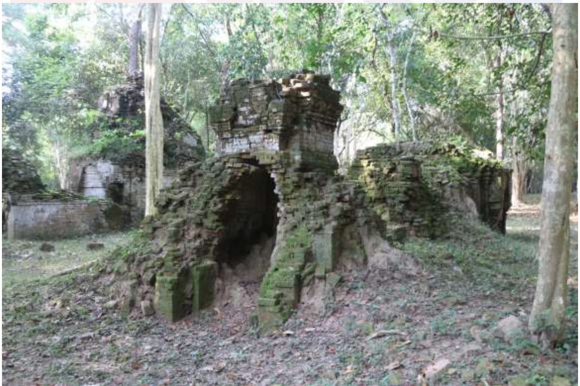
រូបលេខ២៖ ប្រាសាទរបងរមាស ភ្នំប៉ែន K7 (មើលពីមុខឦសាន)