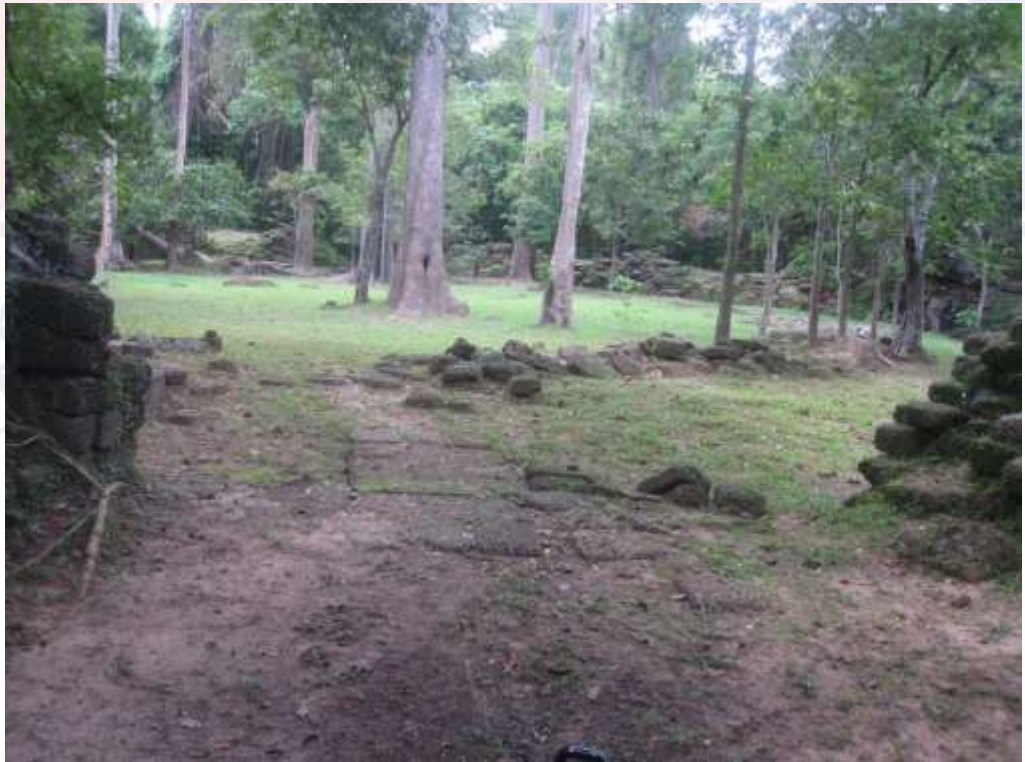
រូបលេខ៤៖ ប្រាសាទក្រោលរមាស នៅតំបន់អង្គរ ធ្វើអំពីថ្មបាយក្រៀម