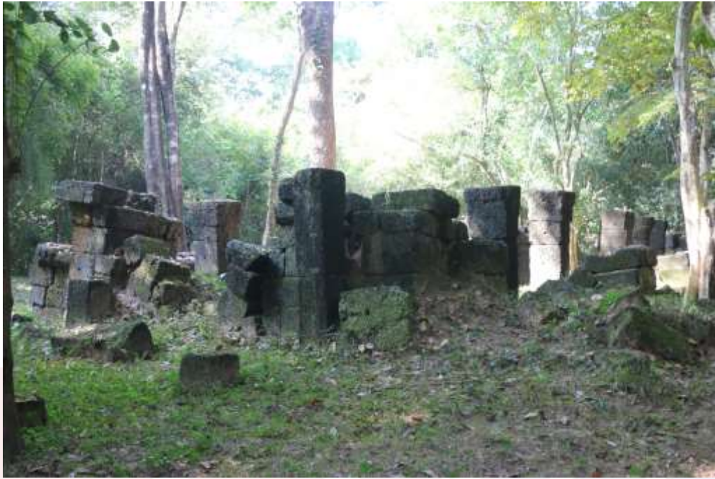
រូបលេខ៣៖ ប្រាសាទរបងរមាសធ្វើអំពីថ្មបាយក្រៀម ភ្នំប៉ែន K8 (មើលពីមុខឆ្នាំសាន)