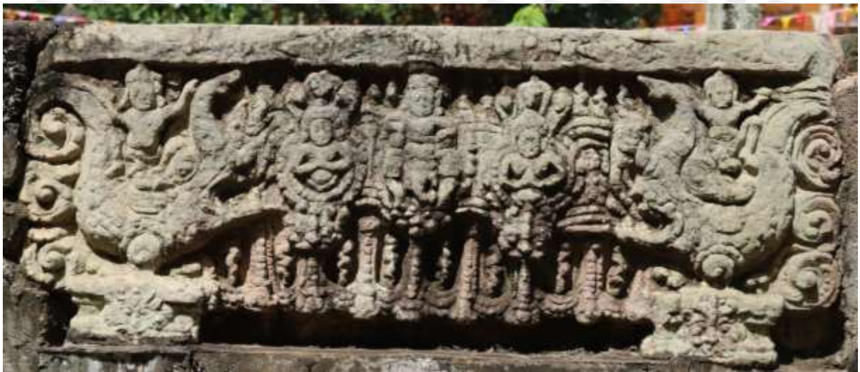
រូបលេខ៦៖ ផ្តែររកឃើញនៅវត្តសូកាស ខេត្តកំពង់ចាម