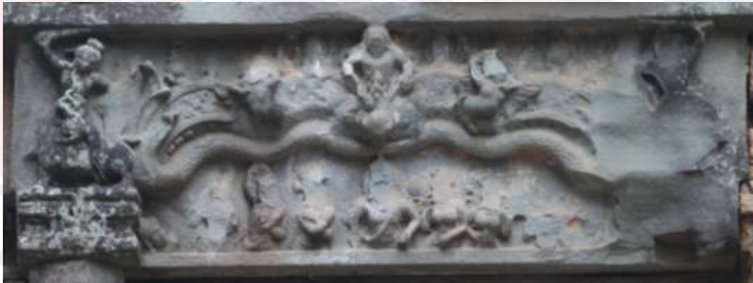
រូបលេខ២៖ ផ្តែរប្រាសាទយាយព័ន្ធ តំបន់ប្រាសាទសំបូរព្រៃគុក ខេត្តកំពង់ធំ