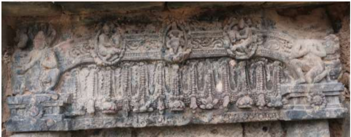
រូបលេខ៥៖ ផ្តែរប្រាសាទព្រះធាតុរកា ខេត្តកំពង់ធំ