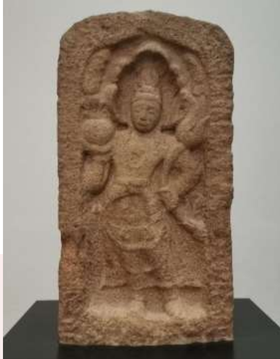
រូបលេខ១៖ រូបនាគរាជក្នុងទម្រង់ជាទ្វារបាលនៃសិល្បៈឥណ្ឌាបុរាណ ស.វ.ទី៩ (តាំងនៅសារមន្ទីរ V & A, London)