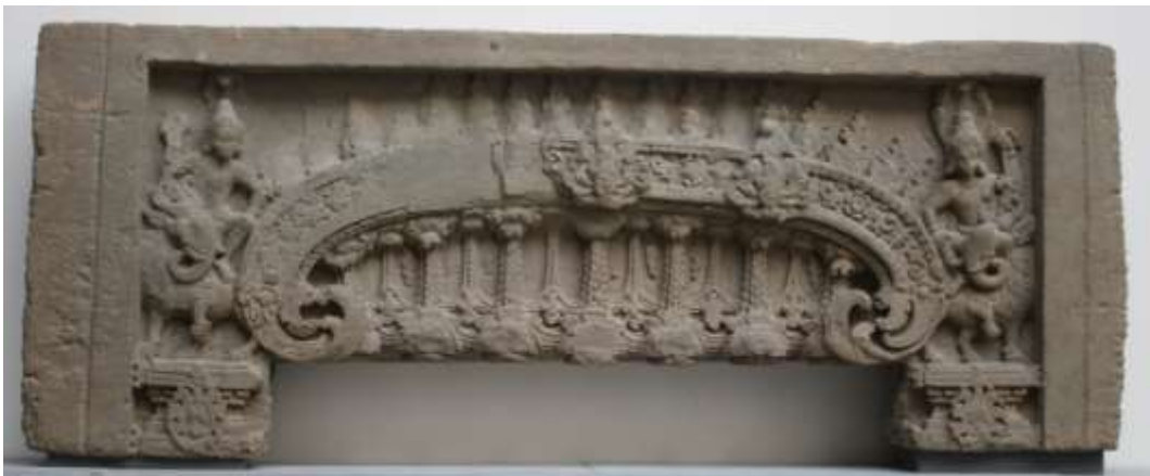
រូបលេខ៣៖ ផ្តែរប្រាសាទព្រៃក្មេង ខេត្តសៀមរាប សព្វថ្ងៃនៅសារមន្ទីរហ្គីមេ ប្រទេសបារាំង