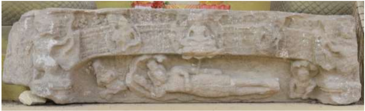
រូបលេខ៧៖ ផ្តែររកឃើញនៅវត្តតាំងស្រែ ខេត្តកំពង់ចាម