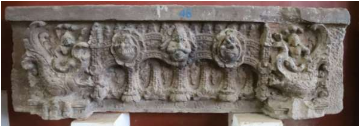
រូបលេខ៤៖ ផ្តែរមិនស្គាល់ប្រភពនៅសារមន្ទីរខេត្តកំពង់ធំ