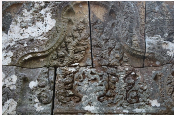
រូបលេខ៤៖ ឈុតព្រះក្រីស្ត្រហែកនាគនៅលើហោរជាង ប្រាសាទព្រះវិហារ