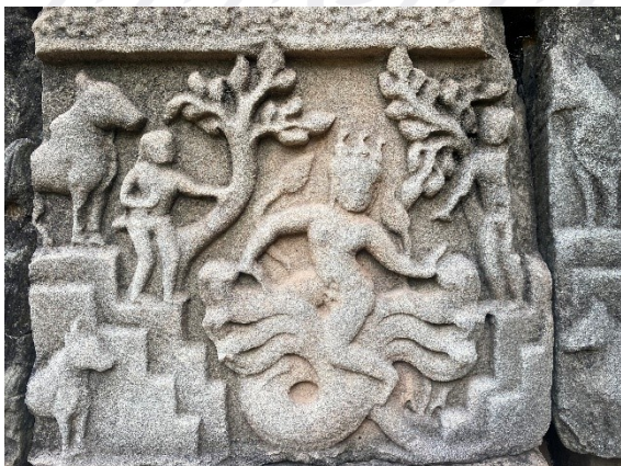
រូបលេខ៥៖ ឈុតព្រះក្រីស្ត្រហែកនាគនៅប្រាសាទបាគួន