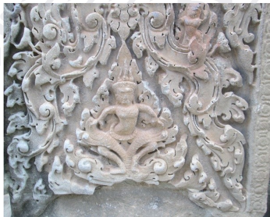
រូបលេខ៦៖ ឈុតព្រះក្រីស្ត្រហែកនាគនៅលើសសររដ្ឋប នៅអង្គរវត្ត