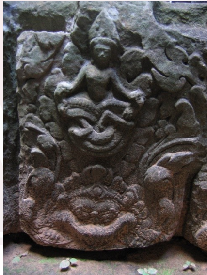
រូបលេខ៩៖ បំណែកផ្តែររូបព្រះក្រីស្ត្រហែកនាគនៅប្រាសាទព្រះខ័ន