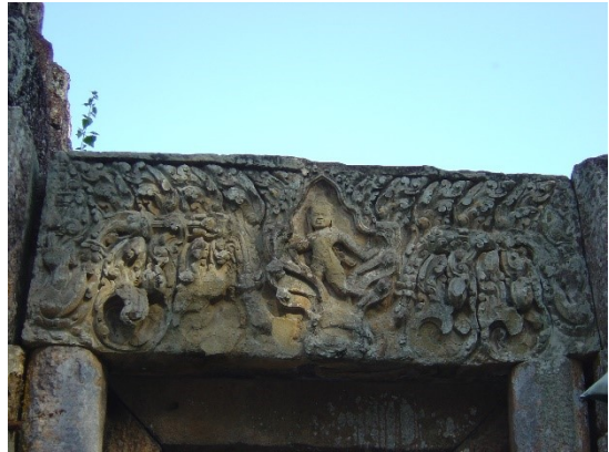
រូបលេខ២៖ ផ្ទៃរូបព្រះក្រីស្ត្រហែកនាគនៅប្រាសាទភ្នំជី