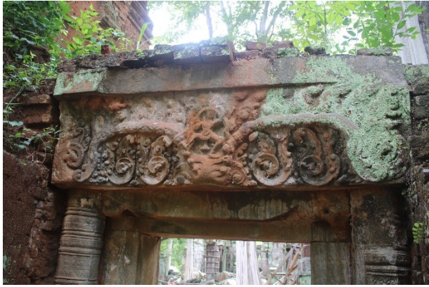
រូបលេខ១៖ ផ្ទៃរូបព្រះក្រីស្ត្រហែកនាគនៅប្រាសាទ ក្រហម