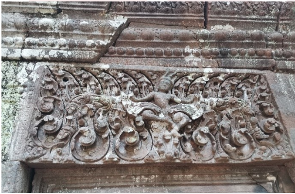
រូបលេខ៣៖ ផ្ទៃរូបព្រះក្រីស្ត្រហែកនាគនៅប្រាសាទវត្តភ្នំ