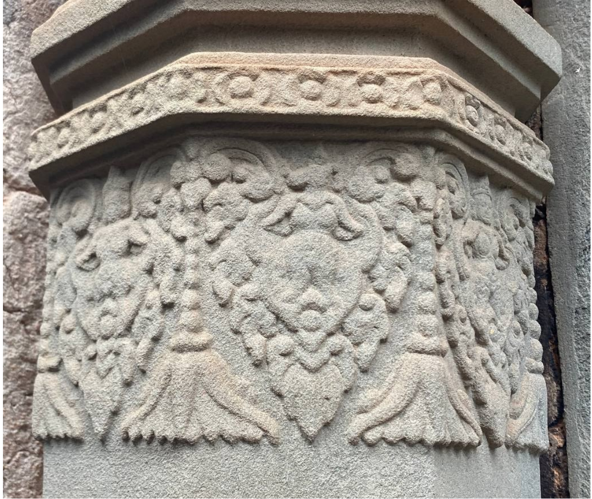
រូបលេខ២៖ ចម្លាក់កិមបុរុសនិងកិណ្ណរត្នាក់នៅលើសសរពេជ្រប្រាសាទព្រះគោ