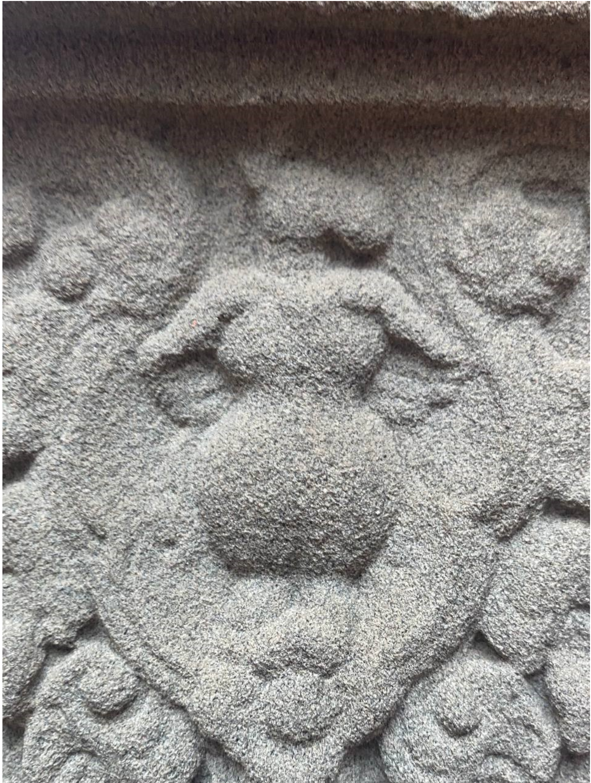
រូបលេខ៥៖ ចម្លាក់កឹមបុរុសនៅលើសសរពេជ្រប្រាសាទព្រះគោ