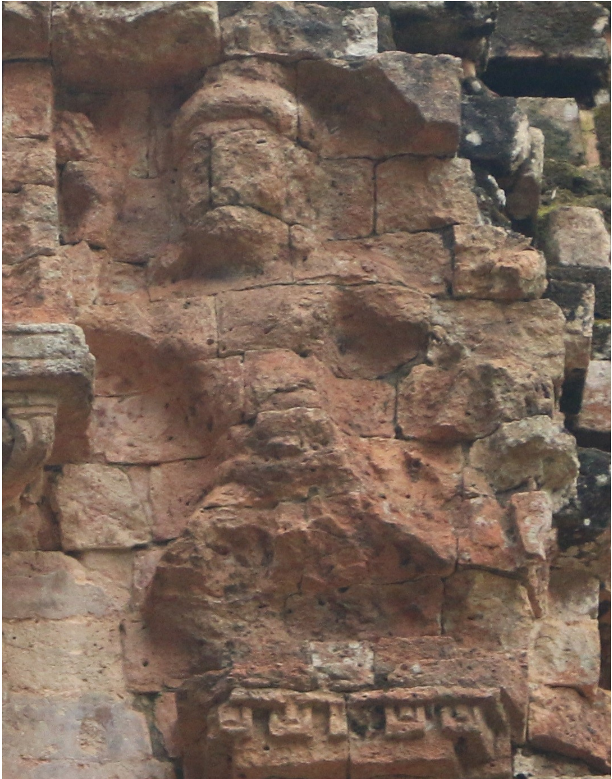
រូបលេខ២៖ ចម្លាក់វិទ្យាធរនៅសំបូរព្រៃគុក