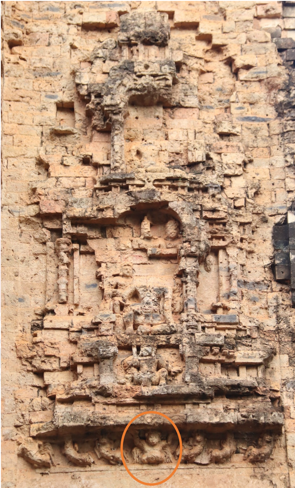
រូបលេខ១១៖ ចម្លាក់កិណ្ណរនៅសំបូរព្រៃគុក