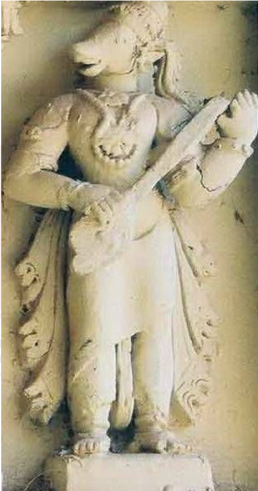
រូបលេខ៣៖ ចម្លាក់កិមបុរុសនៅក្នុងសិល្បៈឥណ្ឌា