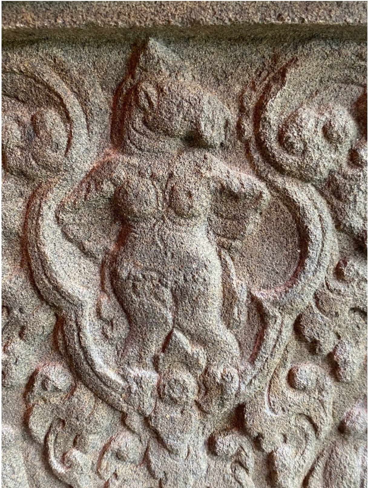
រូបលេខ៦៖ ចម្លាក់កិមបុរុសនៅលើសសរពេជ្រប្រាសាទព្រះគោ