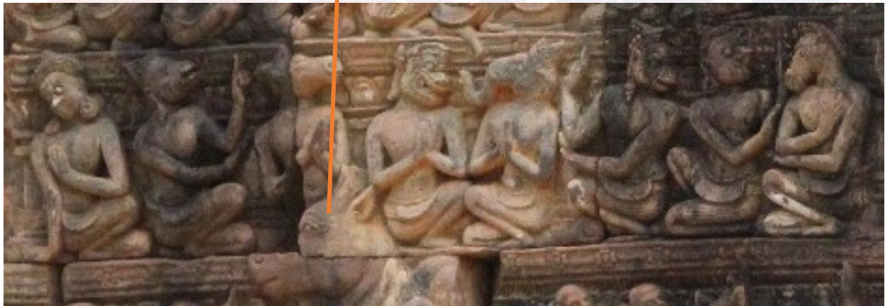
រូបលេខ៧៖ ចម្លាក់ពួកគណមានក្បាលសេះ និងក្បាលសត្វផ្សេងៗនៅហោជាងប្រាសាទបន្ទាយស្រី