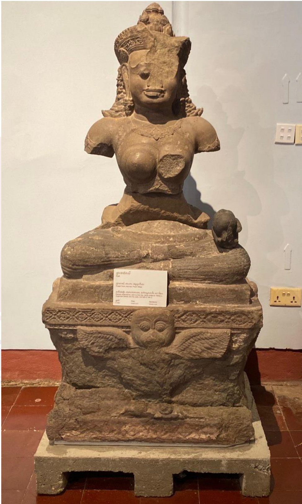
រូបលេខ៣៖ បដិមាព្រះនាងកាលីបន្ទាប់ពីផ្គុំឡើងវិញជាមួយជើងទម្រ និងបំណែក ត្រតាក ហើយដាក់តាំងបង្ហាញនៅសារមន្ទីរជាតិកម្ពុជា (មើលចំពីមុខ)