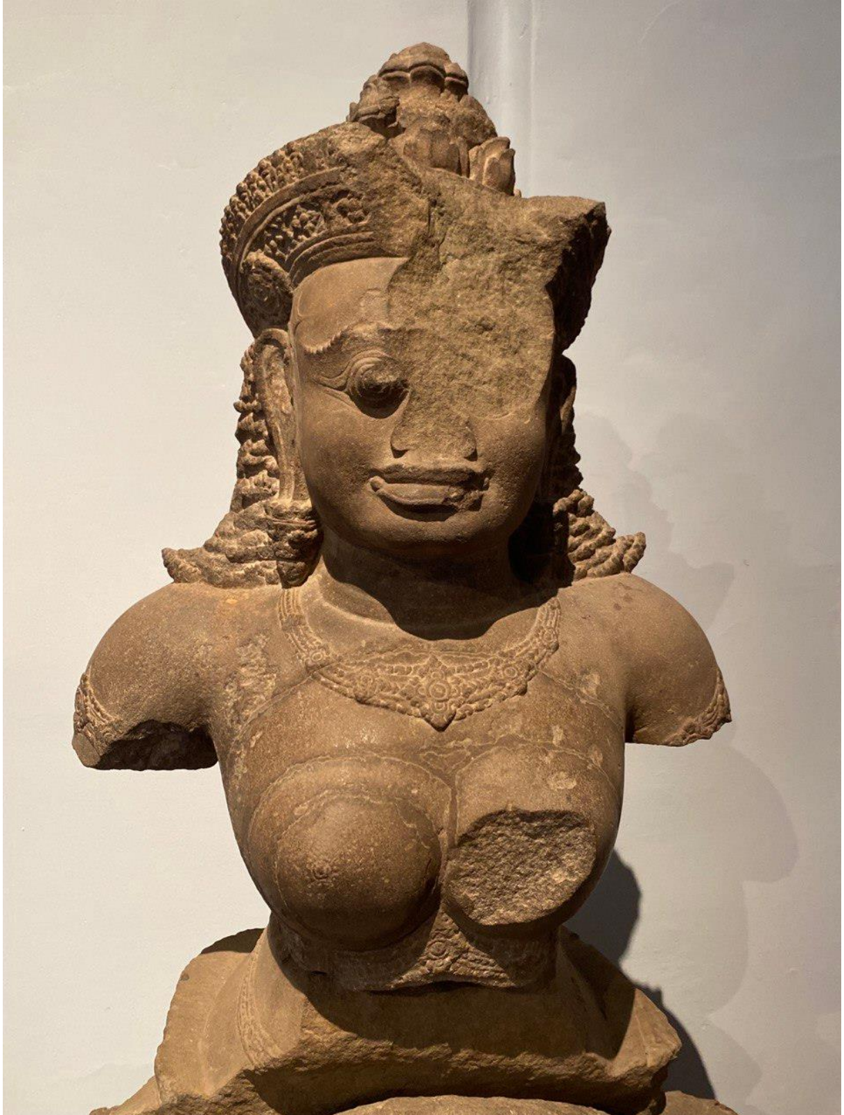
រូបលេខ៥៖ លម្អិតបដិមាព្រះនាងកាលីមួយកំណាត់ខ្លួនឡើងលើ (មើលចំពីមុខ)