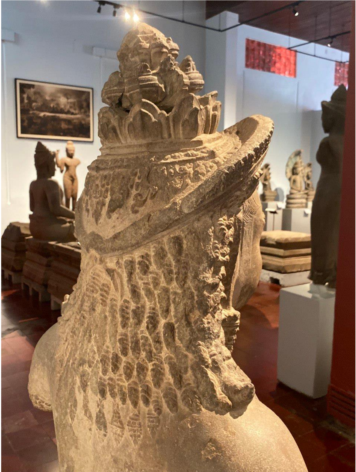
រូបលេខ៧៖ លម្អិតព្រះកេសខាងក្រោយរបស់បដិមាព្រះនាងកាលី