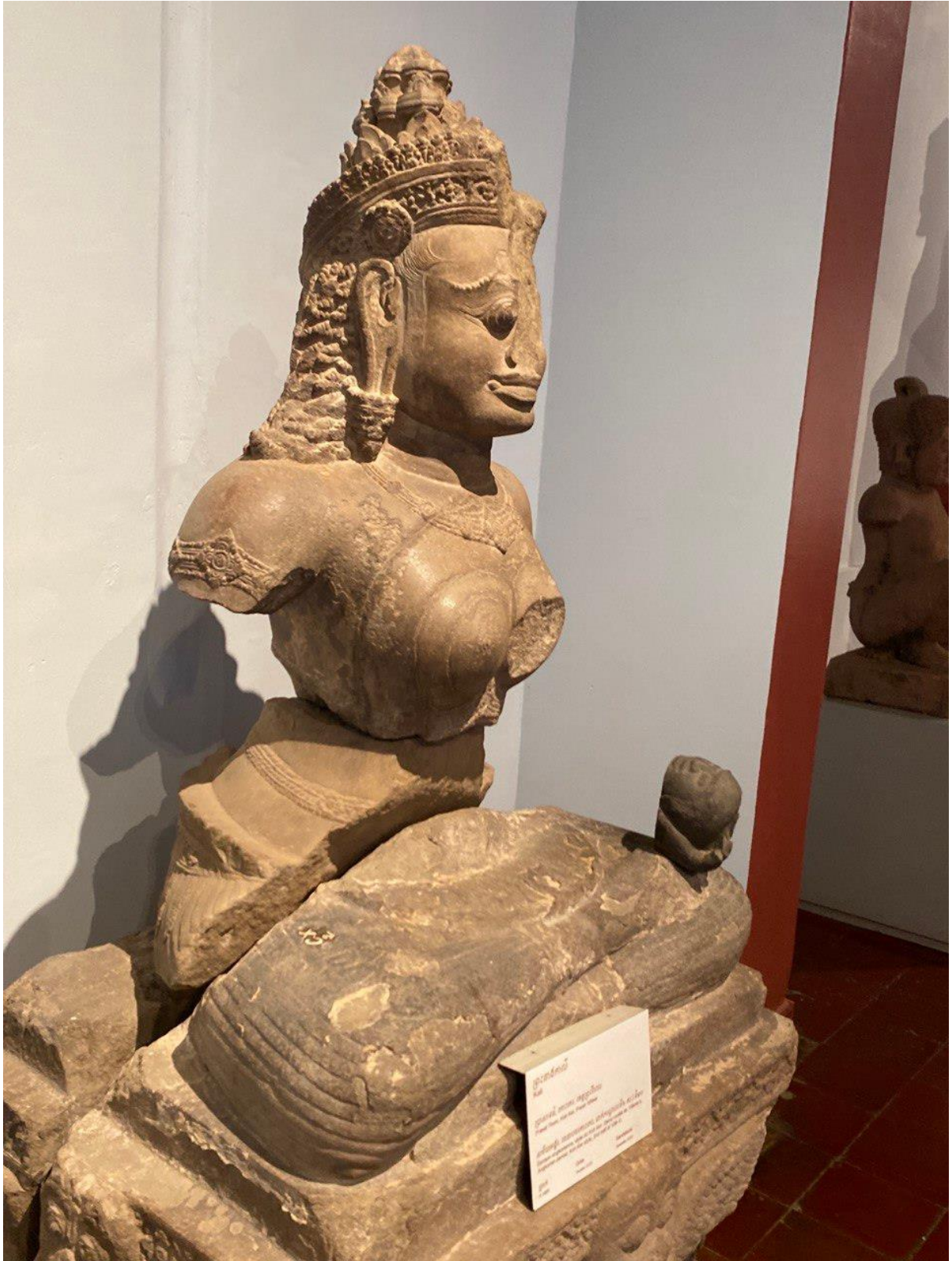
រូបលេខ៦៖ បដិមាព្រះនាងកាលី (មើលពីចំហៀងខាងស្តាំ)