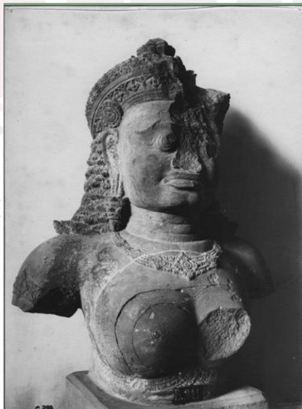
រូបលេខ២៖ បំណែកព្រះកាយមួយកំណាត់របស់បដិមាព្រះនាងកាលីនៅពេលយកមក តាំងបង្ហាញនៅក្នុងសារមន្ទីរជាតិក្នុងឆ្នាំ១៩២៣