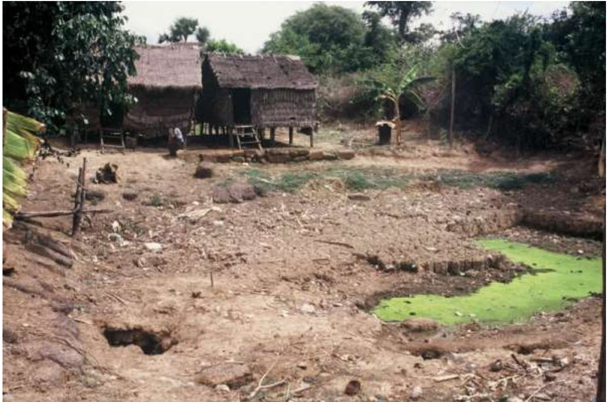
ស្រះទឹកមានរៀបចំបាយត្រៀម