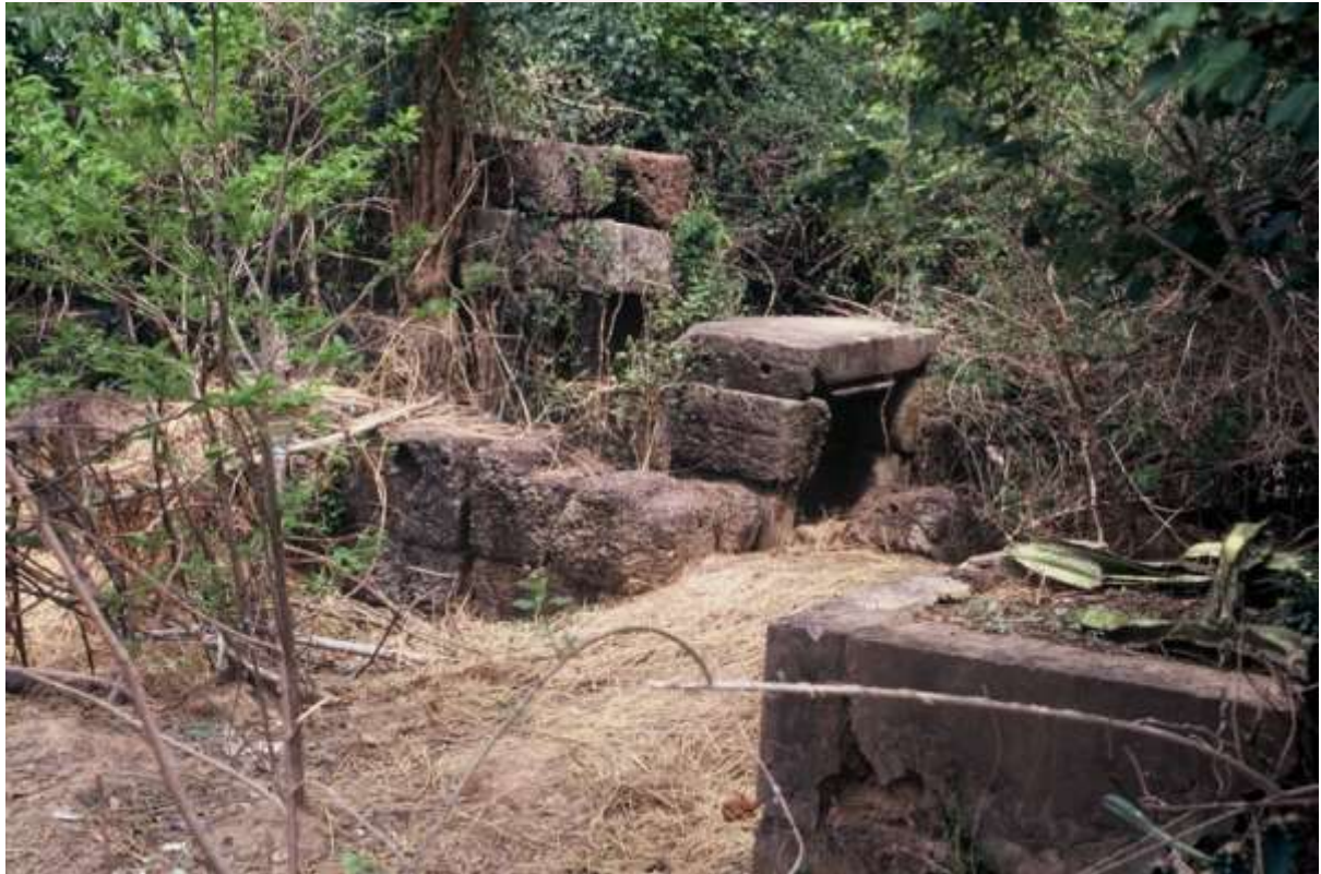
ប្រាសាទប្រាប់ទិស