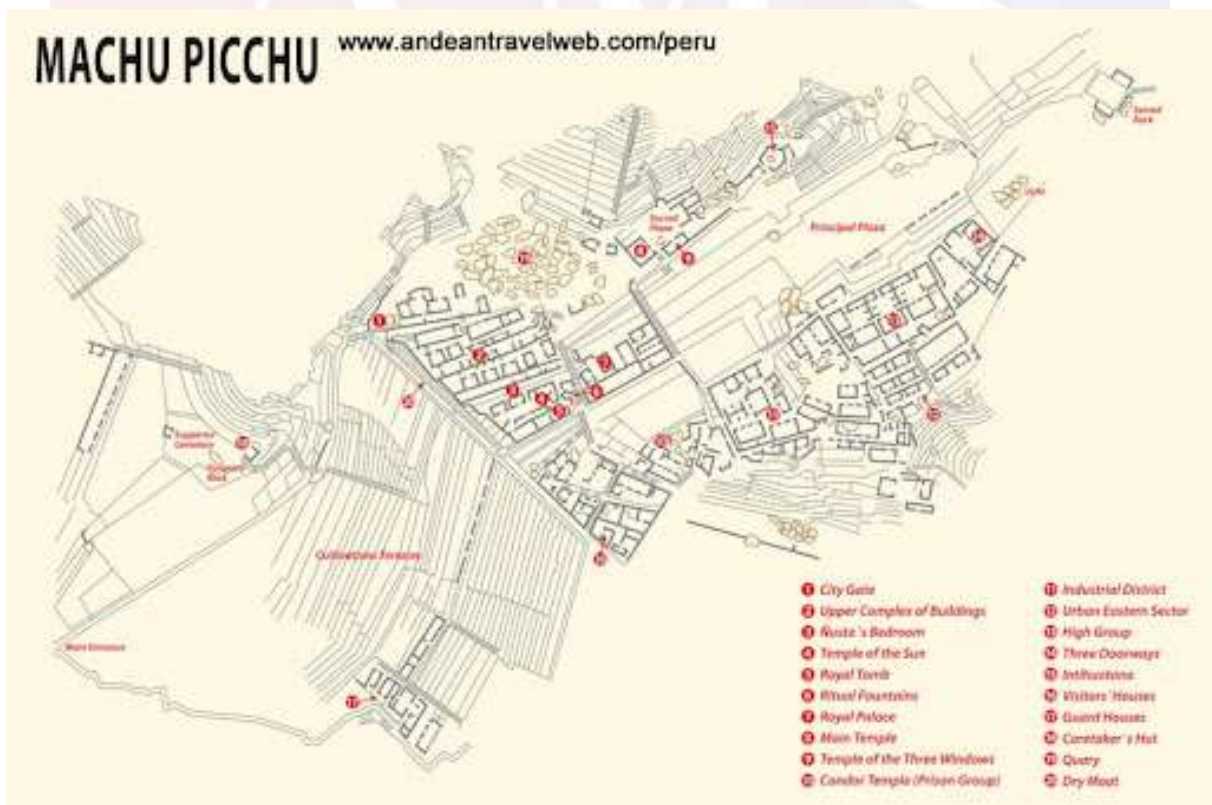
រូបលេខ ៣-២ ៖ ប្លង់នៃ ទីក្រុង Machu Picchu និង Cuzco