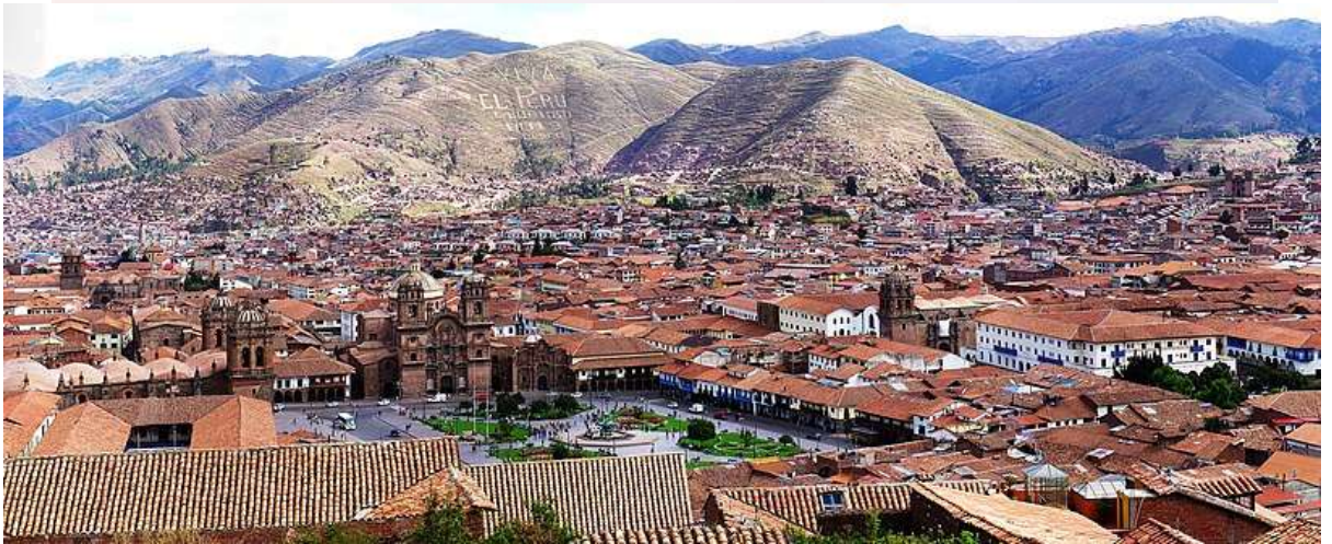
រូបលេខ ២-៣៖ ទីក្រុង Machu Picchu និង Cuzco