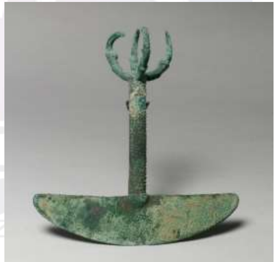
រូបលេខ ៥-៨ ៖ សិល្បៈនៃអរិយធម៌អ៊ីនកា