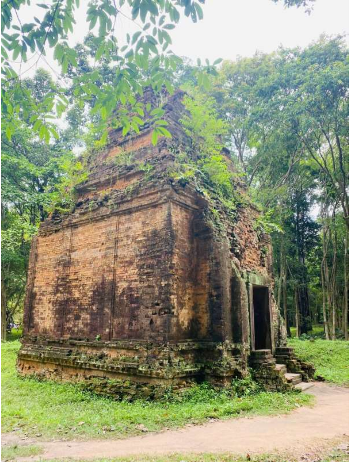
រូបលេខ៦៖ ប្រាសាទតម្កល់បដិមាព្រះហរិហរនៅសំបូរព្រៃគុក (ភ្នំប៉ម N10) មើលពីទិសឦសាន