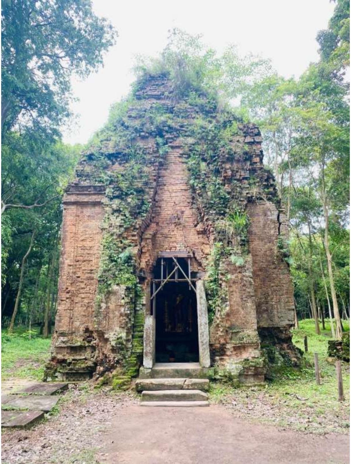
រូបលេខ៥៖ ប្រាសាទតម្កល់បដិមាព្រះហរិហរនៅសំបូរព្រៃគុក (តួប៉ម N10) មើលពីទិសខាងជើង