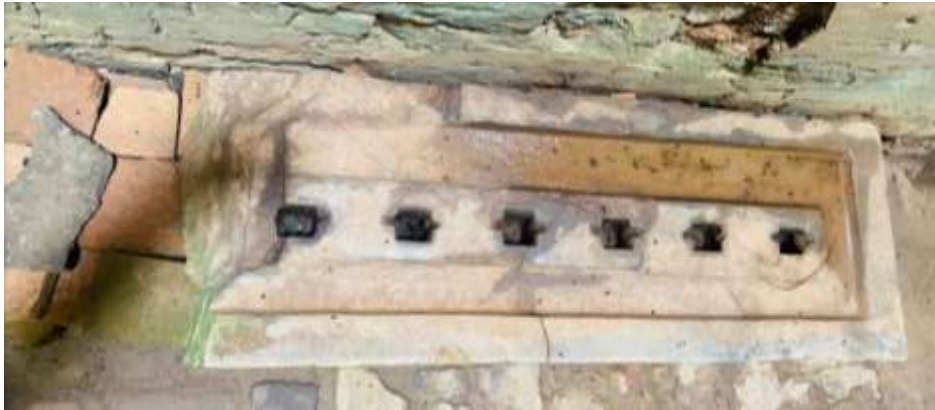
រូបលេខ៧៖ ថ្មទម្រង់ដោយ ឬទេពនព្វគ្រោះ រកឃើញនៅតួប៉ម N10