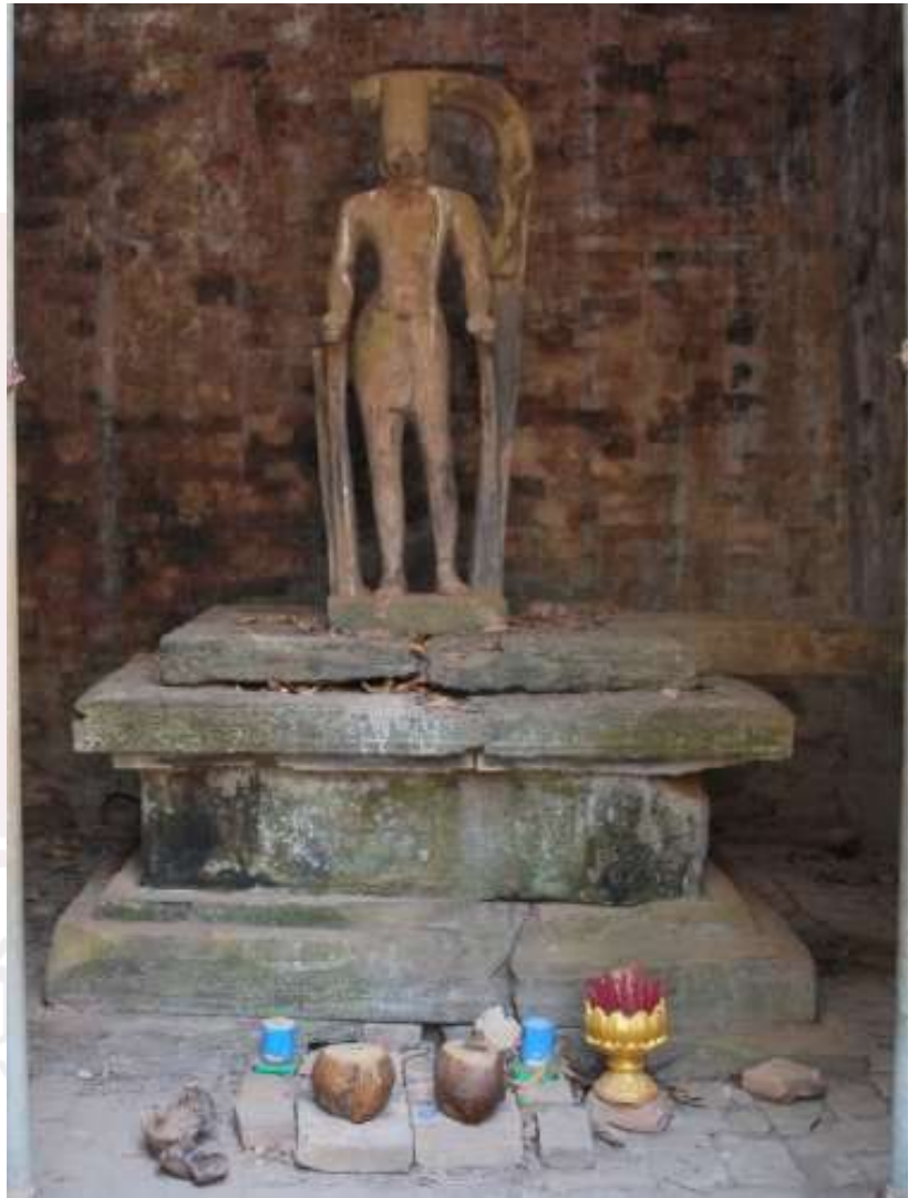
រូបលេខ១១៖ បដិមាព្រះហរិហរនៅតំបន់ប្រាសាទសំបូរព្រៃគុក (តួប៉មN10)