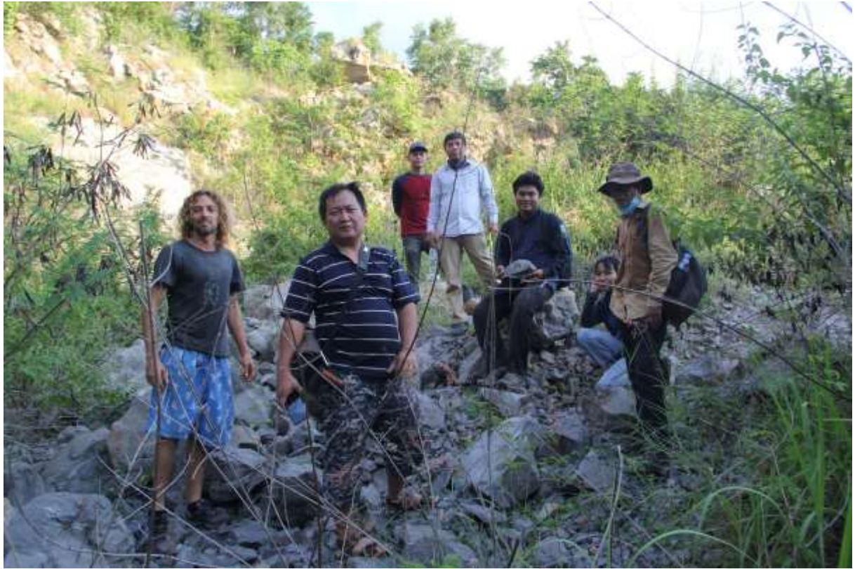
រូបលេខ១១