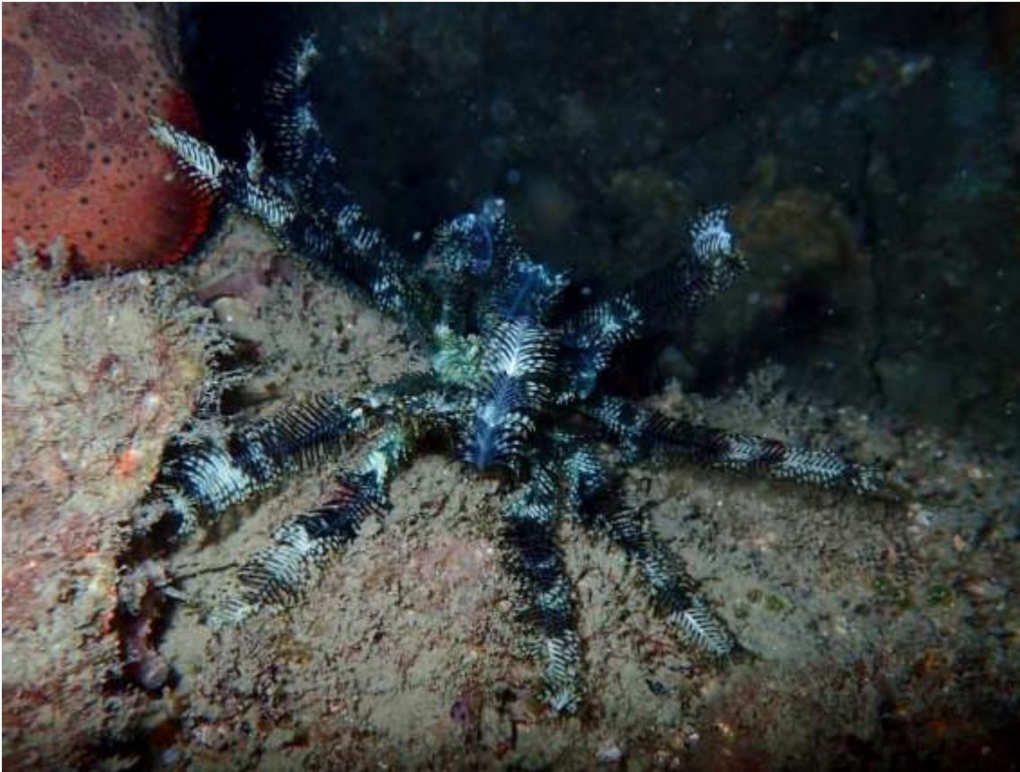
រូបលេខ៥ ប្រភេទមួយនៃសត្វត្រីណូអ៊ីត នៅសមុទ្រនៃប្រទេសកម្ពុជា