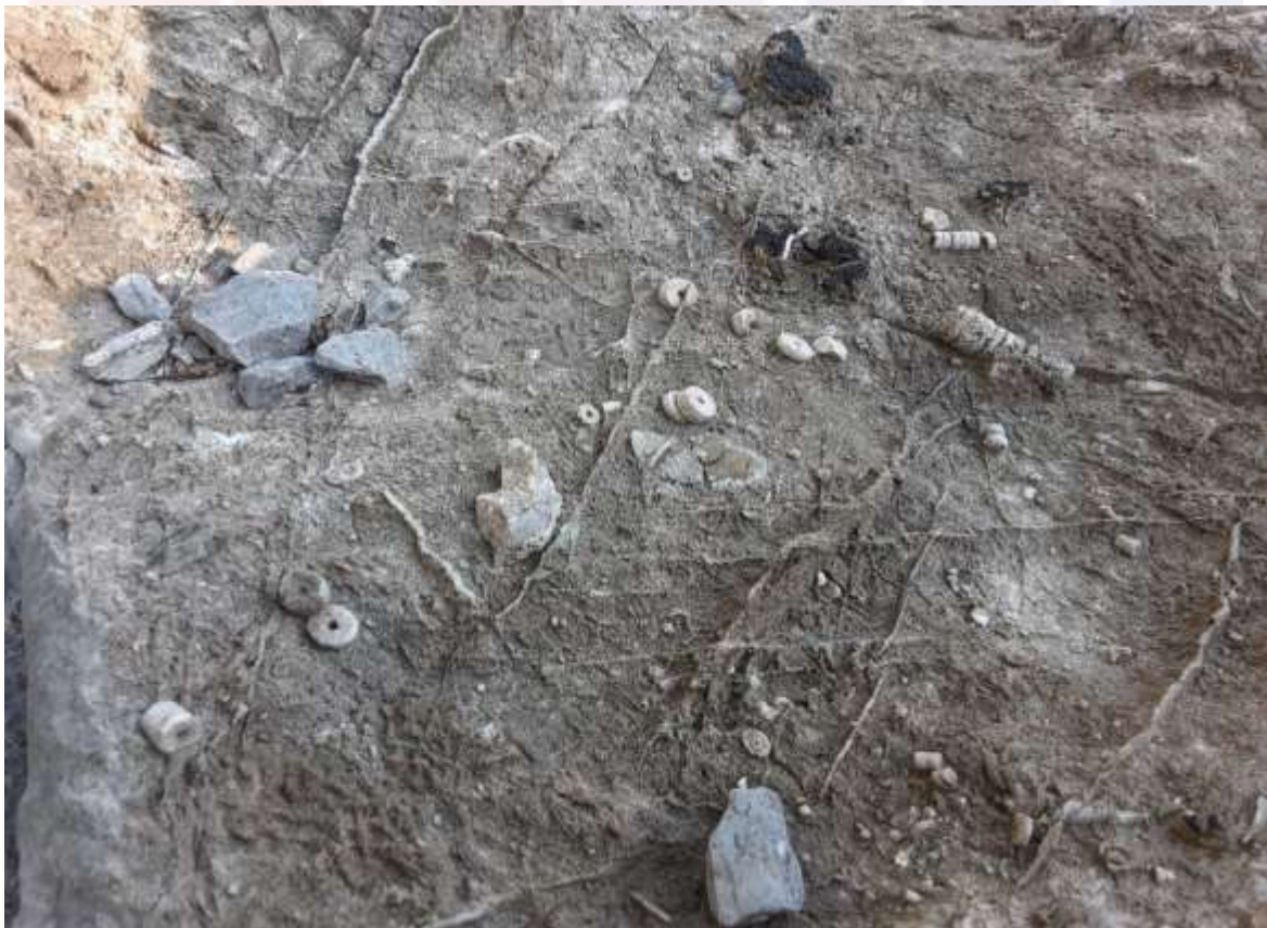
រូបលេខ៤ ពពួកគ្រីណូអ៊ីត