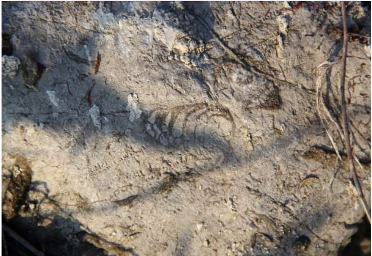
រូបលេខ១០