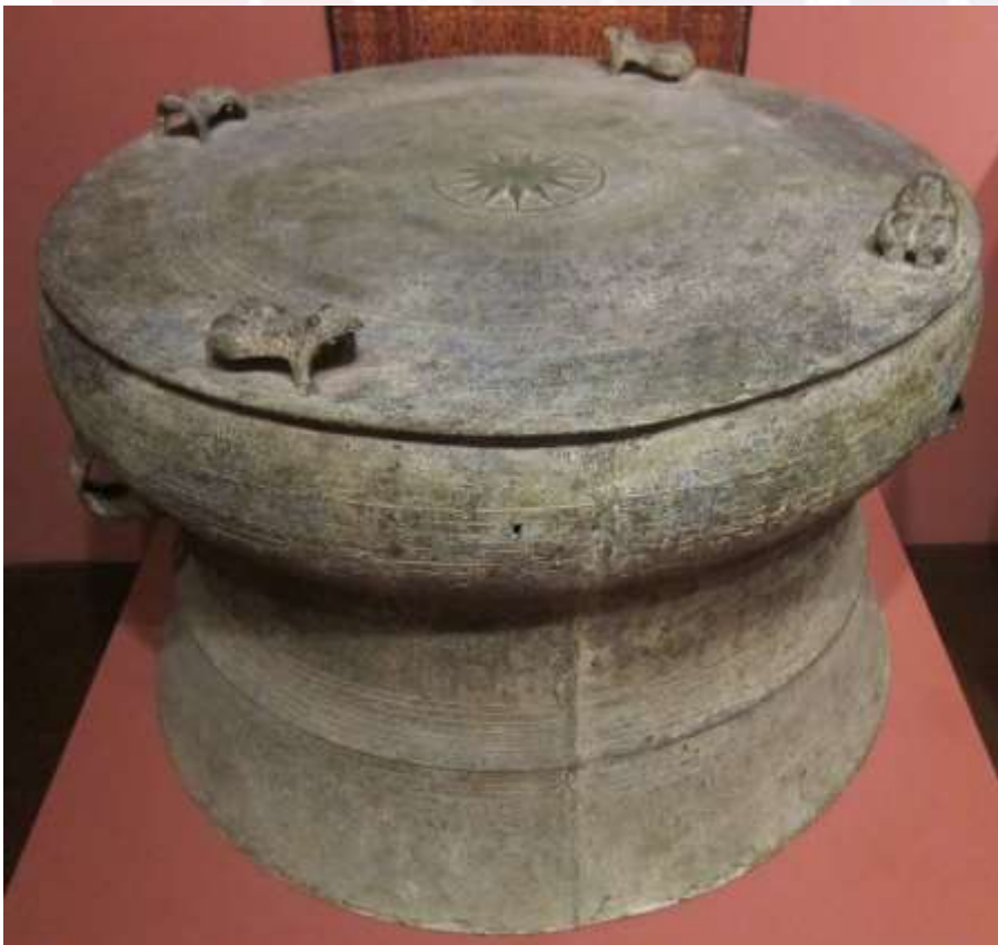
រូបលេខ៤៖ ស្ពាន់វិទ្ធីដុងស៊ីន