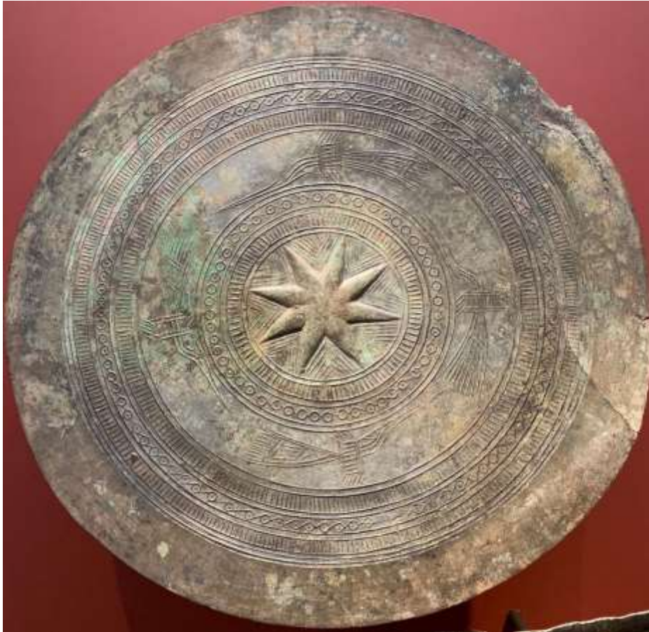
រូបលេខ៥៖ រូបផ្កាយនៅលើស្ពាន