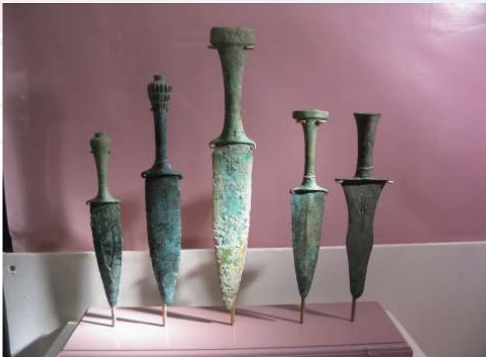
រូបលេខ២៖ ដាវសំរឹទ្ធក្នុងវប្បធម៌ដុនស៊ីន