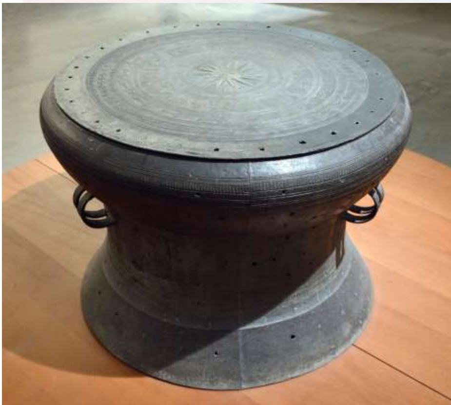
រូបលេខ៦៖ ស្ពានសំរិទ្ធដុងស៊ីន