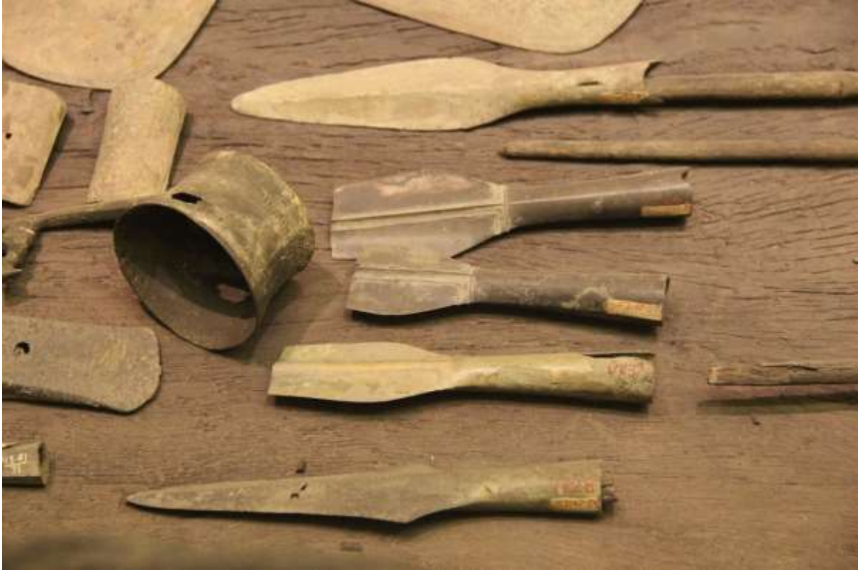
រូបលេខ៣ ៖ ផ្លែលំពែង