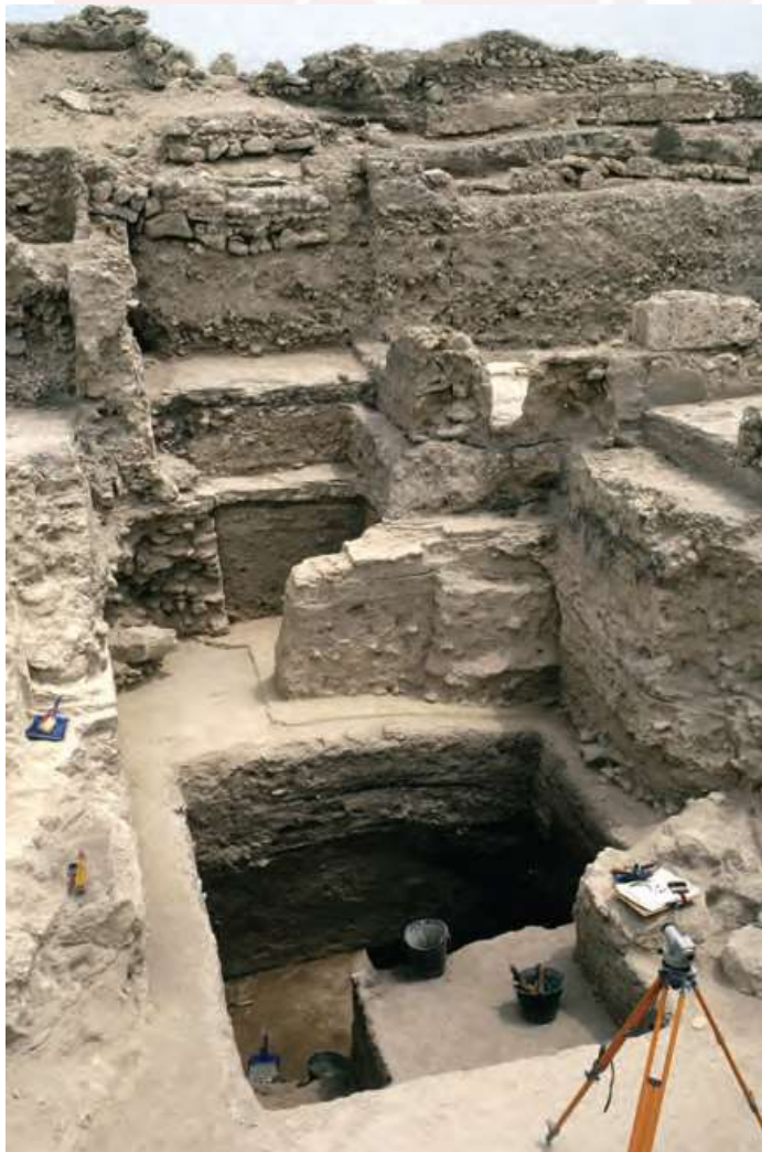
រូបលេខ៥ ៖ រូបថតវាលបញ្ចុះសព Bahrain ពីលើអាកាស រូបលេខ ៦៖ អំឡុងពេលកំណាយនៅ Dilmun Burial Mounds ក្នុងឆ្នាំ ២០១៦