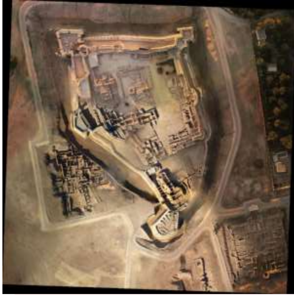
រូបលេខ៣-៤៖ រូបថតទីក្រុង Qal'at al-Bahrain ពីលើអាកាស