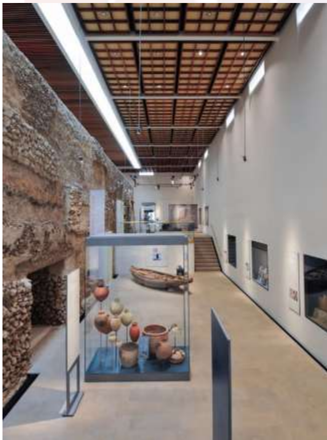
រូបលេខ ៨ ៖ សារមន្ទីរនៅក្បែរ Qal'at al- Bahrain