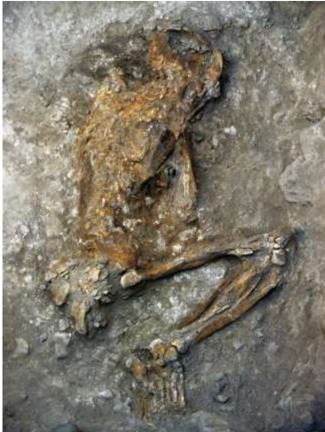
រូបលេខ ៧៖ គ្រោងផ្តិតដែលបានរកឃើញ