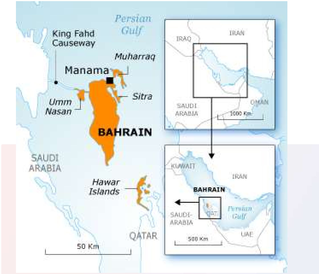
រូបលេខ១-២៖ ផែនទីនៃអរិយធម៌ឌីលម៉ុន និងទីក្រុង Qal'at al-Bahrain