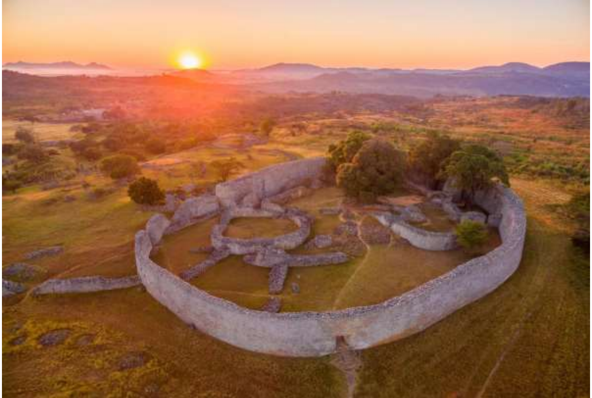
រូបលេខ៤ & ៥ ៖ តំបន់ទី ១ និងទី២