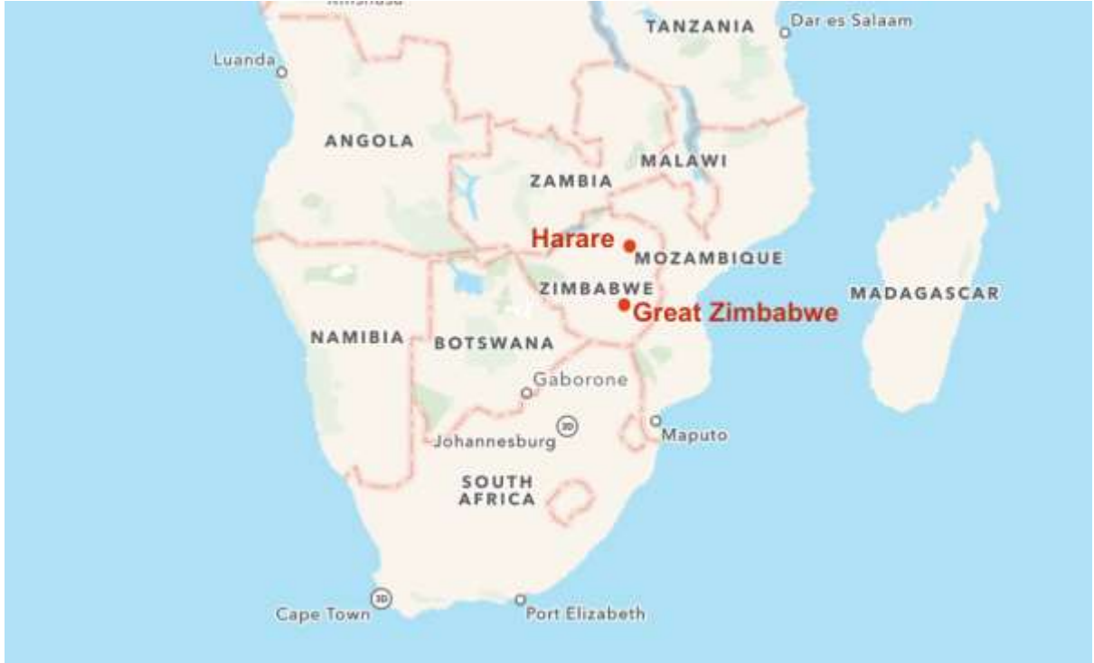
រូបលេខ១ ផែនទីទីក្រុងនៃប្រទេសហ្សីមបាវ៉េ