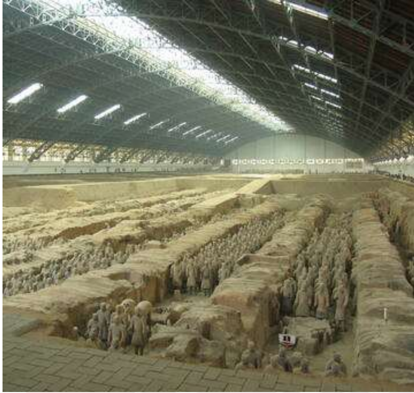
រូបលេខ៥៖ រូបសំណាក់ទាហាន ដីដែលរកឃើញក្នុងផ្ទះស្តេច