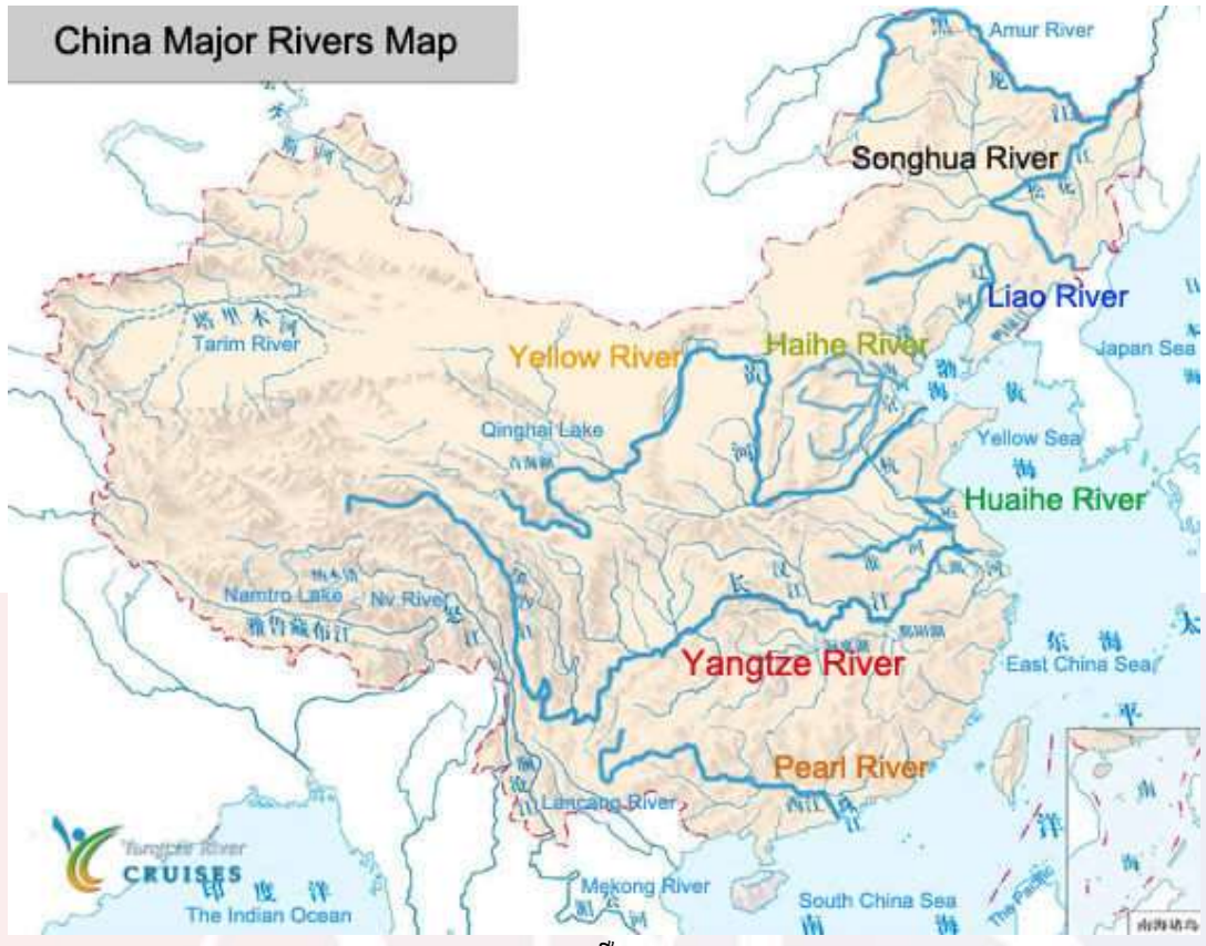
រូបលេខ១៖ ទន្លេ យ៉ាងទ្វីន និងទន្លេ Yangtze