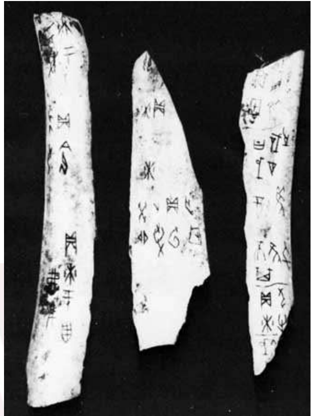
រូបលេខ៣៖ ផ្ទាំងសត្វរកឃើញនៅ Yinxu