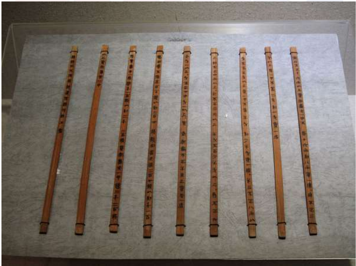
រូបលេខ៤៖ កំណត់ត្រាប្រាសាទ Qin Bamboo