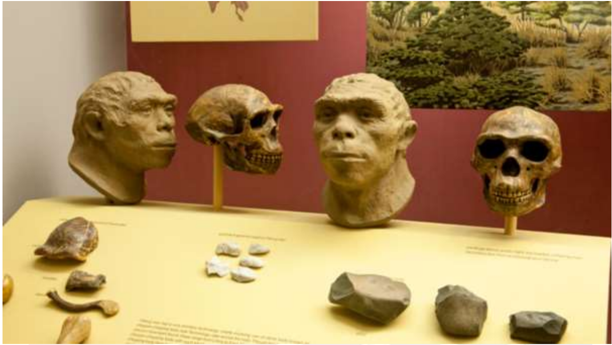
រូបលេខ៩៖ ផូស៊ីល Peking Man