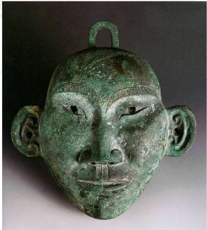
រូបលេខ៨៖ រូបក្បាលមនុស្សធ្វើពីសំរិទ្ធ