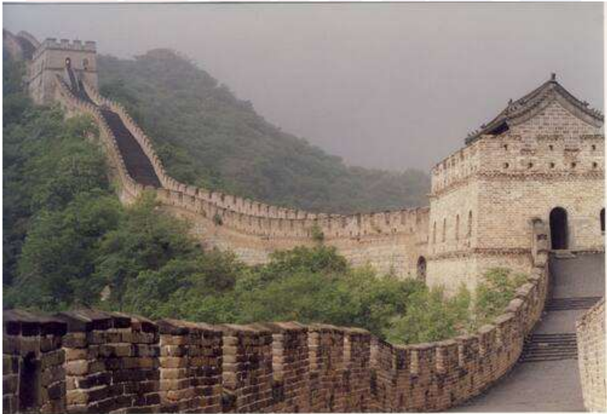
រូបលេខ៦៖ មហាកំពែង