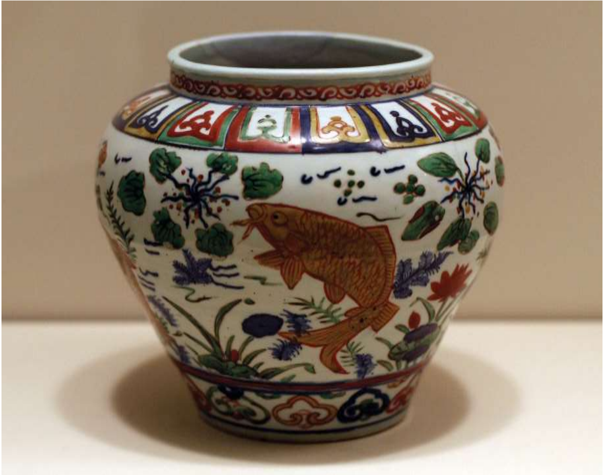
រូបលេខ៧៖ Porcelain ក្នុងរាជ្ជកាល Ming