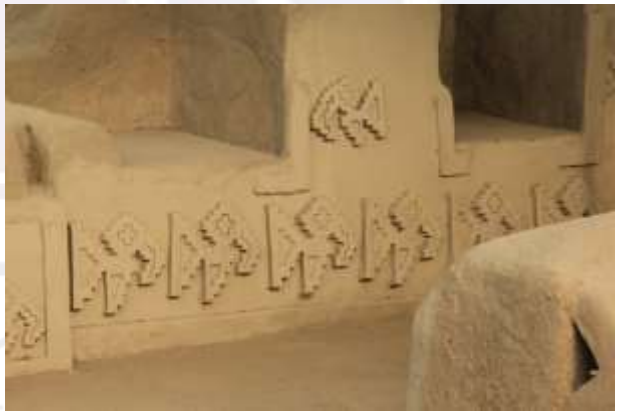
រូបលេខ៣-៥ ៖ ចម្លាក់ក្បាច់រូបសត្វនៅតាមជញ្ជាំងសំណង់នៃទីក្រុងចាន់ ចាន់