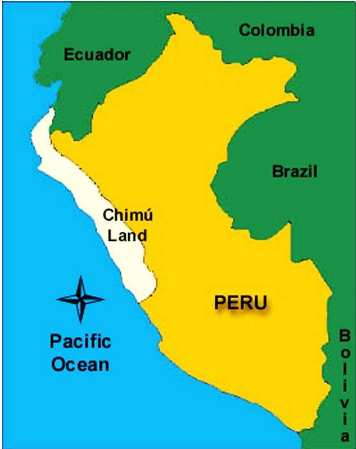
រូបលេខ១៖ ផែនទីនៃអរិយធម៌ឈីមូ