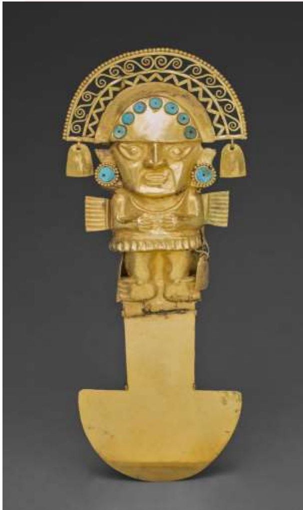
រូបលេខ៦-៨ ៖ គ្រឿងលោហៈធាតុ និង កុលាលក្ខណ៍រូបសត្វ