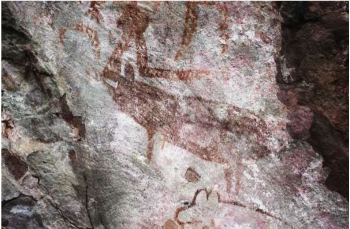
រូបលេខ៥៖ រូបគំនូរលាបពណ៌មានសណ្ឋានជាសត្វជ្រូក និងរូបលាបពណ៌ផ្សេងៗទៀត