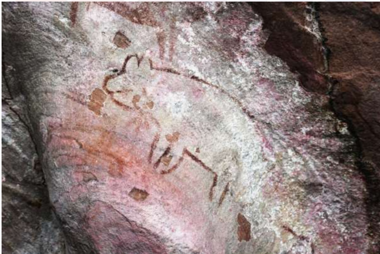
រូបលេខ៦៖ រូបគំនូរលាបពណ៌មានសណ្ឋានជាសត្វជ្រូក