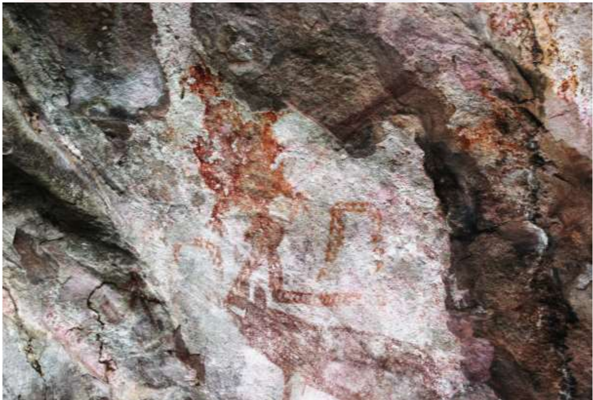
រូបលេខ៤៖ រូបគំនូរលាបពណ៌មានសណ្ឋានជាសត្វជ្រូក និងរូបលាបពណ៌ផ្សេងៗទៀត