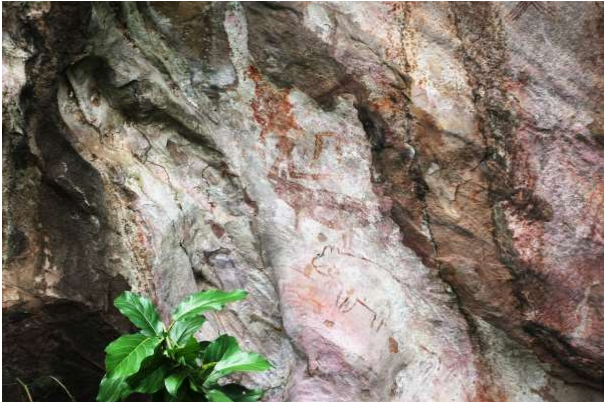
រូបលេខ៣៖ រូបគំនូរលាបពណ៌មានសណ្ឋានជាសត្វជ្រូក