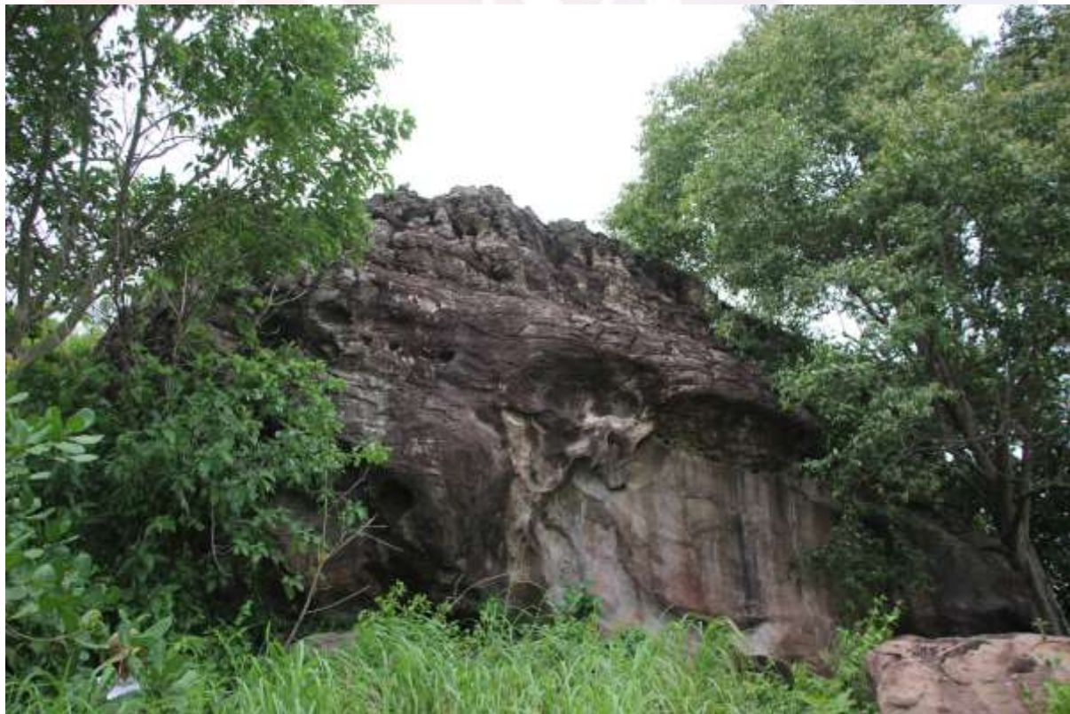
រូបលេខ២៖ ពើងជ្រូក