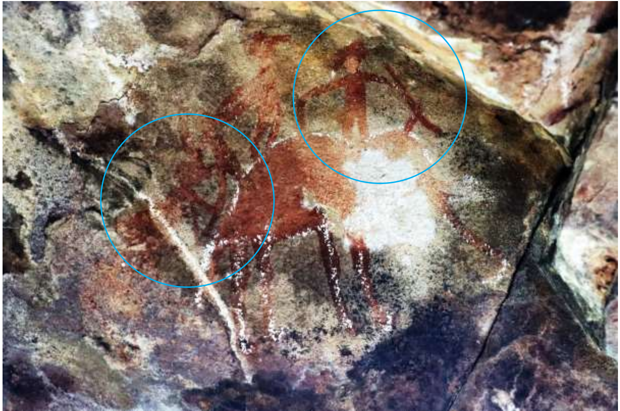
រូបលេខ១៤