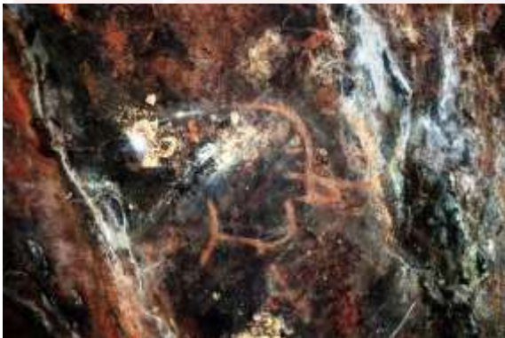
រូបលេខ១៥