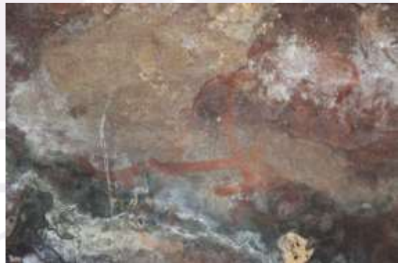
រូបលេខ១៦