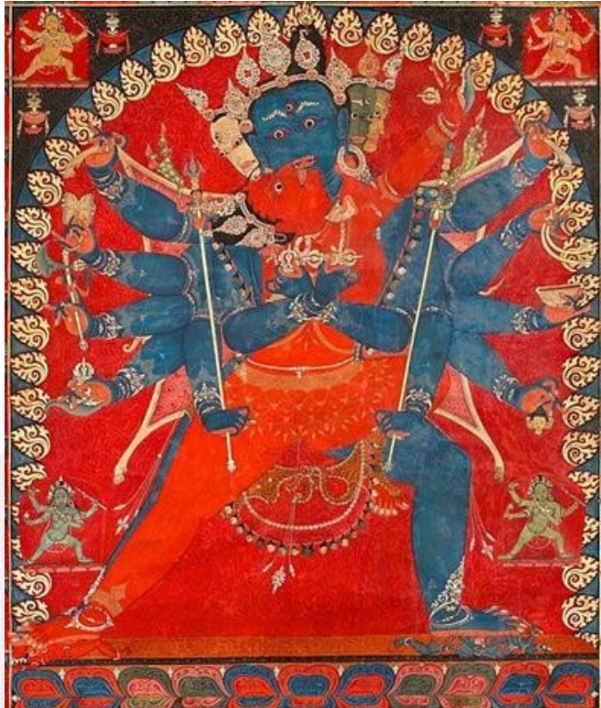
រូបលេខ១-២៖ ចម្លាក់ចក្រសំរវរកឃើញនៅតំបន់ Bihar ប្រទេសឥណ្ឌា និងរូបគំនូរចក្រសំរវរកឃើញនៅតំបន់ទីបេ