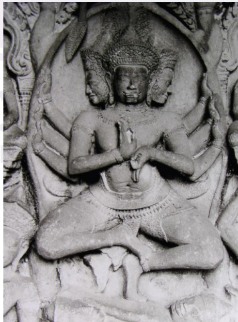
រូបលេខ៣៖ ចម្លាក់ចក្រសំរវនៅប្រាសាទភិមាយ រាំអមដោយយោគិនី និងវិទ្យារាជ