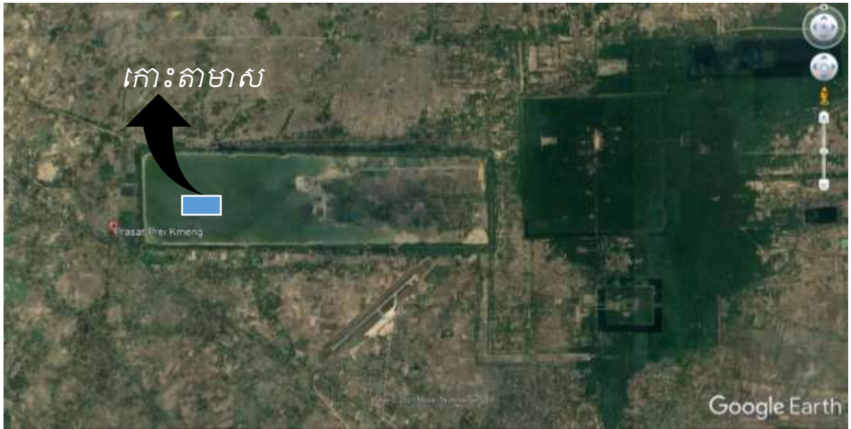
រូបលេខ៤៖ ផែនទីបង្ហាញពីទីតាំងកោះតាមាស ដែលនៅក្បែរស្ថានីយ៍ព្រៃភ្នំដែរ

កន្លែងបញ្ជះសពសម័យអង្គរមួយ គឺនៅប្រាសាទទ្រមូង ១១ ដែលប្រាសាទរបស់មន្ទីរពេទ្យ នឹងមួយទៀតនៅពើងត្បាល់លើភ្នំគូលែន។ ១២