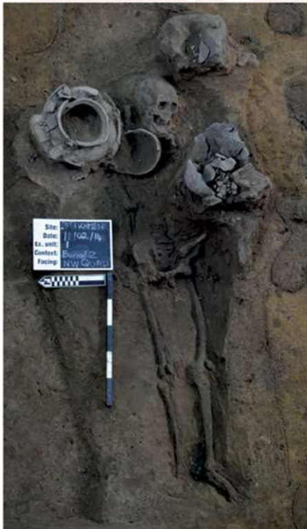
រូបលេខ២-៣៖ ផ្លូវ ដែលមានគ្រោងឆ្អឹង និងវត្ថុសំណែន ប្រភព៖ MAFKATA