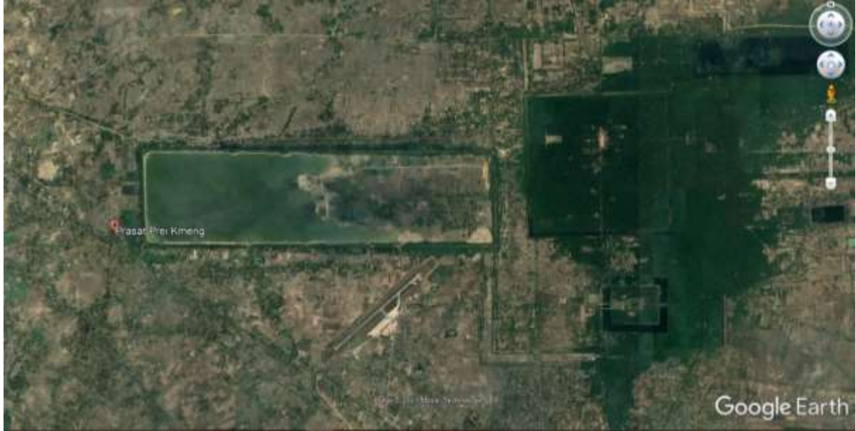
រូបលេខ១៖ ផែនទីបង្ហាញពីទីតាំងស្ថានីយ៍ព្រៃក្មេង