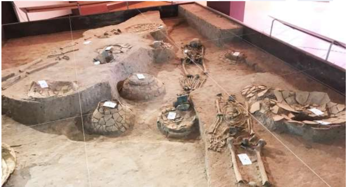
រូបលេខ៥៖ ការដាក់តាំងវត្ថុសិល្បៈ និងគ្រោងឆ្អឹងដែលរកឃើញនៅសារ មន្ទីរព្រះសីហនុរាជ្យក្នុងខេត្តសៀមរាប