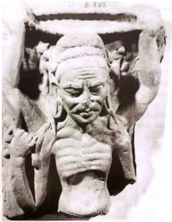
រូបលេខ៤៖ ចម្លាក់ព្រះតសូរក្នុងទម្រង់ជាតសីធ្វើអំពីដីដុតមានព្រះកាយស្នមស្តាំង រកឃើញនៅឥណ្ឌា