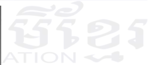
រូបលេខ៣ ៖ ពុទ្ធបដិមាព្រះសង្គមក្នុងសិល្បៈគន្ធារ នៅរវាងសតវត្សទី៣ ដល់ទី៥ នៃគ្រិស្តសករាជ