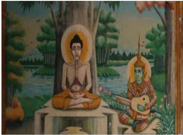
រូបលេខ១ ៖ គំនូរព្រះពុទ្ធអង្គជ្រុងធ្វើទុក្ខកិរិយា នៅវត្តព្រែកសំរោង ខេត្តក្រចេះ