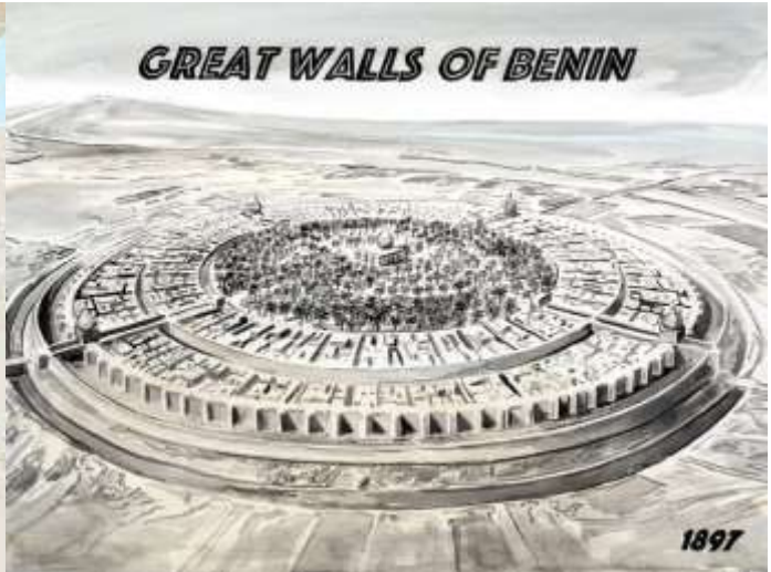
រូបលេខ១-២៖ ផែនទីនៃអាណាចក្របេនិន និងរូបកំពែងនៃទីក្រុងបេនិន