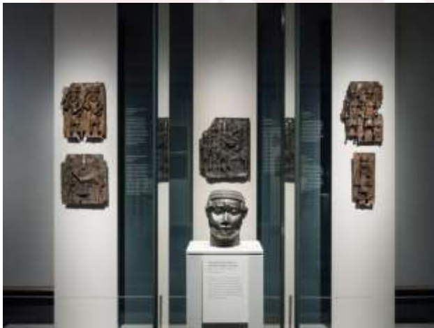
រូបលេខ៣-៤៖ វត្ថុសិល្បៈក្នុងអរិយធម៌បេនិន ត្រូវបានដាក់តាំងបង្ហាញនៅសារមន្ទីរ ប៊ូស្តុង