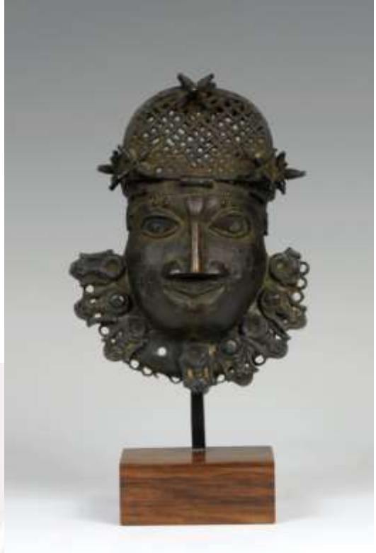
រូបលេខ៦ & ៧៖ វត្ថុសិល្បៈក្នុងអរិយធម៌បេនិនអំពីប្រាក់