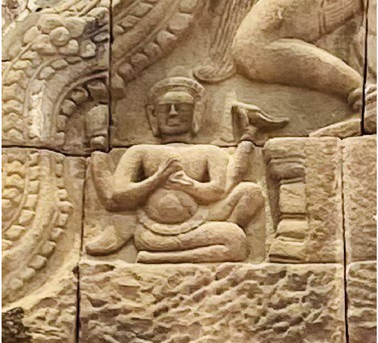
រូបលេខ៤៖ លម្អិតចម្លាក់អាយុធម្មបុរុស ភេទប្រុស "ចក្របុរុស" ឬ "ស័ន្ទបុរុស" ធ្លាក់លើហោជាងខាងលិចប្រាសាទ យាយពៅ