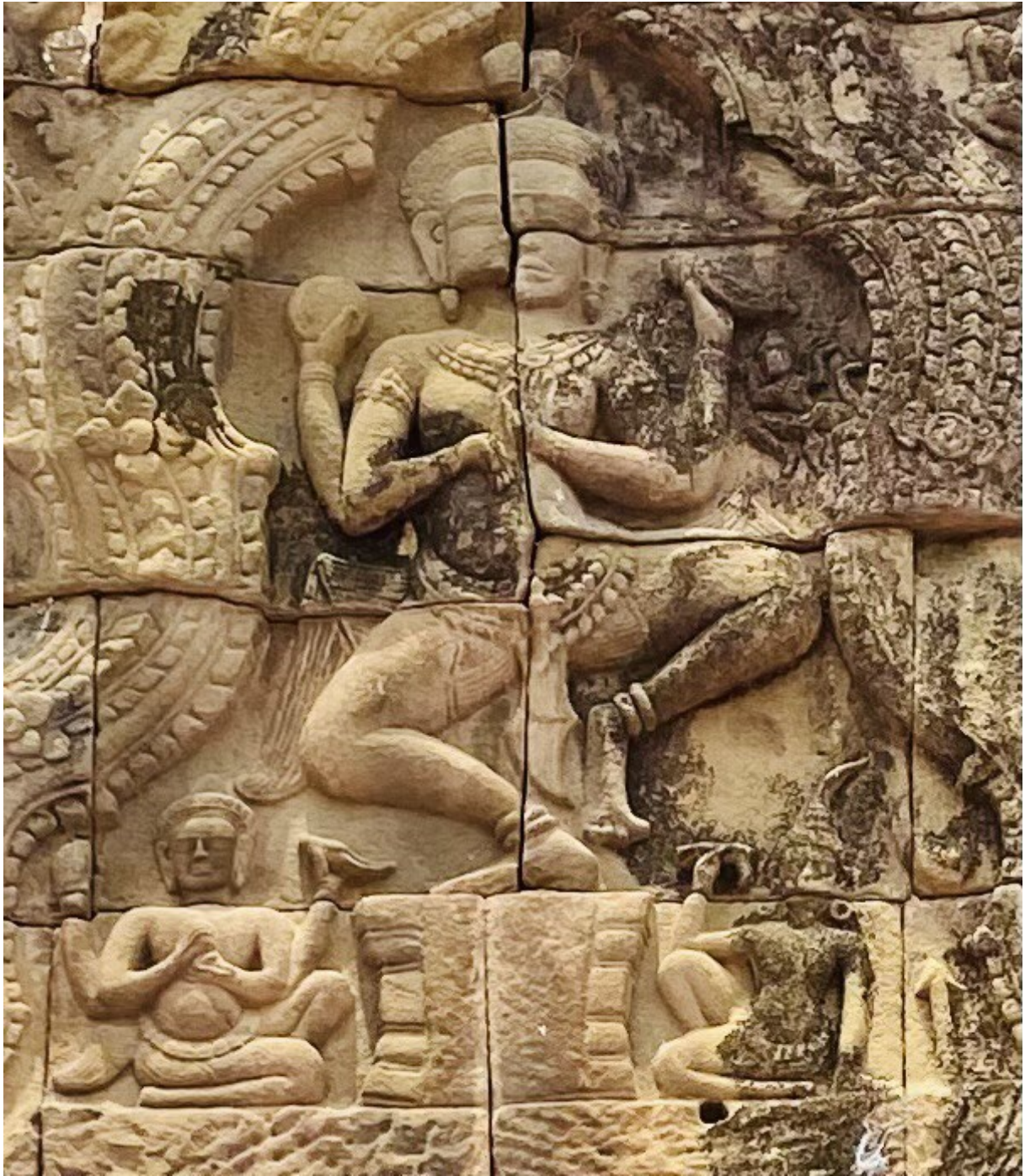
រូបលេខ៣៖ លម្អិតចម្លាក់ព្រះវិស្ណុរាំព្រះហស្ត៤ អមសងខាងដោយចម្លាក់អាយុធម្មបុរស ធ្លាក់នៅលើហោជាងខាងលិចប្រាសាទយាយពៅ