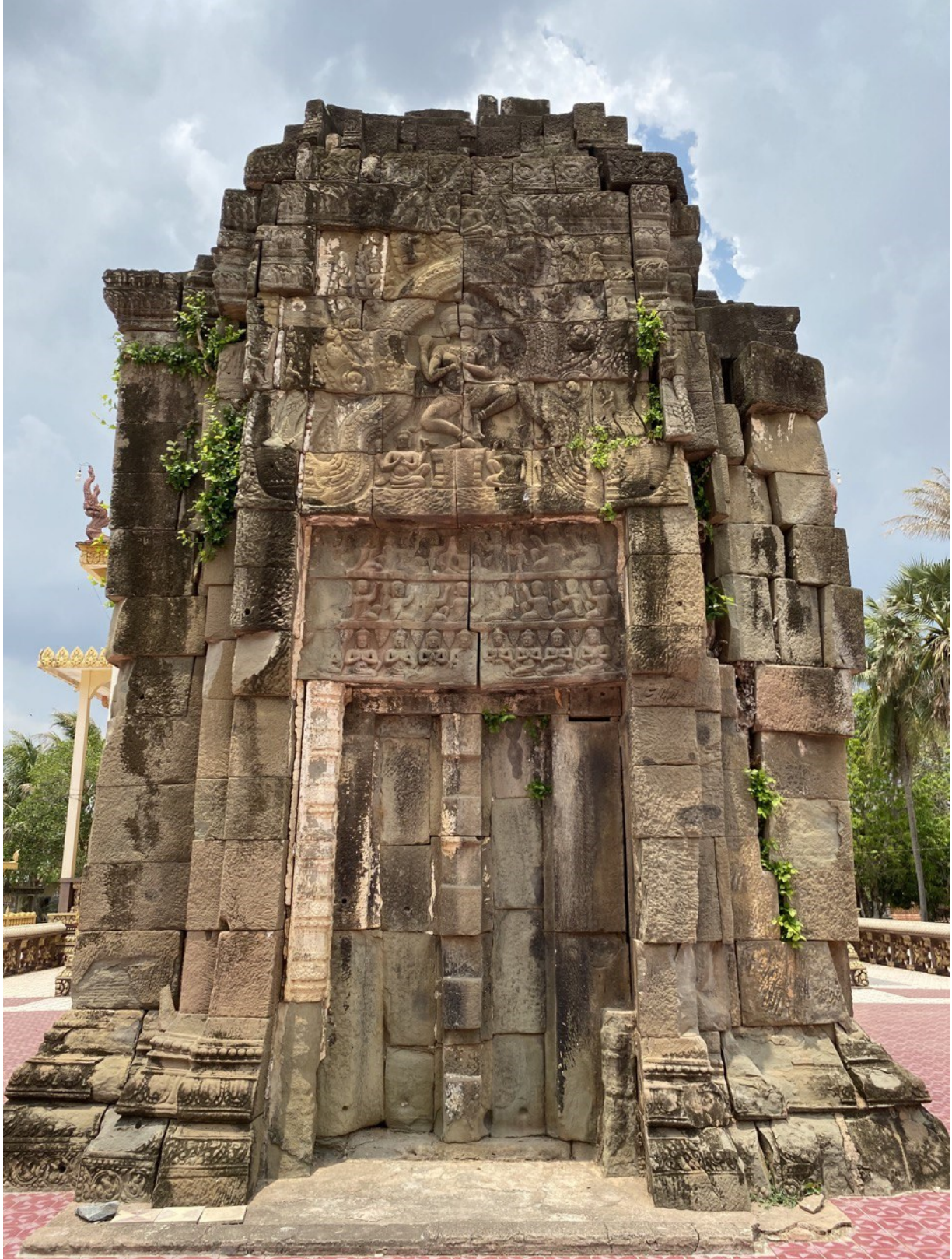
រូបលេខ២៖ ប្រាសាទយាយពៅ ខេត្តតាកែវ ចុងស.វ.ទី១២