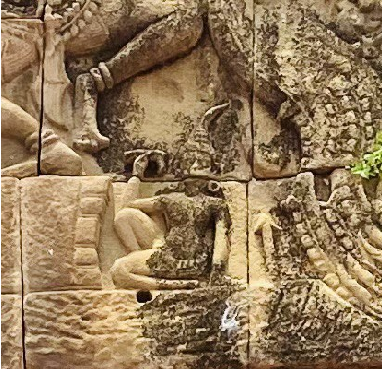
រូបលេខ៥៖ លម្អិតចម្លាក់អាយុធិបុរុស ភេទស្រី ទំនងជា "គទាទេវី" ធ្លាក់លើហោជាងខាងលិចប្រាសាទយាយពៅ