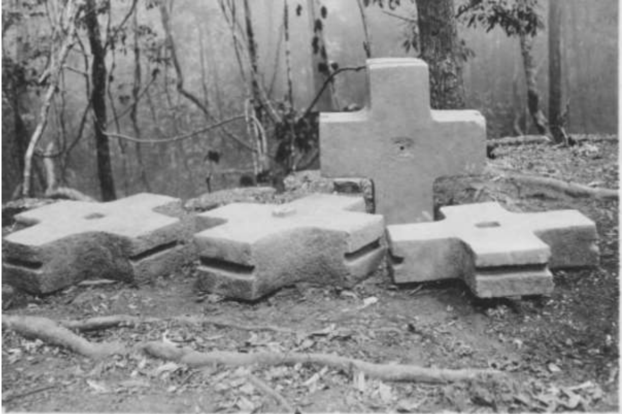
រូបលេខ៥៖ ថ្មបញ្ចុះក្រោមគ្រឹះប្រាសាទរកឃើញនៅប្រាសាទអារាមរោងចិន ស.វ.ទី៩