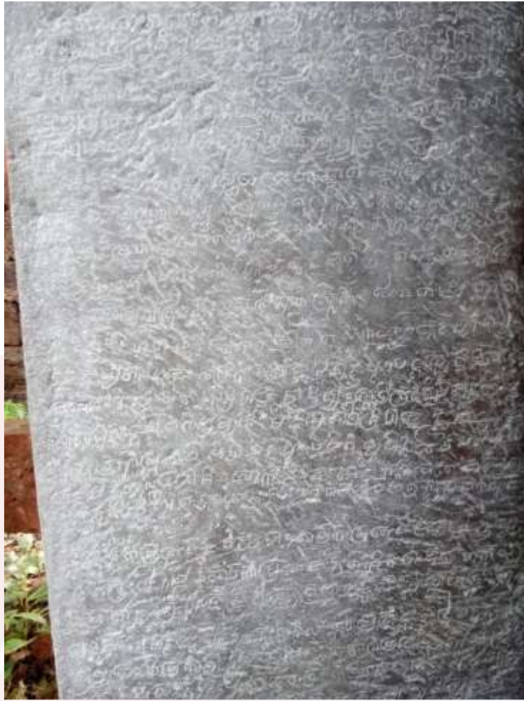
រូបលេខ៤៖ ក្រដាសផ្កាមសិលាចារឹកបុគ្គល K.826 ខេត្តសៀមរាប (ផ្ដិតដោយ៖ កំ វណ្ណារ៉ា)