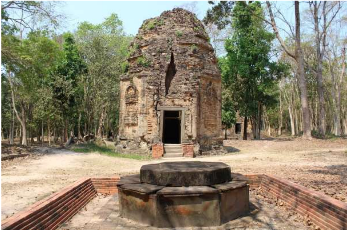
រូបលេខ៧៖ ជើងទម្រង់ប្រាំបីជ្រុងដាក់នៅខាងមុខប្រាសាទរាងប្រាំបីជ្រុង នៅក្រុមប្រាសាទសំបូរឬក្រុមខាងជើង តំបន់សំបូរព្រៃគុក ភូមិ N7