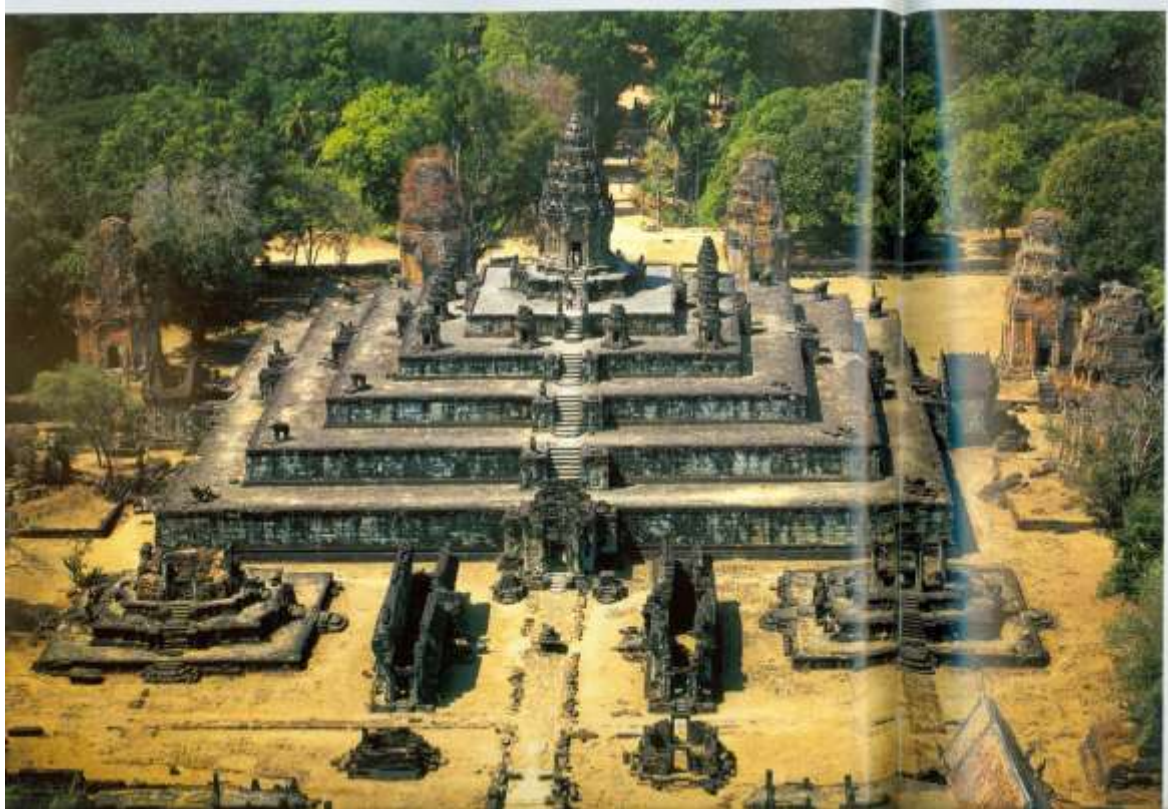
រូបលេខ៣៖ ប្រាសាទបាគង