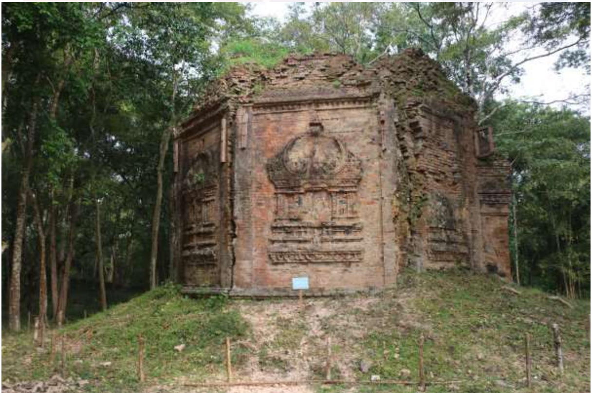
រូបលេខ៦៖ ប្រាសាទរាងប្រាំបីជ្រុងនៅក្រុមប្រាសាទយាយព័ន្ធ សំបូរព្រៃគុក ភ្នំប៉ែន S10