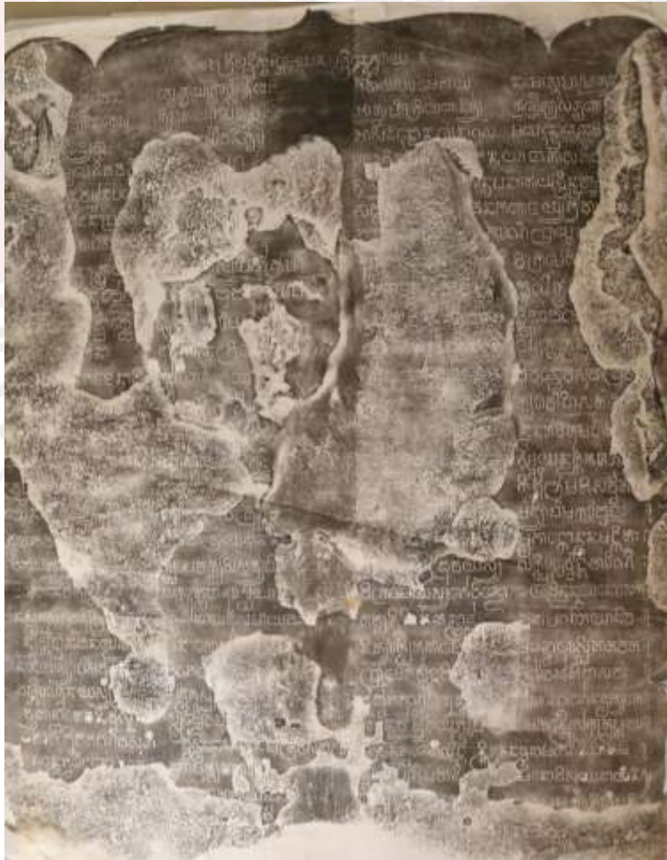
រូបលេខ១៖ ក្រដាសផ្តាមសិលាចារឹកបាគង K.826 ខេត្តសៀមរាប (ផ្តិតដោយ៖ កំ វណ្ណារ៉ា)

1982, 'A unique Astamurti image from Mandhal', Proceedings of the Indian History Congress , Vol 43, pp. 786-789