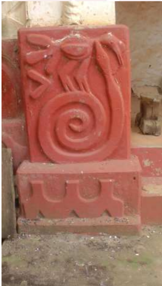
រូបលេខ៣៥៖ សំណង់អាគារនៃអរិយធម៌អាសានតេ