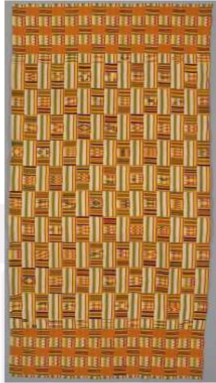
រូបលេខ៥៦ & ៧ ៖ វត្ថុអំពីមាស និងក្រណាត់នៃអរិយធម៌អាសានតេ