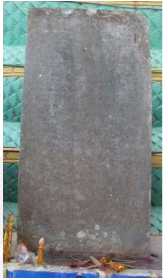
រូបលេខ៦-៧៖ ទីតាំងទីបួន និងសិលាចារឹកមួយផ្ទាំងចារឹកនៅស.វ.ទី១០