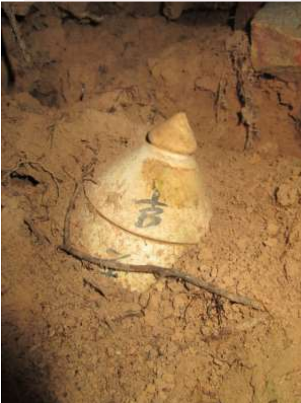
រូបលេខ៨៖ កុលាលភាជន៍ដាក់ផ្លឹង រកឃើញនៅតាមជម្រាលភ្នំ នៃទីតាំងទីបី