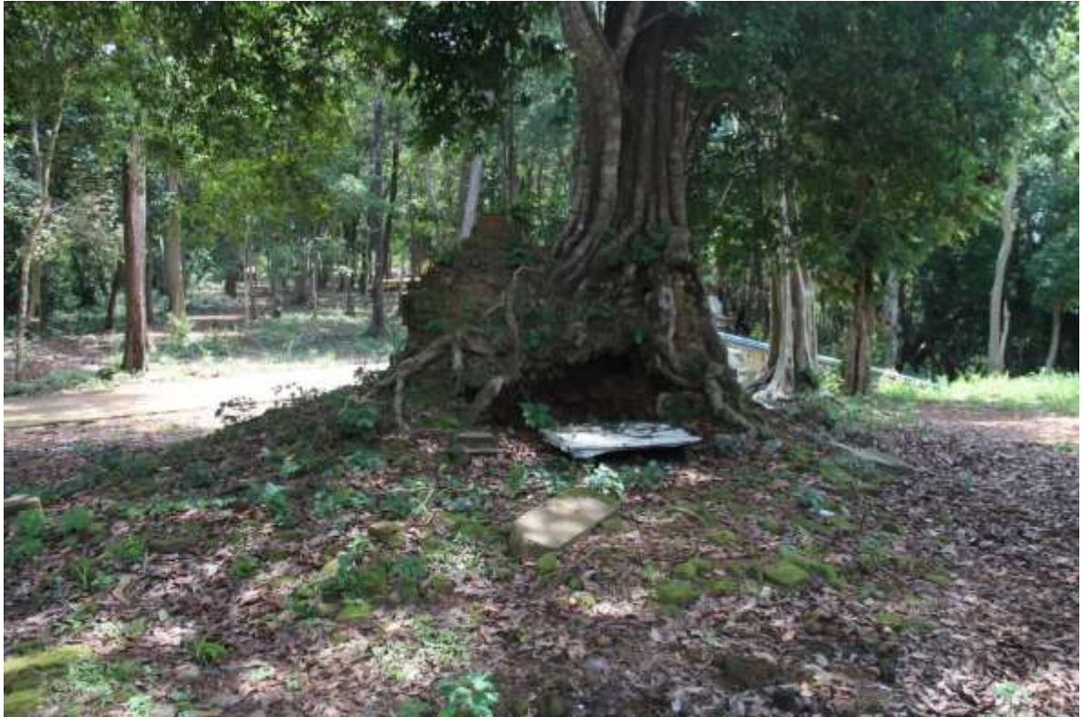
រូបលេខ៤៖ ប្រាសាទនៅសល់រូបរាងនៅទីតាំងទីបី (តួប៉មផ្នែកខាងត្បូង)