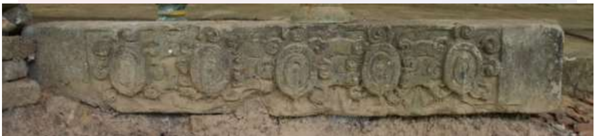
រូបលេខ៥៖ ផ្តែរទ្វារដើមរចនាបថព្រៃក្មេង ស.វ.ទី៧ រកឃើញនៅទីតាំងទីបី