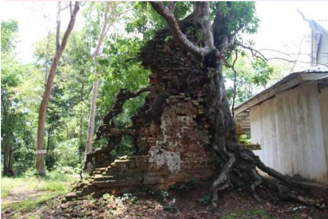
រូបលេខ៣៖ ប្រាសាទនៅសល់រូបរាងនៅទីតាំងទីបី (ភ្នំប៉ែកណ្តាល)