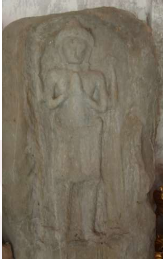
រូបលេខ១-២៖ ថ្មគោលមានចម្លាក់រូបទេពព្រហ្មញ្ញសាសនាម្ខាង ទេពព្រះពុទ្ធសាសនាម្ខាង