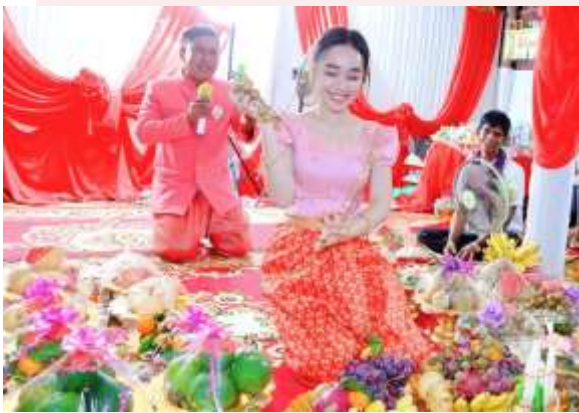
រូបលេខ៤ អ្នកចម្រៀងច្រៀងរាប់ផ្ទៃឈើ ទាំង៣៦ មុខជូនលោកមេបាខាងស្រី