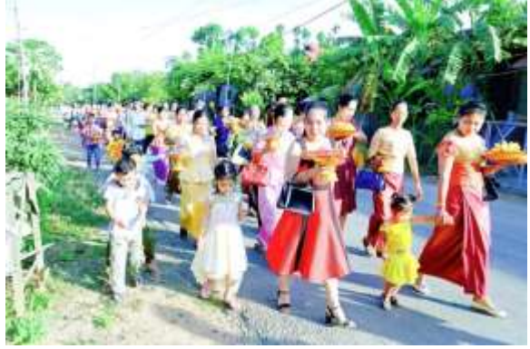
រូបលេខ៣ ភ្ញៀវកិត្តិយសចូលរួមហែជំនូន