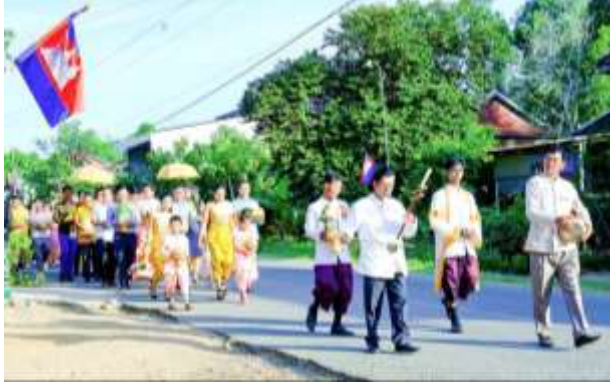
រូបលេខ២ ពិធីហែជំនូនចូលរោងជ័យ