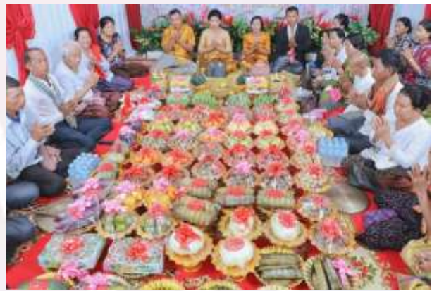
រូបលេខ៥ កិច្ចសែនព្រេនផ្ទៃឈើ និងក៏ស្តុការ បណ្តាការនានាជូនដីដូនដីតា