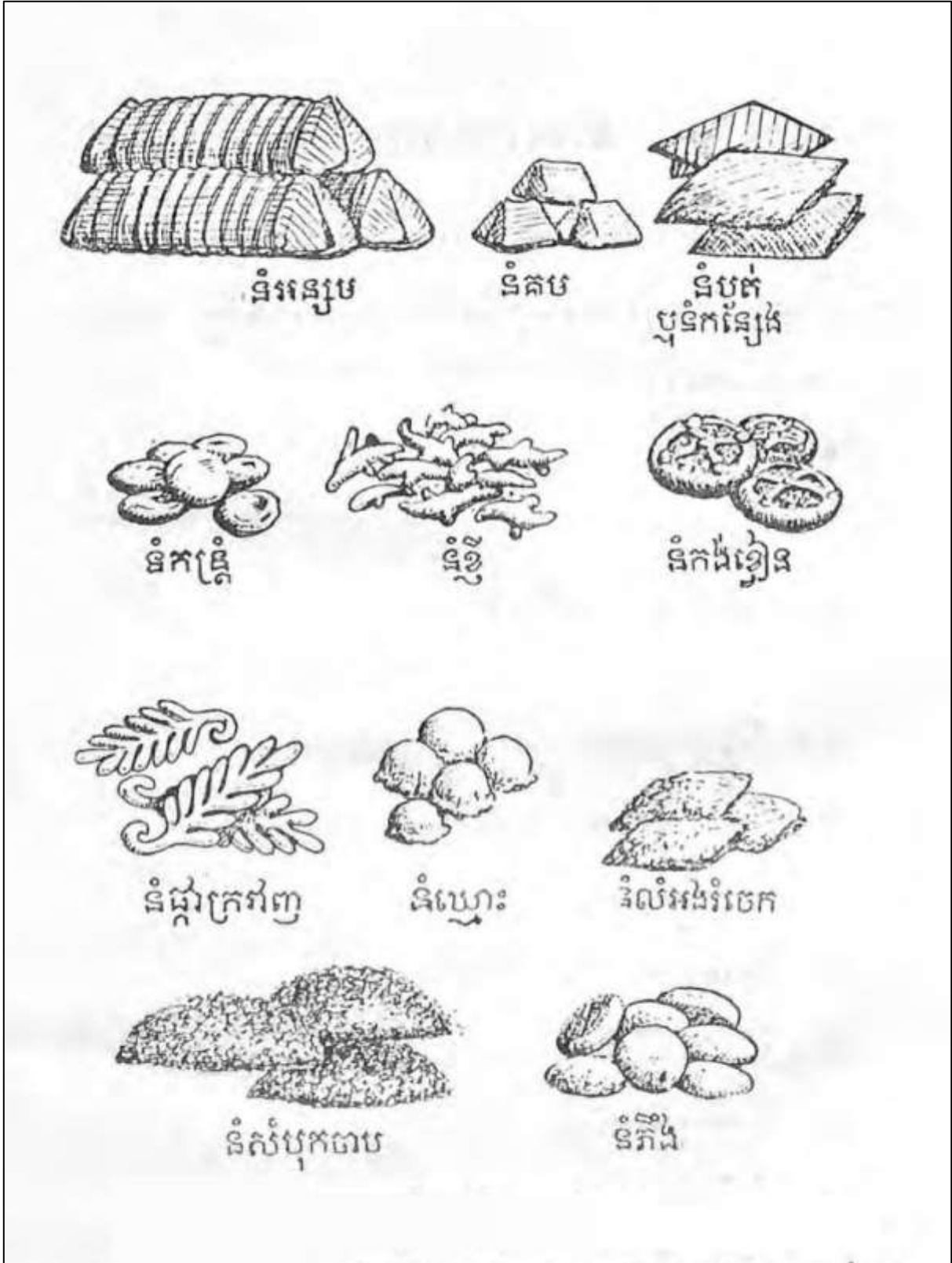
រូបលេខ១១ ទំនៀមរៀបរៀងផ្ទៃលើក្នុងពិធីមង្គលការ (ប្រភព៖ ញឹក នូវ ១៩៦៥: ១៩៨)