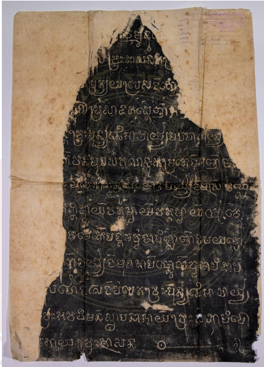
សំណៅសិលាចារឹកភូមិកំពឹងពួយ K.៩៥៧