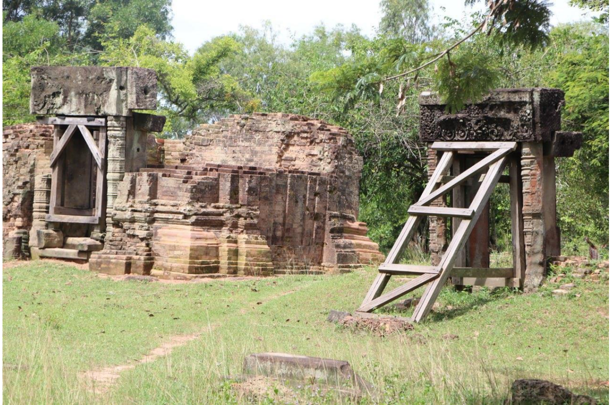
ប្រាសាទត្រពាំងរពៅ