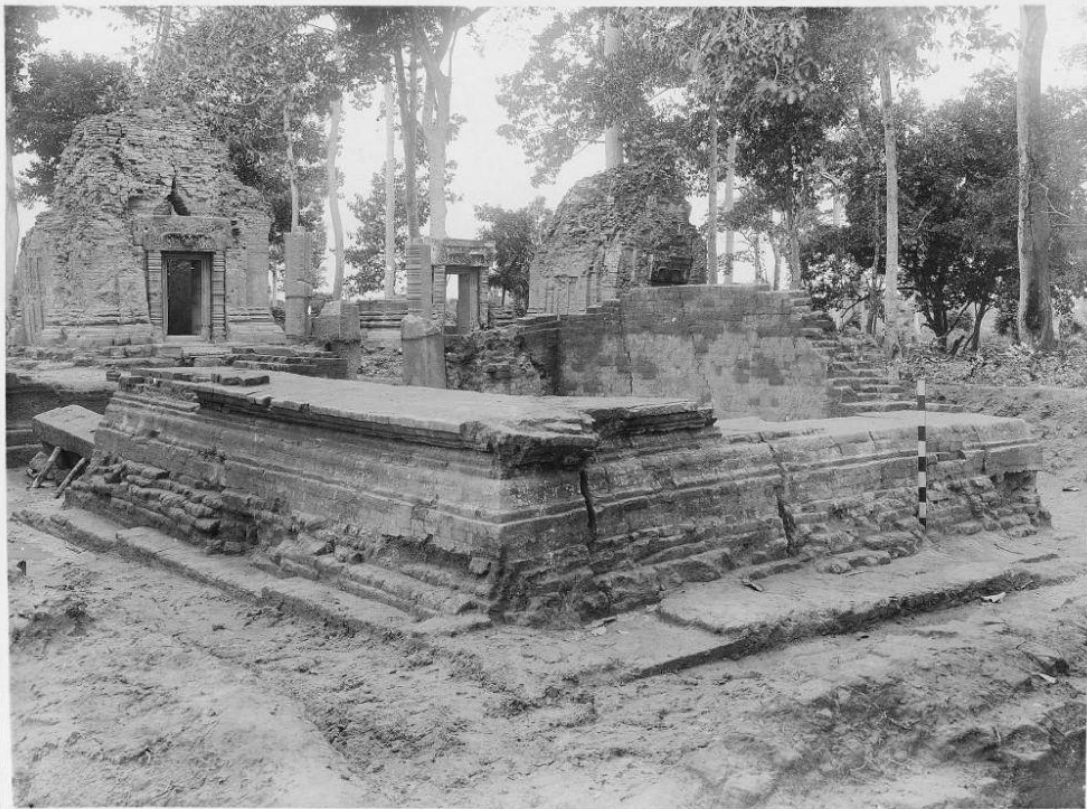
រូបថតហោព្រះភ្លើងនៅជ្រុងអាគ្នេយ៍ប្រាសាទ