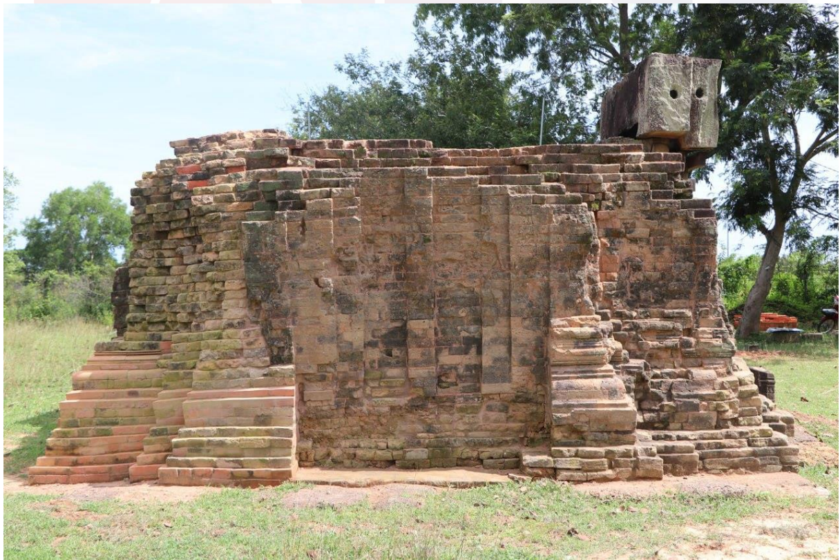
ប្រាសាទត្រពាំងរពៅ